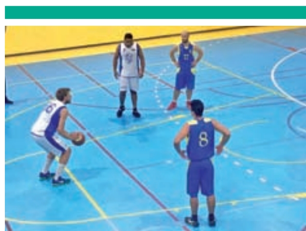
Nueva cita en el Pabellón Jesús España

Los parleños buscarán su cuarta victoria consecutiva a costa de un rival que es colista, pero que está a 6 unidades de la salvación.