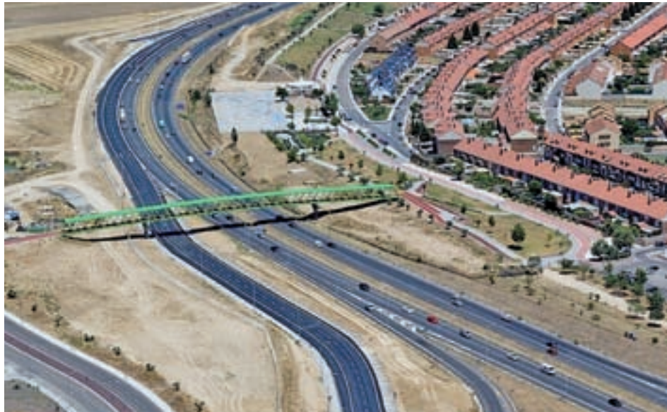
Autovía A-42 a su paso por Parla

Más de 20 alcaldes de localidades situadas en el Sur de la Comunidad de Madrid, entre ellas Parla, y de la comarca toledana de la Sagra mantuvieron la semana pasada una primera reunión en Illescas para reclamar mejoras en el transporte, las conexiones por carretera y las infraestructuras de ambas zonas fronterizas, que suponen un eje de comunicación entre las provincias de Madrid y Toledo.