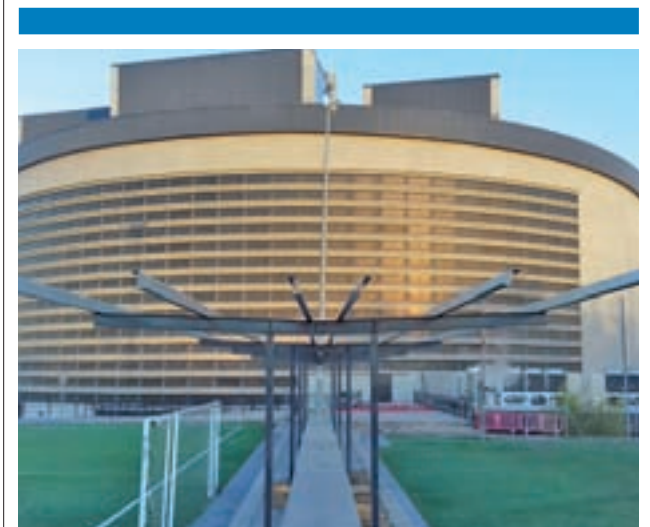
Pabellón Príncipes de Asturias

En el entorno de la vivienda, situada en el número 14 de la calle Palencia, habían acampado medio centenar de miembros de la Plataforma de Afectados por la Hipoteca (PAH) de Parla. La mujer afectada explicó que ella y su hijo ocuparon un piso propiedad de Bankia, que posteriormente se lo vendió a un fondo de inversión. Esta entidad se ha negado a facilitarles un alquiler social para quedarse en la vivienda.