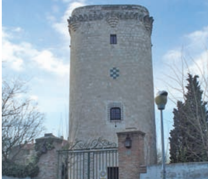
Torre de Éboli de Pinto