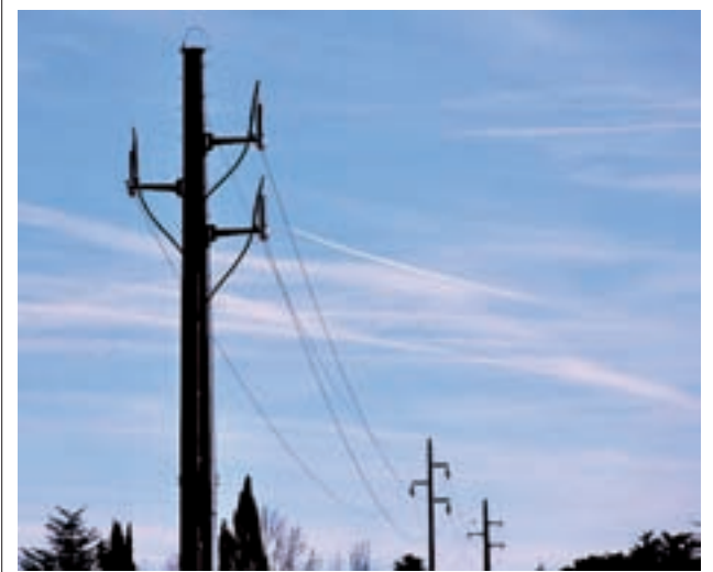
Líneas de alta tensión

Este proyecto "permitirá luchar por cumplir con el objetivo europeo de lograr antes de 2020 la reutilización y el reciclado del 50% del total de residuos que se generen", ha recordado el primer edil, que también mantuvo un encuentro con algunos de los comerciantes y restaurantes de la zona. Esta medida, junto a otras iniciativas como la recogida "puerta a puerta" del cartón y papel en los comercios, está mejorando tanto la recogida de residuos como el incremento en la limpieza de las islas de reciclado, contribuyen a disponer de una ciudad más limpia y sostenible, según el Consistorio.