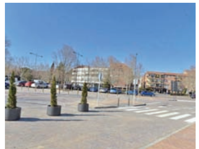
Nueva zona de estacionamiento

Junto al aparcamiento adoquinado se encuentra la zona en la que se coloca la plaza de toros que permite el estacionamiento también de otros 300 vehículos aproximadamente.