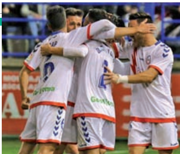
Empate en Extremadura RAYO MAJADAHONDA

El último encuentro que disputaron en el Cerro del Espino fue la victoria ante el Nástic, que significó el primer triunfo de la temporada en su campo. Con este panorama, el conjunto majariego se enfrenta a los malacitanos a quienes pusieron en apuros en la primera vuelta en La Rosaleda, donde perdieron por la mínima, pero dando buena imagen y demostrando