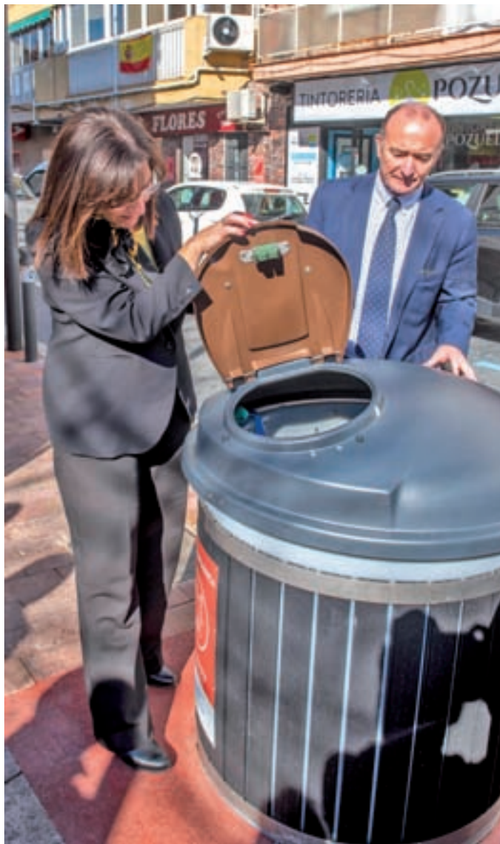
La alcaldesa y los contenedores

de la ciudad para interesarse por el desarrollo de esta iniciativa pionera en la ciudad y que está teniendo muy buena acogida entre los vecinos. Según los primeros datos recogidos, el porcentaje de separación en el contenedor de orgánica (de color marrón)