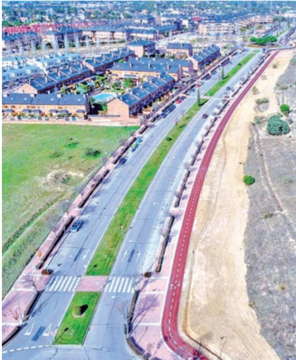
Carril bici en Boadilla del Monte

Este circuito que recorre la ciudad ha aumentado en cerca de diez kilómetros en lo que llevamos de legislatura y es capaz de unir de forma sostenible los nuevos desarrollos o zonas como el Palacio