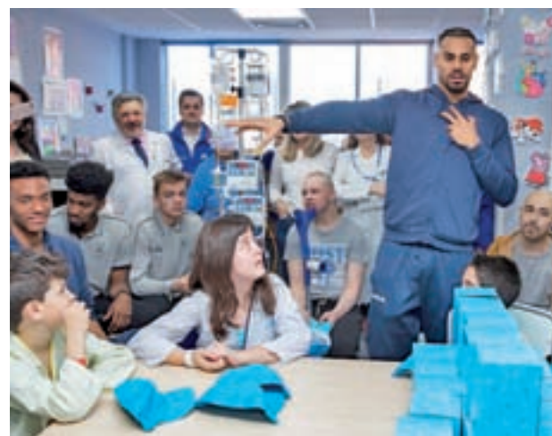
Momento de la visita

Los baloncestistas pudieron conocer el aula escolar con la que cuenta el 12 de Octubre, un espacio lúdico y educativo pensado para reducir el impacto que suponen los ingresos infantiles. Allí entregaron regalos a los niños que estaban realizando actividades y conversaron con ellos. Posteriormente se pasaron por las habitaciones para saludar al resto de pequeños.