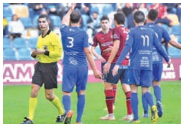
Partido en Pontevedra