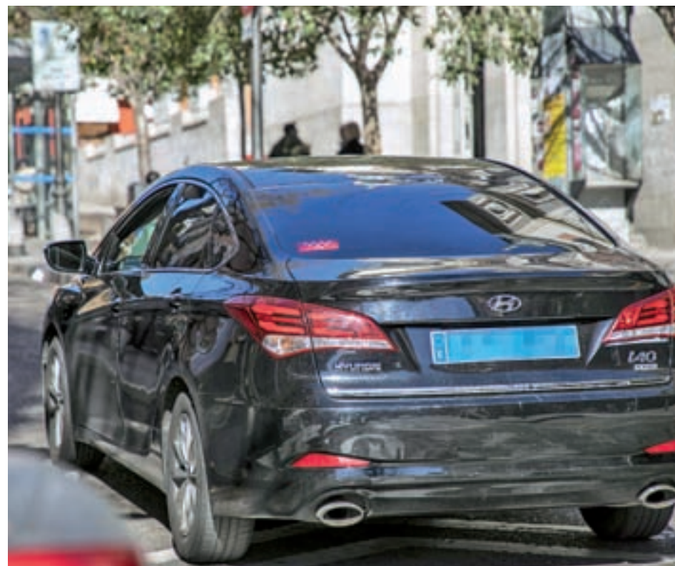
Vehículo VTC por las calles de Madrid

Las primeras reacciones al borrador no se hicieron esperar. La patronal de las empresas que gestionan los VTC, Unauto, pidió al Consistorio de la capital que evite adoptar medidas "precipitadas, fruto de la presión del taxi" y propuso que se "abra un diálogo" sobre esta normativa para no ir