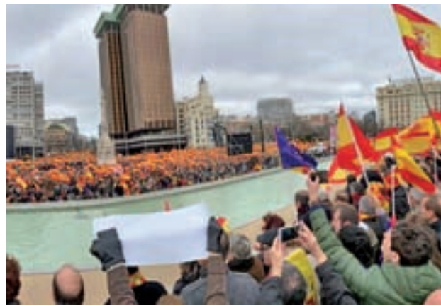
La protesta tuvo su epicentro en la Plaza de Colón de Madrid

Más radical, el líder de Vox, Santiago Abascal, exigió que se suspenda la autonomía de Cataluña y que se detenga al presidente catalán, Quim To-