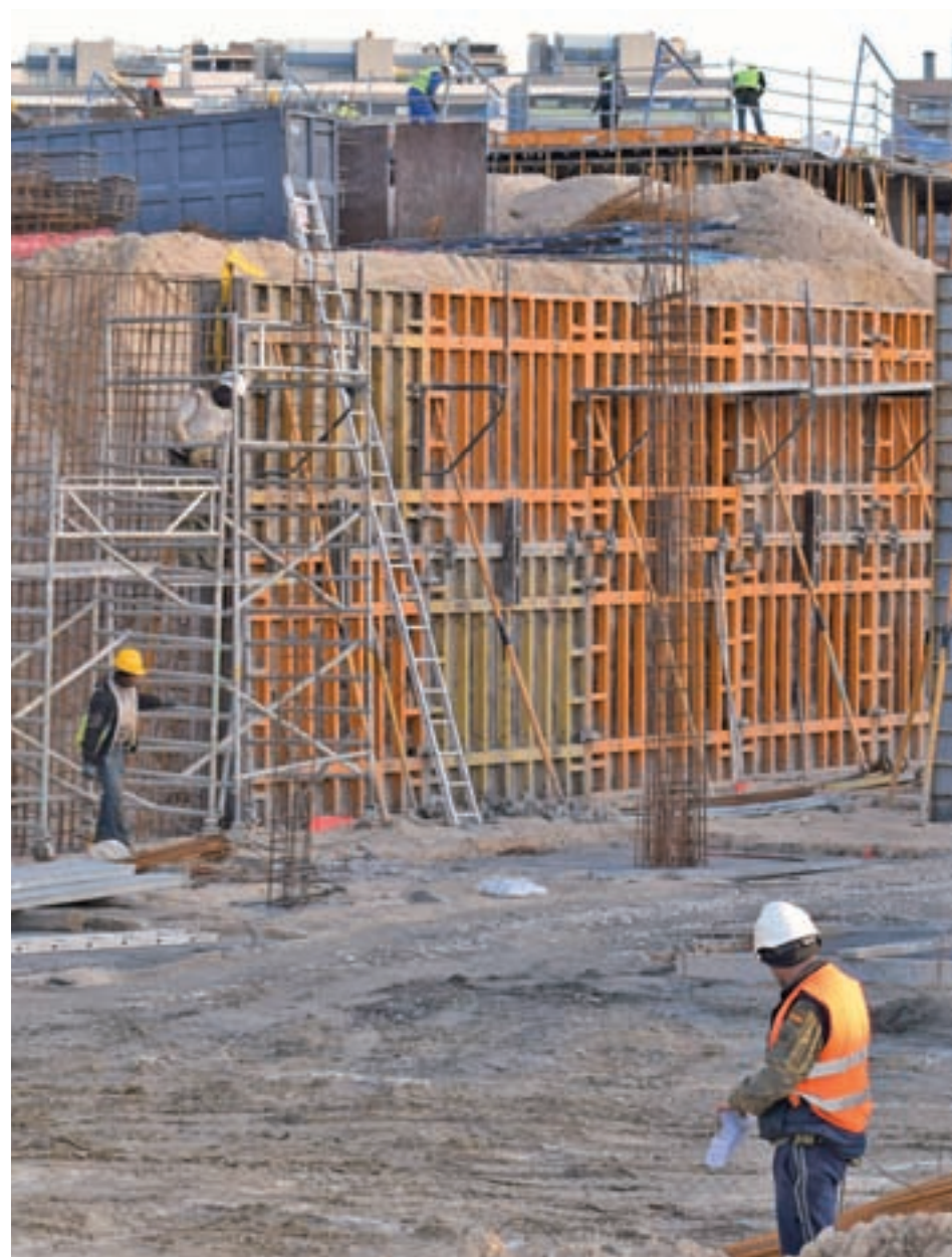
Viviendas en construcción en la Comunidad de Madrid

La APCE también menciona una cuestión ideológica. “Hay gobiernos municipales que creen que ya hay demasiadas viviendas y dilatan la concesión de licencias para frenar al sector”, señala su secretario general. Un argu-