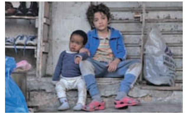
Zain Al Rafeea es el protagonista