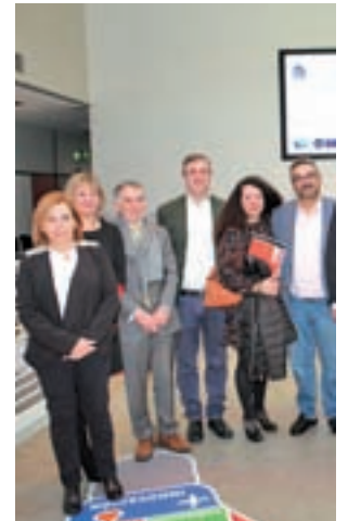
Parte de la red RECMA