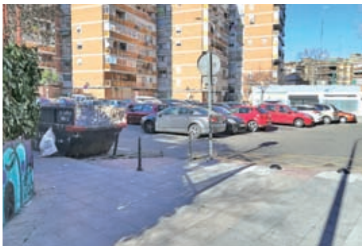
Superávit: El Ayuntamiento de Fuenlabrada ha destacado que parte del Plan de Inversiones Municipal se ha financiado gracias al superávit de 2017, que ascendió a casi 8,3 millones de euros.