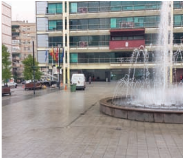
Ayuntamiento de Fuenlabrada