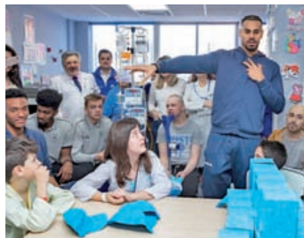
Momento de la visita

Los baloncestistas pudieron conocer el aula escolar con la que cuenta el 12 de Octubre, un espacio lúdico y educativo pensado para reducir el impacto que suponen los ingresos infantiles. Allí entregaron regalos a los niños que estaban realizando actividades y conversaron con ellos. Posteriormente se pasaron por las habitaciones para saludar al resto de pequeños.