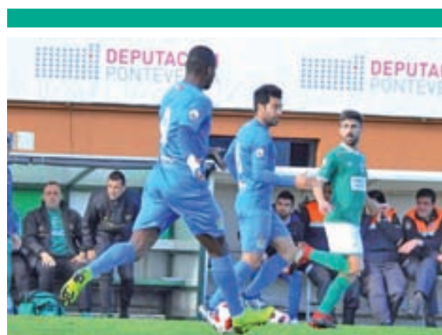
El CF Fuenlabrada, la pasada jornada CF FUENLABRADA

El rival tiene por delante el torneo del KO y ocupa la séptima plaza en la tabla.