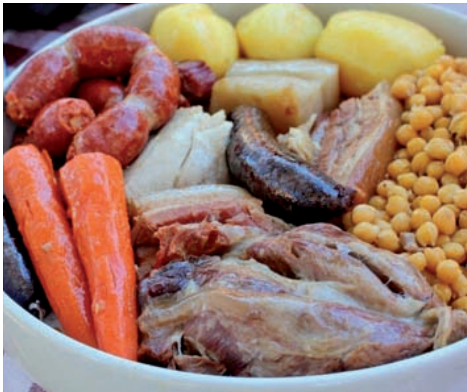
Plato de cocido madrileño

Por otro lado, seis son los restaurantes que mantienen la costumbre de servirlo en puchero de barro individual,