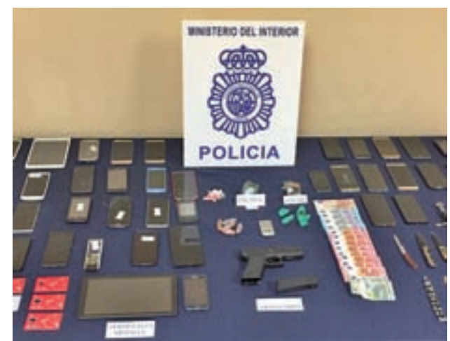
El resultado de la última operación policial

Cualquier persona puede aportar de forma anónima y confidencial algún tipo de información referente al tráfico de drogas a través de la cuenta de correo electrónico anti-droga@policia.es.