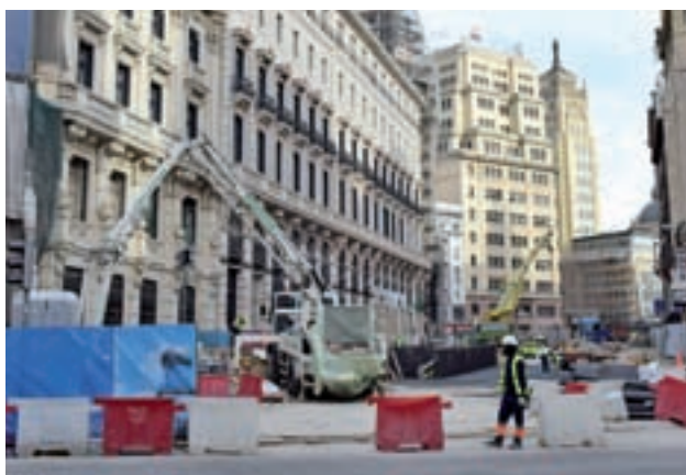
Las obras de Canalejas que afectan a Metro