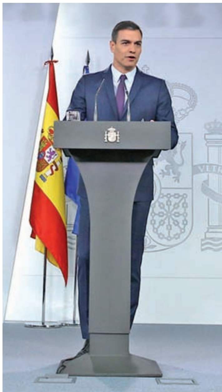
Sánchez convocó las generales el pasado viernes

La campaña de las generales comenzará oficialmente el día 12 de abril, mientras que la de las municipales, autonómicas