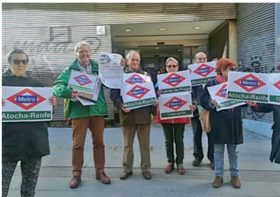
Los vecinos, a la salida del registro de Sol

Los residentes consideran que la actuación está en el plano puramente administrativo y es complicado acelerar los tiempos. "Urge que las administraciones sean capaces de tramitar los expedientes de obras con mucha más celeridad porque, en la práctica, somos los vecinos los que padecemos la situación y, en este caso, la saturación del centro de salud de Los Rosales", concluyen.