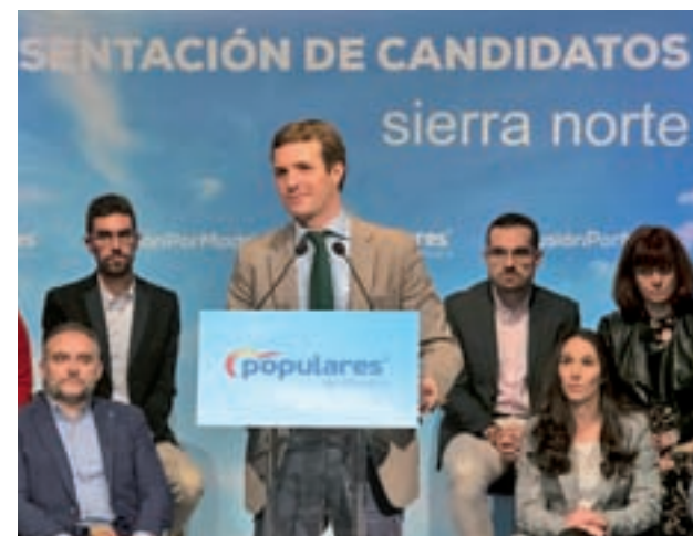
Pablo Casado en Torrelaguna

En los próximos días continuarán las designaciones de los populares. De hecho, para este fin de semana hay previsto un acto en San Sebastián de los Reyes para presentar a los candidatos a las alcaldías de la zona Norte. En la actualidad, el PP gobierna en Alcobendas, en Colmenar Viejo y en Tres Cantos, mientras que forma parte de la oposición en Sanse, donde el Ejecutivo está en manos del PSOE.