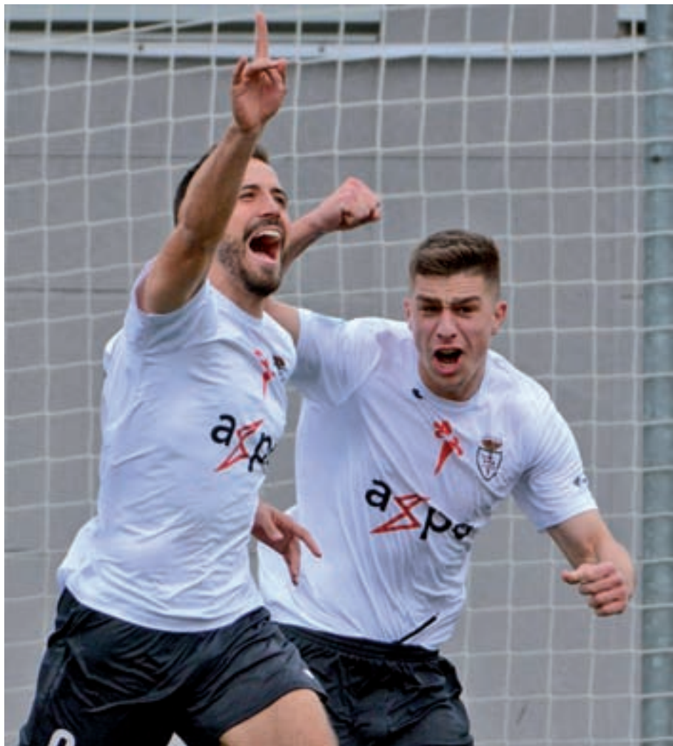
El Carabanchel sigue escalando puestos en la tabla

Así se presenta el apasionante Carabanchel-Villaverde San Andrés que se vivirá este domingo 24 (11:30 horas) en La Mina, con la sensación de que ninguno de los dos equipos puede hacer un favor a su vecino, más bien al contrario, ya que en el caso de derrotarlo le abocaría a un