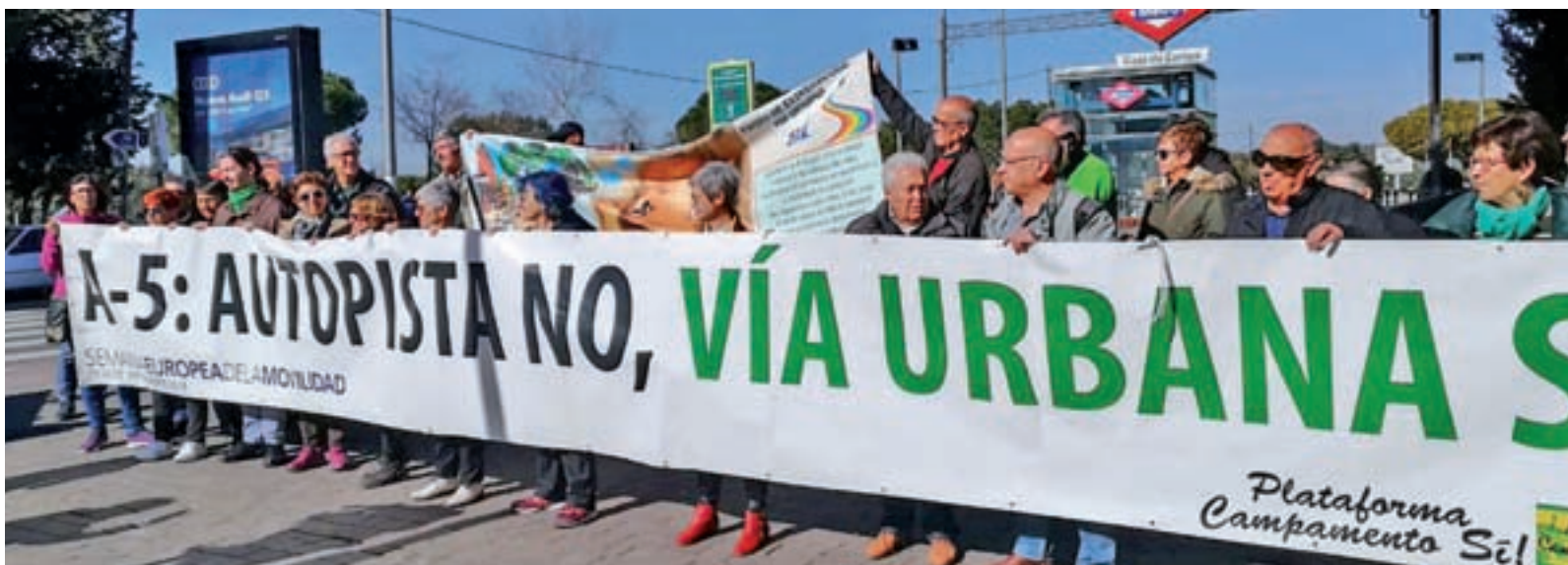
Un momento de la protesta vecinal, junto a la estación de Metro de Casa de Campo, el pasado 16 de febrero CAMPAMENTO SÍ