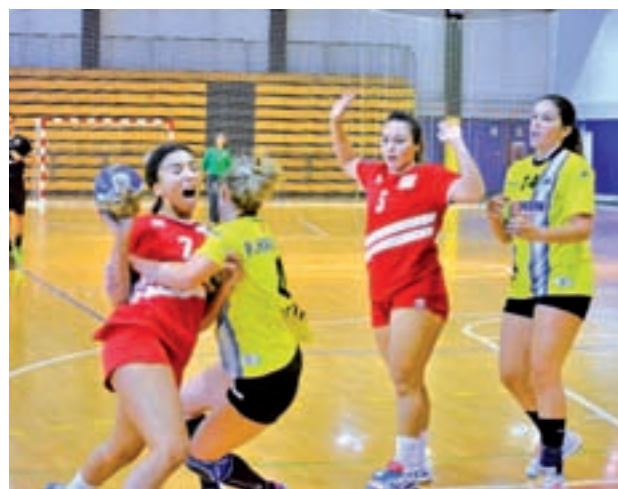
Las madrileñas son undécimas en la tabla

En medio de este bache de resultados se produce este sábado 23 (18 horas) la visita a Plata y Castañar del Universidad de Granada, un equipo que, curiosamente,