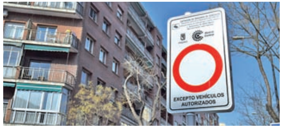
Restricciones de acceso a Lavapiés por Madrid Central

Movilidad del Consistorio de la capital, Inés Sabanés, reconoció su existencia, aunque aseguró que es una cuestión "mínima". En cualquier caso, admitió que tendrán que actuar contra estas infracciones, ya que suponen "un fraude".