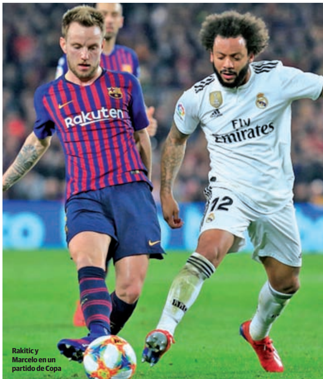
Rakitic y Marcelo en un partido de Copa

Los decibelios de aquella tormenta de 'Clásicos' contrastan con el descafeinado Barça-Madrid que se vivió en la pasada temporada. La programación de ese partido para la jornada 36 era un arma de doble filo; podría servir para decantar el campeonato, pero contrariamen-