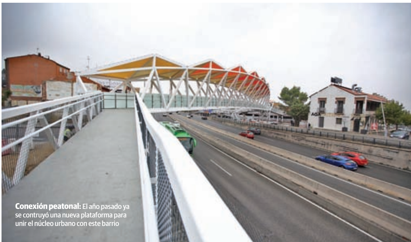
Conexión peatonal: El año pasado ya se contruyó una nueva plataforma para unir el núcleo urbano con este barrio