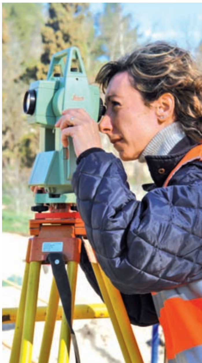
Las mujeres siguen cobrando menos que los hombres GENTE

Una vez expuesta la situación, UGT plantea como solución la elaboración y puesta en marcha de una Ley de Igualdad Salarial, que supondría la creación de un órgano público en el que se puedan manejar datos reales de empresas, con representación de diferentes interlocutores sociales, y obligar a las compañías de 25 trabajadores o más a