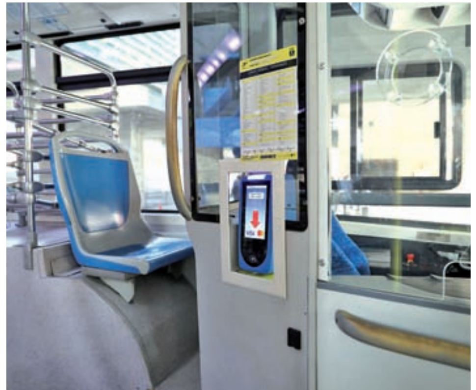
Una de las máquinas que permiten pagar el billete sin dinero

Según fuentes municipales, esta forma de abono del título de transporte favorece a los usuarios menos habituales de autobús, es decir, aquellos que usan la red de forma esporádica y adquieren un billete sencillo, y para aquellos de los restantes servicios