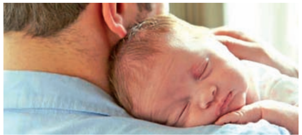
El permiso de paternidad se situaría en ocho semanas en 2019

ma retribución, satisfecha directa o indirectamente, y cualquiera que sea la naturaleza de la misma, salarial o extrasalarial, sin que pueda producirse discriminación alguna por razón de sexo en ninguno de los elementos o condiciones de aquella".