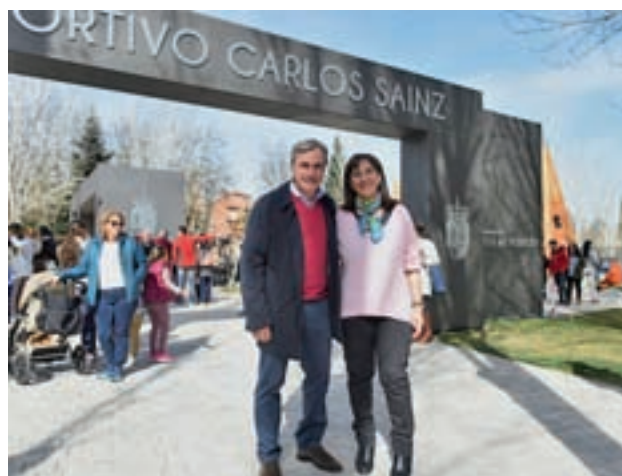
El acto de presentación

El recinto también tiene dos grandes áreas infantiles