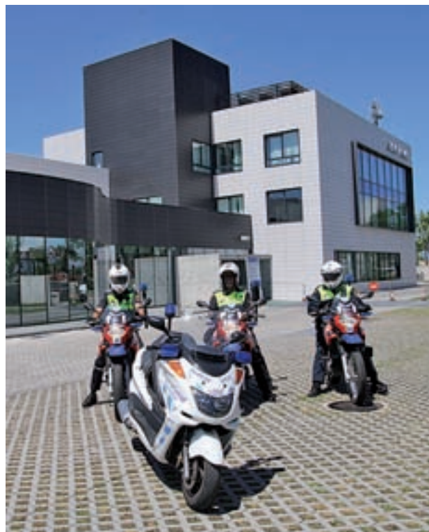
Policía Local de Majadahonda

Fuentes de la Guardia Civil explicaron GENTE que el suceso fue un "altercado entre aficionados" de diferentes conjuntos y niegan que