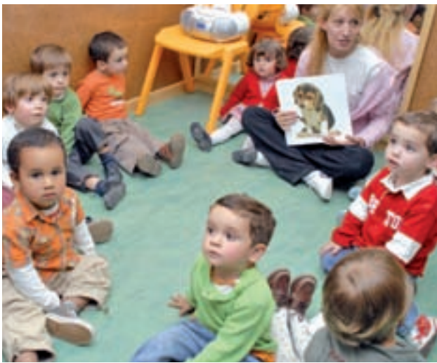
Escuela infantil en Madrid GENTE