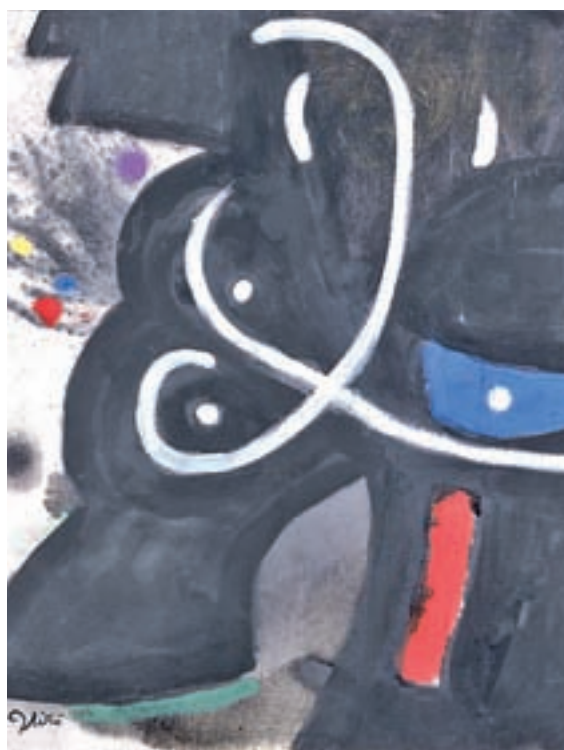
UN MIRÓ DE 4 MILLONES: La obra 'Personnage et oiseau, 27 juillet' (1963), de Joan Miró, con un precio de cuatro millones de euros, es una de las piezas más caras de la edición número 38 de ARCOMadrid.