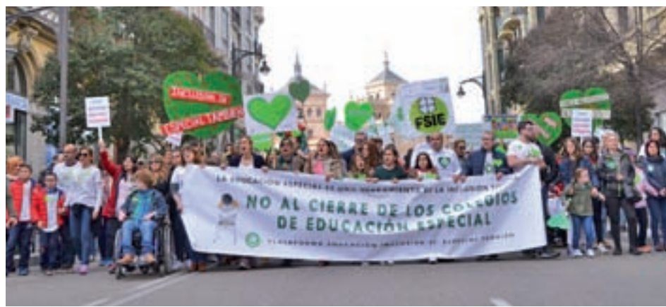
Protesta en contra del cierre de los colegios de educación especial

Al otro lado están organizaciones como la Plataforma Educación Inclusiva Sí, Especial También, integrada por personas con discapacidad, familias y docentes, que niega que haya dos sistemas paralelos, sino solo uno donde