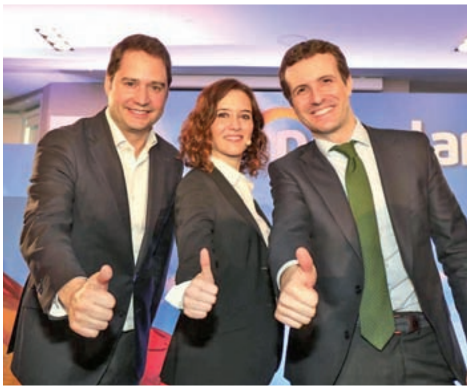
Pablo Casado junto al alcalde de Torrejón, Ignacio Vázquez

El Consejo de Administración, en el que están representados todos los ayuntamientos de la región, los sindicatos, la patronal del transporte, los usuarios y consumidores y la Comunidad de Madrid, exige así la