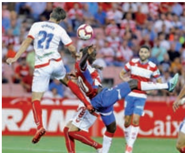
Partido ante el Granada de la primera vuelta RAYO MAJADAHONDA

El Rayo Majadahonda recibe este domingo 3 de marzo al Granada en el Cerro del Espino. Este será el segundo partido consecutivo en casa contra uno de los aspirante al ascenso a Primera División tras recibir hacer quince días al