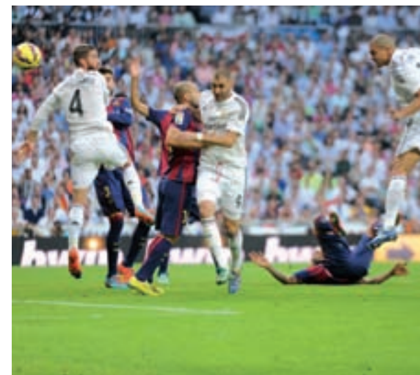
Imagen del gol de Pepe en la temporada 2014-2015

va; en 8 de esos partidos dejó su portería a cero. Esa solidez será puesta a prueba por la dupla más efectiva del campeonato. Messi (25 goles) y Luis Suárez (16) siempre suponen una amenaza seria, sobre todo en el caso del argentino, quien tiene en el Madrid a su 'víctima' predilecta: ya ha celebrado 15 tantos en Chamartín.