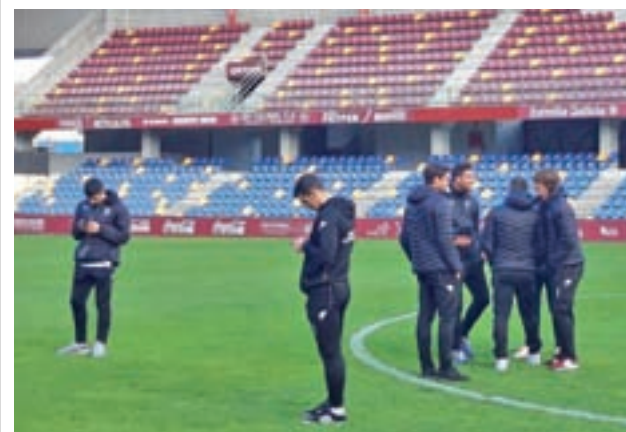
Internacional de Boadilla

El principal rival del Rayo en su lucha por la permanencia será el conjunto extremeño, que esta semana tiene una visita complicada ante la Unión Deportiva Las Palmas que necesita puntuar para luchar por los 'play-off'.