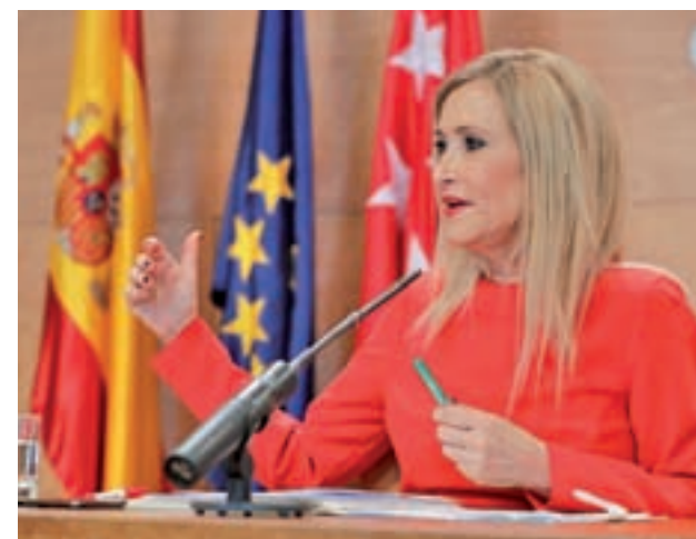
Cristina Cifuentes, cuando era presidenta regional

Su sucesora como candidata popular a la Presidencia de la Comunidad de Madrid, Isabel Díaz Ayuso, mostró su sorpresa por esta petición de cárcel tan elevada y denunció "un linchamiento injustificable". También se pronunció Ángel Garrido, el hombre que sucedió a Cifuentes al frente del Gobierno regional, que señaló que "siempre he confiado en su inocencia y lo sigo haciendo", aunque añadió que respeta las decisiones judiciales.