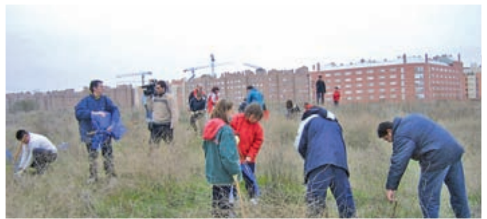
Una de las plantaciones de árboles realizada por los residentes en el Bosque de El Humedal

El espacio contará con tiendas, atracciones deportivas como un lago de olas artificiales y una gigantesca zona de restauración.