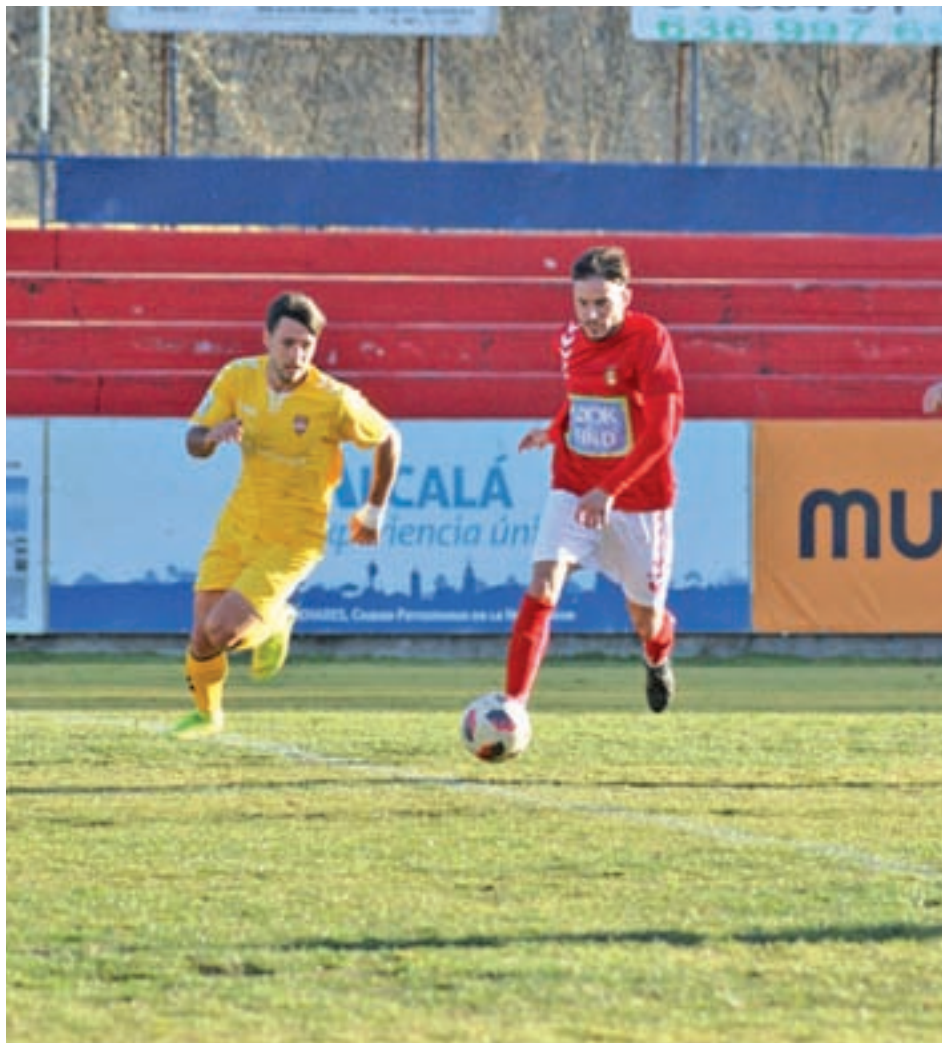
El partido se jugará en un horario poco habitual: domingo, 16 horas

Los rojillos sólo han podido sumar hasta la fecha 28 puntos, un botín que les hace mirar de reojo a la zona de descenso. En estos momentos, el primer equipo en caer a Preferente sería el Pozuelo, cuarto por la cola, que tiene seis puntos menos que los alcalaínos, un margen que invita a los de Jorge Martín de