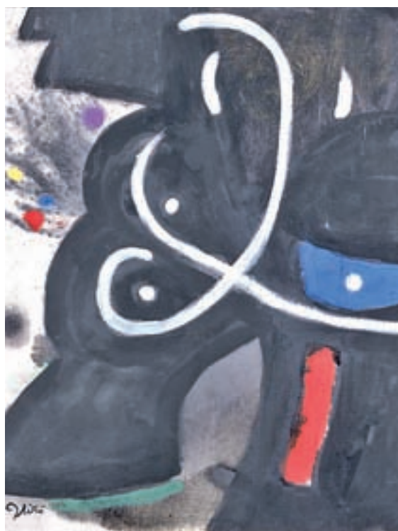
UN MIRÓ DE 4 MILLONES: La obra 'Personnage et oiseau, 27 juillet' (1963), de Joan Miró, con un precio de cuatro millones de euros, es una de las piezas más caras de la edición número 38 de ARCOmadrid.