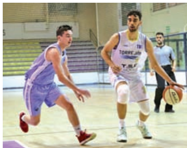
El Tec Moon Torrejón es sexto

Esa victoria permite a los alcalaínos mantener cierto margen respecto a su inmediato perseguidor, el Majadahonda (tiene un balance de 13-3), a la espera de lo que suceda en la jornada de este