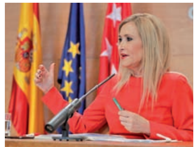
Cristina Cifuentes, cuando era presidenta regional

Su sucesora como candidata popular a la Presidencia de la Comunidad de Madrid, Isabel Díaz Ayuso, mostró su sorpresa por esta petición de cárcel tan elevada y denunció "un linchamiento injustificable". También se pronunció Ángel Garrido, el hombre que sucedió a Cifuentes al frente del Gobierno regional, que señaló que "siempre he confiado en su inocencia y lo sigo haciendo", aunque añadió que respeta las decisiones judiciales.