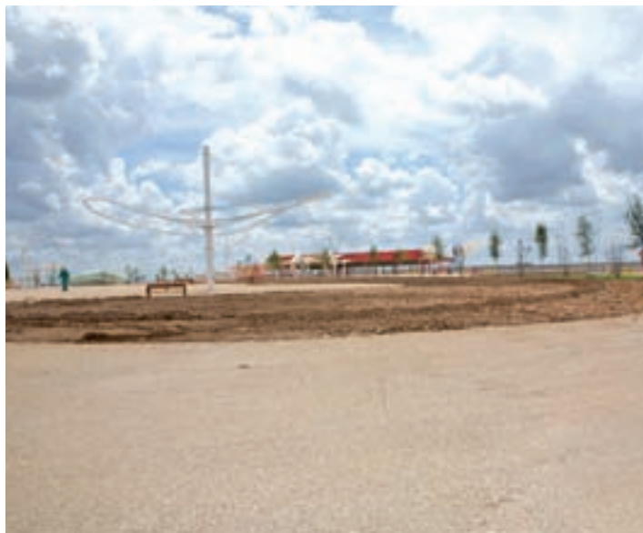
Futuros terrenos del desarrollo logístico

De esta manera, se ha conseguido un ahorro del coste económico del 38 % respecto al planeamiento inicial, pasando de 134 millones de euros a 83. Con esta modifica-