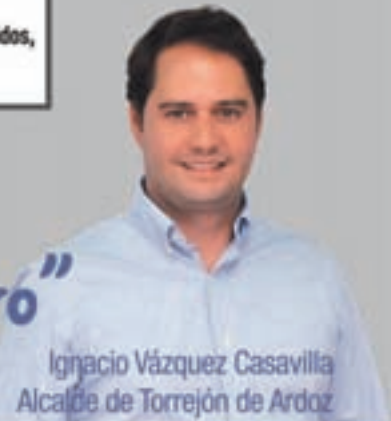
Ignacio Vázquez Casavilla Alcalde de Torrejón de Ardoz

“Estas son 40 iniciativas que proyectan el Torrejón del futuro”