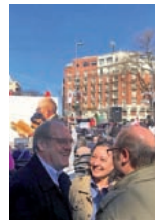
Gabilondo, durante un acto

"No excluyo a nadie, de entrada lo que veo es que coincido más con aquellos que creen que hay situaciones de emergencia social, con quienes creen que las políticas públicas son decisivas y la lucha contra la desigualdad es clave", señaló.