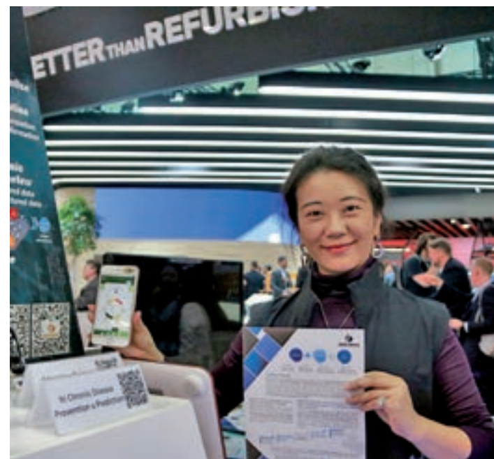
Aquest aparell prediu quines malalties pots arribar a tenir. ACN