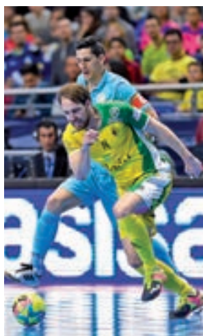
El Jaén defiende su título

éxito aún fresco, la competición con más tirón de esta disciplina se celebra este fin de semana en otro recinto de