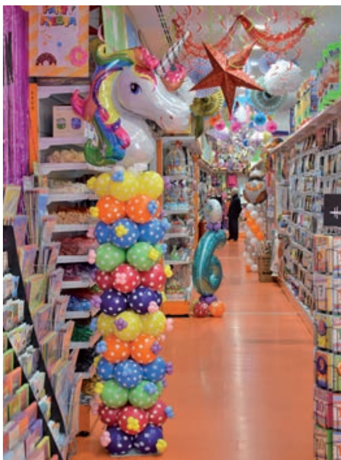
La temática de unicornios sigue triunfando

Gabriela Hernández, responsable de marketing de la cadena de artículos de fiesta y disfraces Party Fiesta explica a GENTE que los “trajes basados en series populares, como Juego de Tronos o Vikingos, así como los fundamentados en videojuegos, como Mario Bross o Fornite” se sitúan en la lista de los más ven-