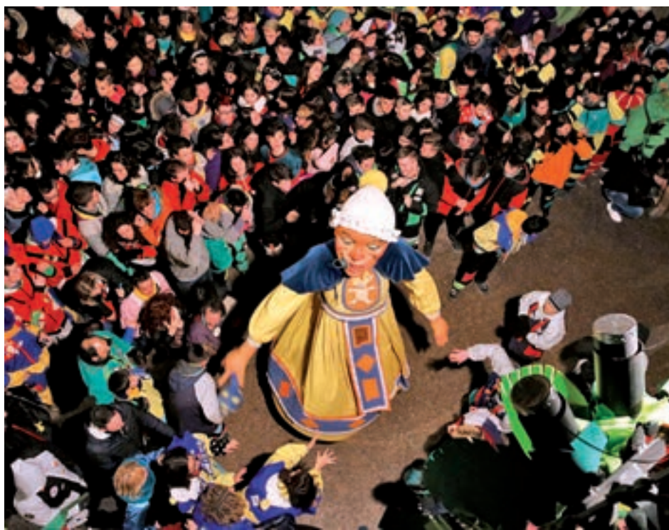
Tota Catalunya acull festes en motiu de l'arribada del Carnaval.

Entre totes aquestes rues destaca el Carnavalassu, que recorrerà diversos espais del