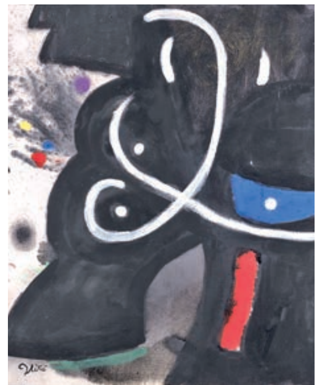
UN MIRÓ DE 4 MILLONES: La obra 'Personnage et oiseau, 27 juillet' (1963), de Joan Miró, con un precio de cuatro millones de euros, es una de las piezas más caras de la edición número 38 de ARCOmadrid.