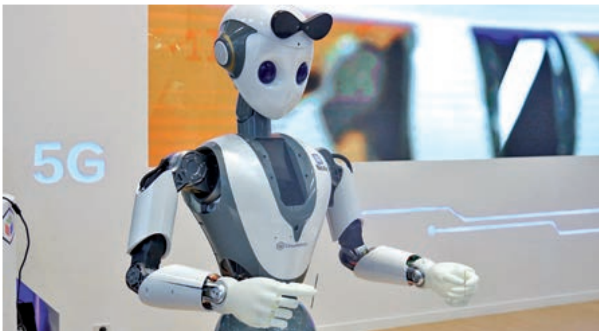
La Nicole, un robot humanoide desenvolupat per CloudMinds dissenyat per cosir i fer altres feines de la llar. ACN