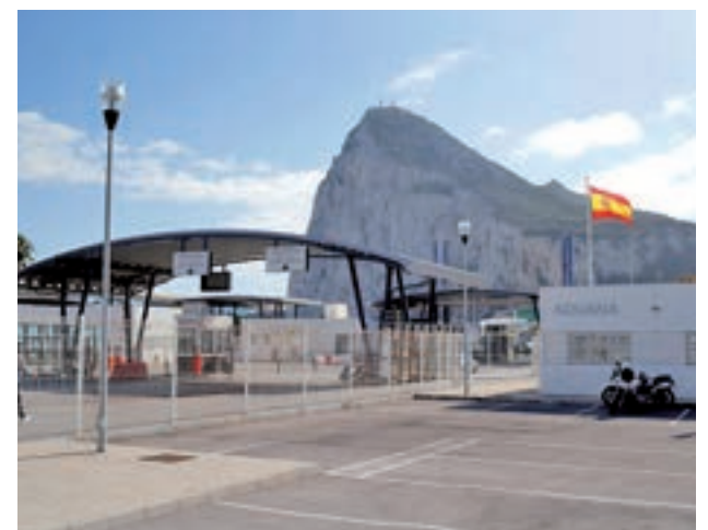
El proyecto se conoció en 2017