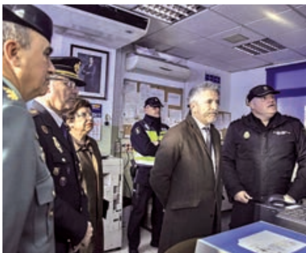
Fernando Grande-Marlaska, ministro del Interior