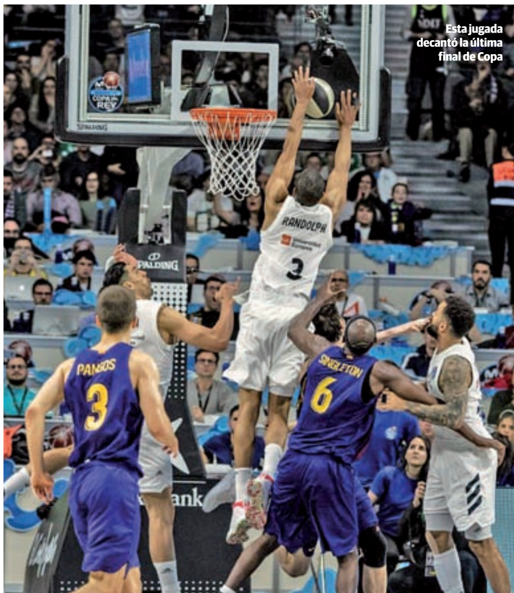
Esta jugada decantó la última final de Copa

Y en medio de todo esto, el calendario de la Liga Endesa depara otro 'Clásico' en el que, si bien no hay título en juego, sí se puede decir que podría tener consecuencias importantes en a medio plazo. El Barça se presenta en la capital como líder en solitario de la clasificación, aunque el hecho de tener un solo triunfo de ventaja respecto al segundo clasificado, el Real Madrid, le coloca en la tesitura de poder perder esa privilegiada posición en caso de caer en el recinto de la calle Goya. En este contexto conviene recordar que el precedente de la ida también da un importante margen de maniobra a los hombres de Pesic, quienes gracias a aquel triunfo por 86-69 se pueden permitir caer por menos de 17 puntos para