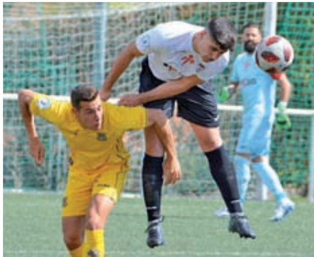
El Carabanchel ganó al Alcorcón B (0-3)

Por su parte, el Carabanchel tratará de dar continuidad a la buena racha de resultados recibiendo en La Mina a un Santa Ana que sigue en caída libre. El cuadro de Fuencarral lleva sin ganar desde el pasado 20 de enero.