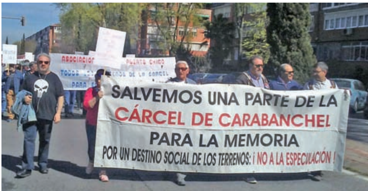
La cabecera que partió del distrito de Latina