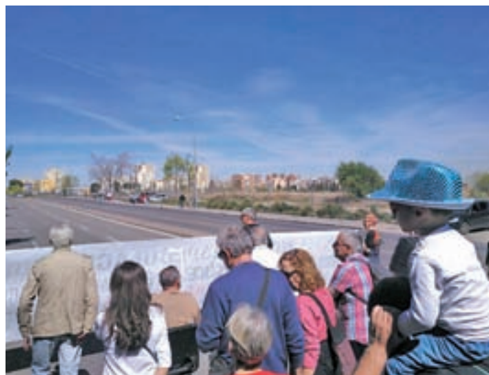
Dos cabeceras: La marcha ciudadana tuvo dos columnas que partieron del Parque de Aluche y de la Plaza de la Emperatriz y finalizaron a las puertas de la antigua prisión en la Avenida de los Poblados. Los vecinos recordaron que en 2007 Esperanza Aguirre prometió la construcción del hospital.

La falta de planes para esta gran parcela de 172.000 metros cuadrados, situada entre los distritos de Latina y Carabanchel, ha vuelto a movilizar a sus vecinos más de una década después. En la