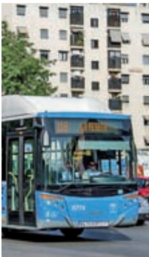
Uno de los autobuses

La Empresa Municipal de Transportes (EMT) reforzará el servicio de 22 de sus líneas que recorren casi todos los distritos en las dos últimas semanas de marzo. Desde este lunes, cuentan con más vehículos los itinerarios 24 (Atocha Renfe- El Pozo), 28 (Puerta Alcalá- Bº Canillejas), 42 (Plaza Castilla- Bº Peñagrande), 113 (Méndez Álvaro- Ciudad Lineal), 162 (Moncloa- El Barrial), 165 (Alsacia- Hospital Ramón y Cajal), 176 (Plaza Castilla- Las Tablas Sur), 210 (Diego de León- La Elipa), E3 (Felipe II- Valdebernas), E4 (Felipe II- Valdebernardo) y T61 (Estación Fuenarral- Las Tablas). Además, el próximo 25 de marzo incrementarán su dotación las rutas 19, 46, 49, 56, C2, 77, 83, G, 114, 118 y 138.