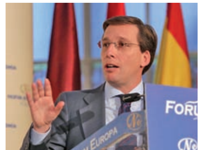
Martínez-Almeida, en el foro Nueva Economía

Por otro lado, el PP pretende crear una Oficina Digital de Madrid con competencias transversales para transformar todos los servicios que ofrece el Consistorio.