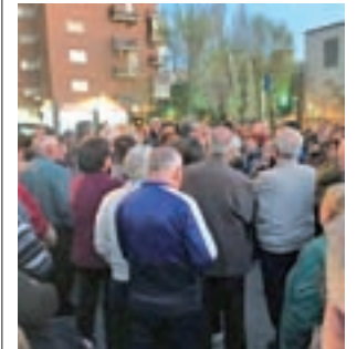
El acto del 11 de marzo

El Pleno de Carabanchel de este mes ha aprobado por unanimidad una iniciativa de Ciudadanos para solicitar la remodelación integral de la calle de María Odiaga, actualmente muy deteriorada.