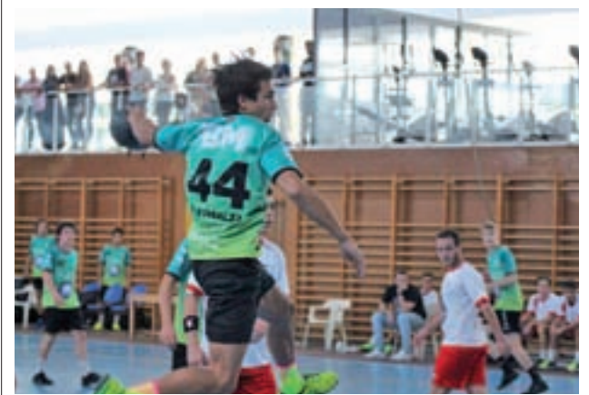
El Ikasa BM Madrid, uno de los favoritos