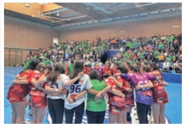
El Sanse celebrando la victoria

El rival del Sanse para este domingo, el Coruxo FC, está noveno, con 43 puntos, después de haber empatado a 1 con el Deportivo Fabril el pasado fin de semana.