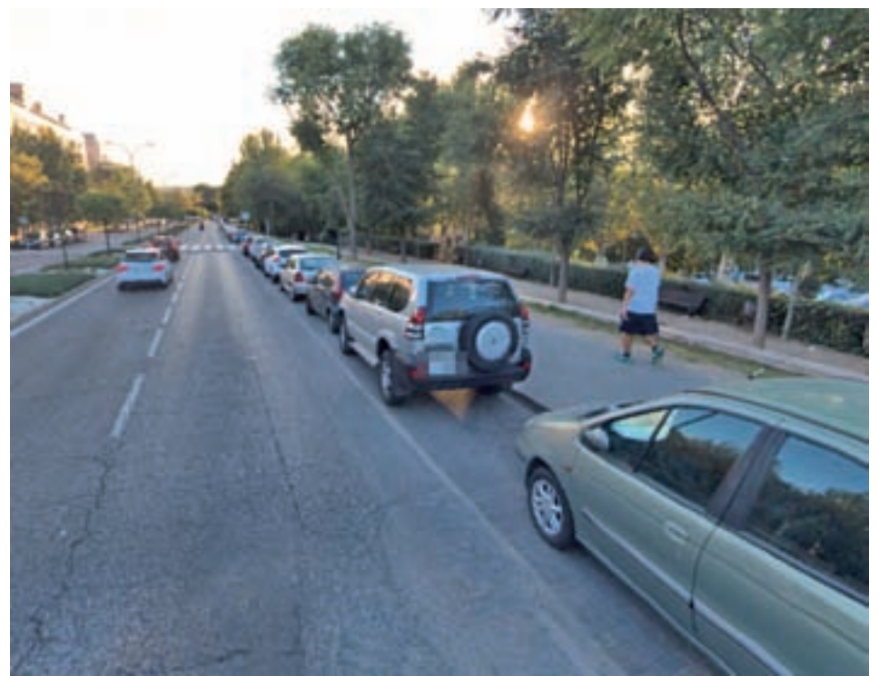
El aparcamiento en algunas calles como el Paseo de Europa pasará a ser en batería

A partir del escenario 3 (dos días consecutivos superando los 200 mg/m 3 ) se permitirá el estacionamiento de vehículos en las plazas y horario afectado por la zona ORA en todo el municipio, con "el objeto de fomentar el