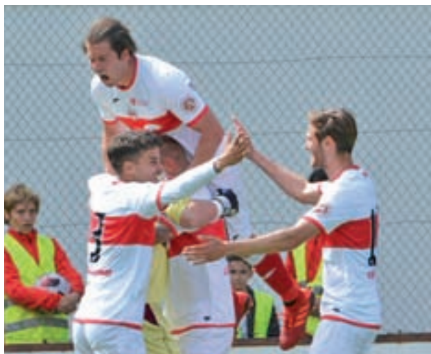
El Sanse celebrando un gol

La UD Sanse se va a enfrentar este domingo 24 de marzo a las 17 horas al Coruxo FC, en un encuentro en el que jugará como visitante y al que llega después de un peculiar partido en el que ganó 1-2 a la Unión Adarve.