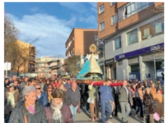
Traslado de marzo de 2018

La Virgen de la Paz es trasladada en procesión cada 25 de diciembre, Día de Navidad, desde su Ermita hasta la Iglesia de San Pedro, don-