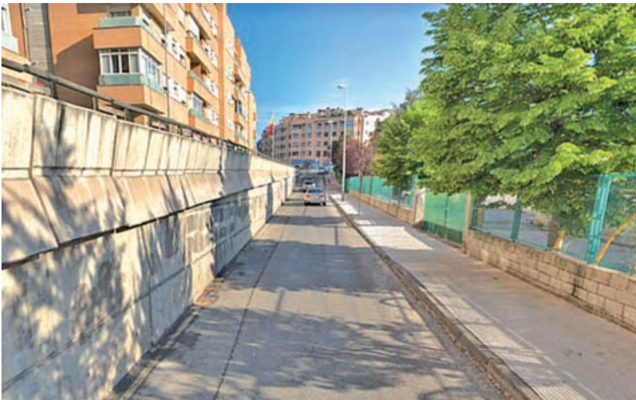
La promoción está situada a la derecha de la imagen, donde está el Vivero Las Jaras