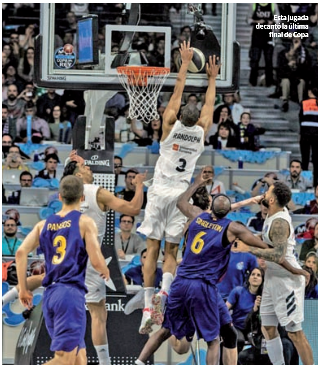
Esta jugada decantó la última final de Copa

Y en medio de todo esto, el calendario de la Liga Endesa depara otro 'Clásico' en el que, si bien no hay título en juego, sí se puede decir que podría tener consecuencias importantes en a medio plazo. El Barça se presenta en la capital como líder en solitario de la clasificación, aunque el hecho de tener un solo triunfo de ventaja respecto al segundo clasificado, el Real Madrid, le coloca en la tesitura de poder perder esa privilegiada posición en caso de caer en el recinto de la calle Goya. En este contexto conviene recordar que el precedente de la ida también da un importante margen de maniobra a los hombres de Pesic, quienes gracias a aquel triunfo por 86-69 se pueden permitir caer por menos de 17 puntos para