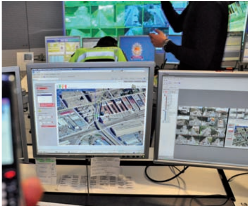
Las peleas tienen normas establecidas con anterioridad

Los hechos ocurrieron el pasado día 16 de febrero, si bien no fueron denunciados hasta que las imágenes se