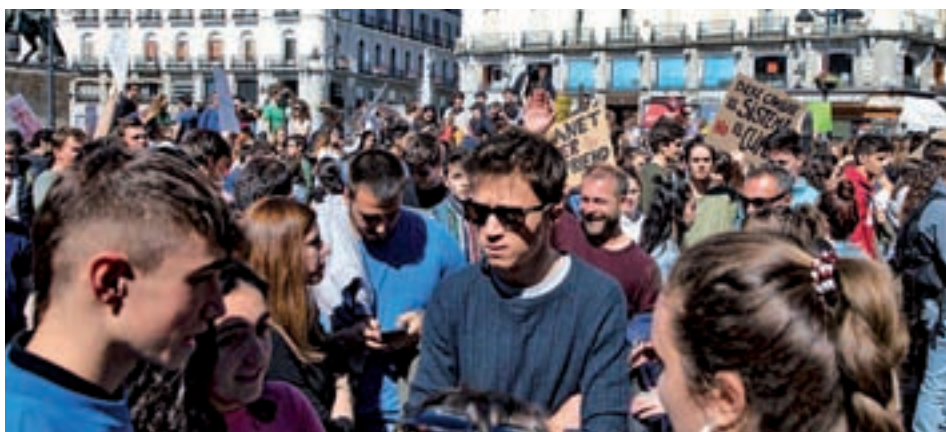
Errejón, durante una protesta contra el cambio climático