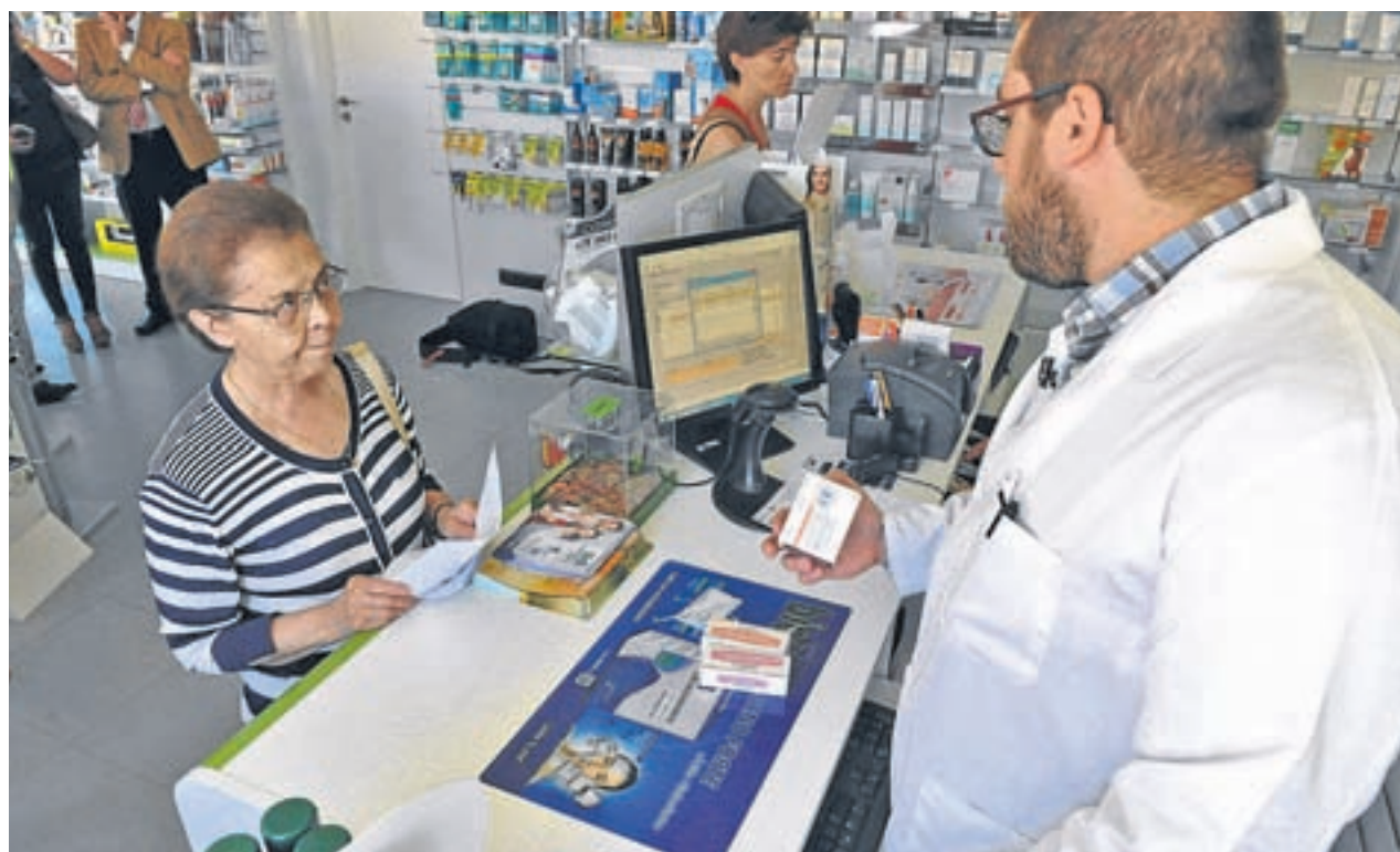
Pacientes recogiendo sus medicamentos en una farmacia

Los madrileños que intentaron recoger sus medicamentos con su tarjeta sanitaria en farmacias situadas en otras comunidades autónomas se encontraron este lunes 18 de marzo, primer día de la unificación, con problemas técnicos que les impidieron realizar la operación. El Ministerio de Sanidad señaló que se solucionarán en los próximos días.