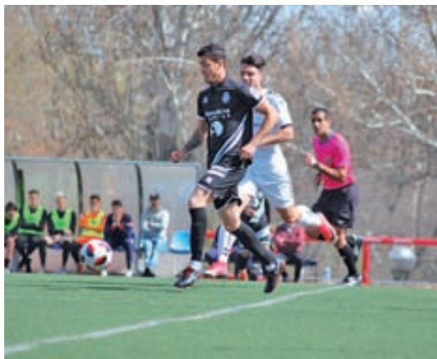
El Sport no dio opción al San Fernando (3-0)

El Grupo VII de Tercera División celebra este fin de semana su jornada número 30, unas alturas de campeonato en las que los errores parecen tener un impacto mayor. Por ello, la RSD Alcalá parece obligada a sacar algo positivo