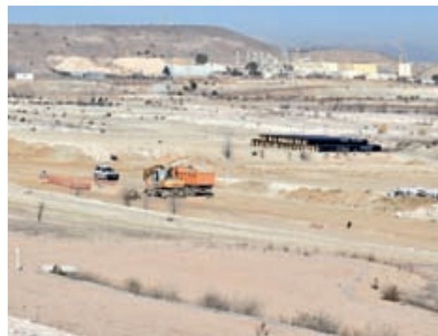
El trámite permitirá el desarrollo de las unidades 1 y 3

“Se ha dado un paso más de la materialización de la estrategia del Sureste”, enfatizó Calvo. El edil de Ahora Madrid agregó que el convenio “establece la obligación de modificar la ordenación antes