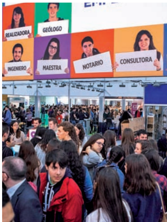
Edición anterior de AULA

La Semana de la Educación, marco en el que se celebra AULA, es el punto de encuentro que reunirá en 5 días a más de 146.000 visitantes, entre estudiantes, familias, docentes, orientadores, responsables de centros educativos y profesionales, tanto nacionales como de fuera de nues-