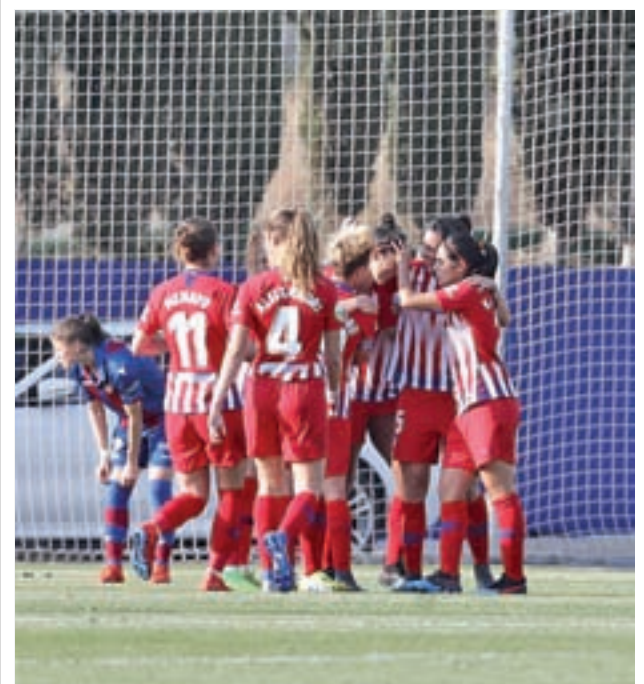
El Atlético dio un golpe de autoridad ante el Levante (0-4)

A la misma hora, el Movistar Estudiantes visitará el Buesa Arena para medirse con un Kirolbet Baskonia que es tercero en la tabla, a un solo triunfo del Real Madrid, por lo que, además de buscar su propio interés, el cuadro colegial puede ayudar a sus vecinos.