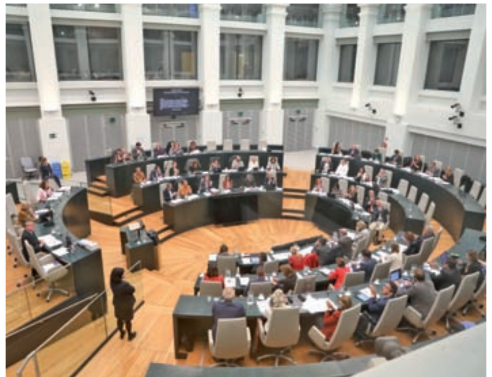
Pleno de Cibeles del pasado miércoles

Según recoge el plan, las viviendas que se alquilen para alojamiento turístico durante más de 90 días al año deberán solicitar licencia de uso terciario de hospedaje. Además incluye la obligatoriedad de que cuenten con un acceso independiente. El cálculo que maneja el Consistorio es que en torno al 95% de las inscritas en el registro de la