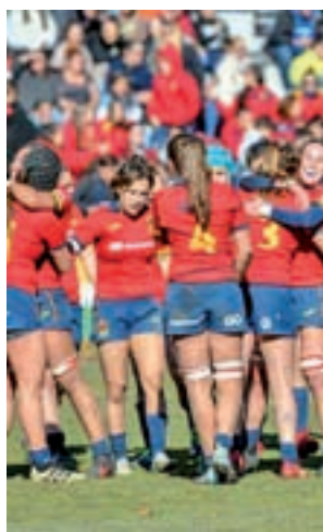
La selección juega en casa

en un deporte como el rugby, que en su vertiente femenina está muy alejado del profesionalismo en nuestro país, adquiere tintes de gesta histó-