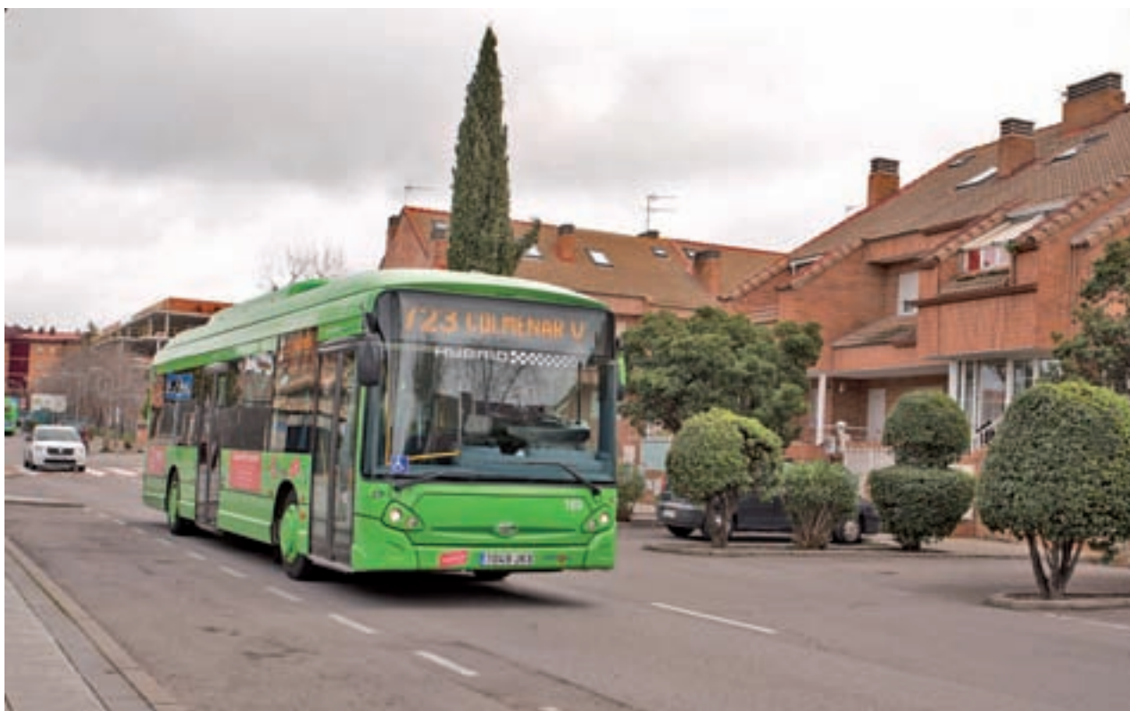
Las líneas interurbanas refuerzan el servicio