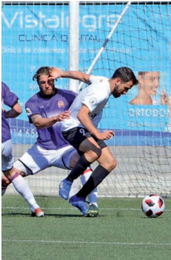
Una jugada del Tres Cantos

Móstoles URJC. En aquella jornada, el marcador fue inaugurado por un temprano gol que llegaba en el primer minuto del encuentro, tras una jugada que culminaba Morato. Apenas catorce minutos después Theo anotaba el segundo tanto del duelo,