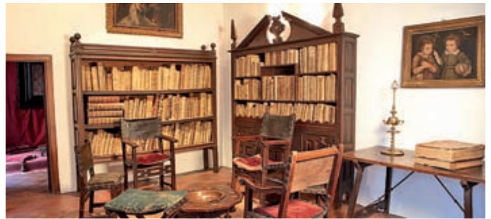
La Casa Lope de Vega será uno de los escenarios

La programación infantil tendrá su epicentro en los centros culturales Pilar Miró y Paco Rabal. Consulta todos los horarios en Madrid.org/Nochedelosteatros