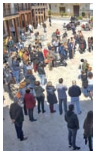
Concentración de protesta

Según la declaración de la víctima, cuatro hombres la atacaron cuando caminaba por la calle, obligándola a ir a un descampado para romperle la ropa, agredirla y robarle el móvil para que no