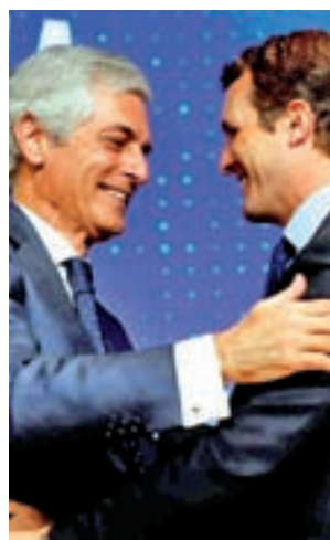
Suárez Illana y Pablo Casado