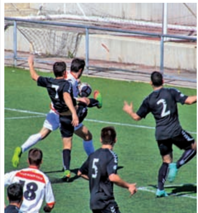
Una jugada del partido del Colmenar y el Torreldones

Por otro lado, el rival al que se enfrentará el Tres Cantos, el Atlético de Pinto, está décimo en la tabla, con 38 puntos, tras perder la pasada jornada 2-3 contra el Vicálvaro. No obstante, no parece un oponente accesible para los del Norte de Madrid, ya que suma 10 victorias esta temporada, frente a las tres logradas por el Tres Cantos.