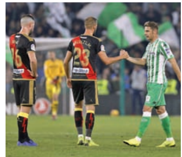
Imagen del Betis-Rayo de la primera vuelta LALIGA.ES

El horario no será la única novedad con la que cuenta este Rayo-Betis, ya que el equipo franjirrojo estrenará nuevo entrenador. Paco Jémez volverá a sentarse en el banquillo de Vallecas, con el objetivo de lograr la permanencia, una meta que actualmente tiene a 6 puntos de distancia tras la derrota en Villarreal.