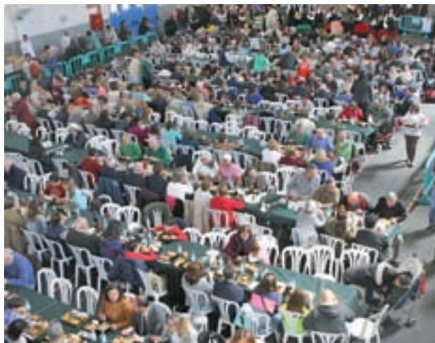
Encuentro en el Espacio Enrique Mas

Asimismo, para que las familias pudieran acudir a este encuentro festivo, se habilitó un espacio donde los niños estuvieron vigilados, con zonas de juego y castillos hinchables en el exterior.