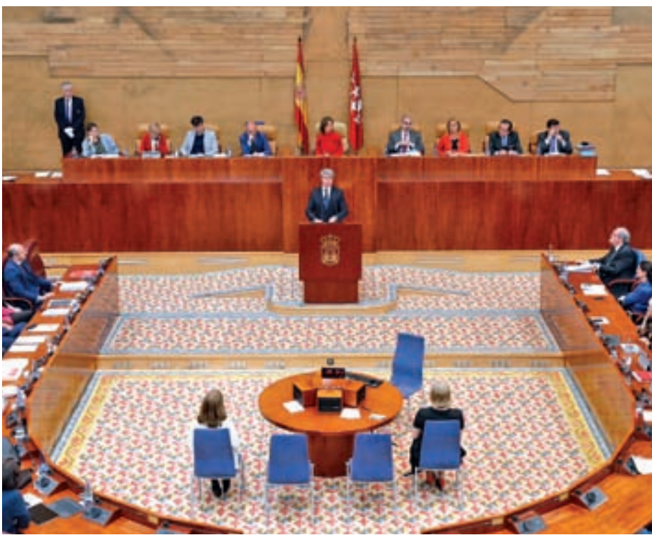
La Asamblea de Madrid celebró el pasado jueves su última sesión