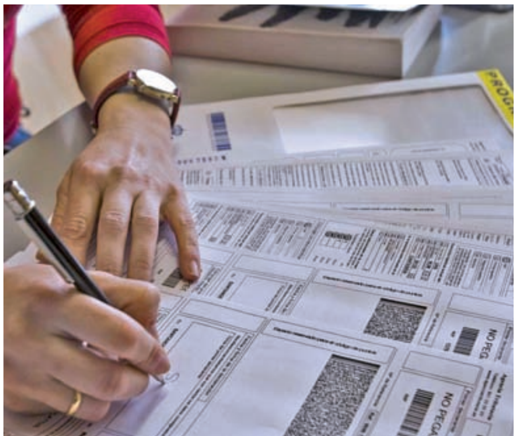
La declaración de la Renta ya no se podrá hacer en papel

Por último, está la opción de hacer la Renta en las oficinas de la Agencia Tributaria. Para ello también es necesario pedir cita en la aplicación, en la página web o en los teléfonos 901 22 33 44 o 91 553 00 71 (de 9 a 19 horas de lunes