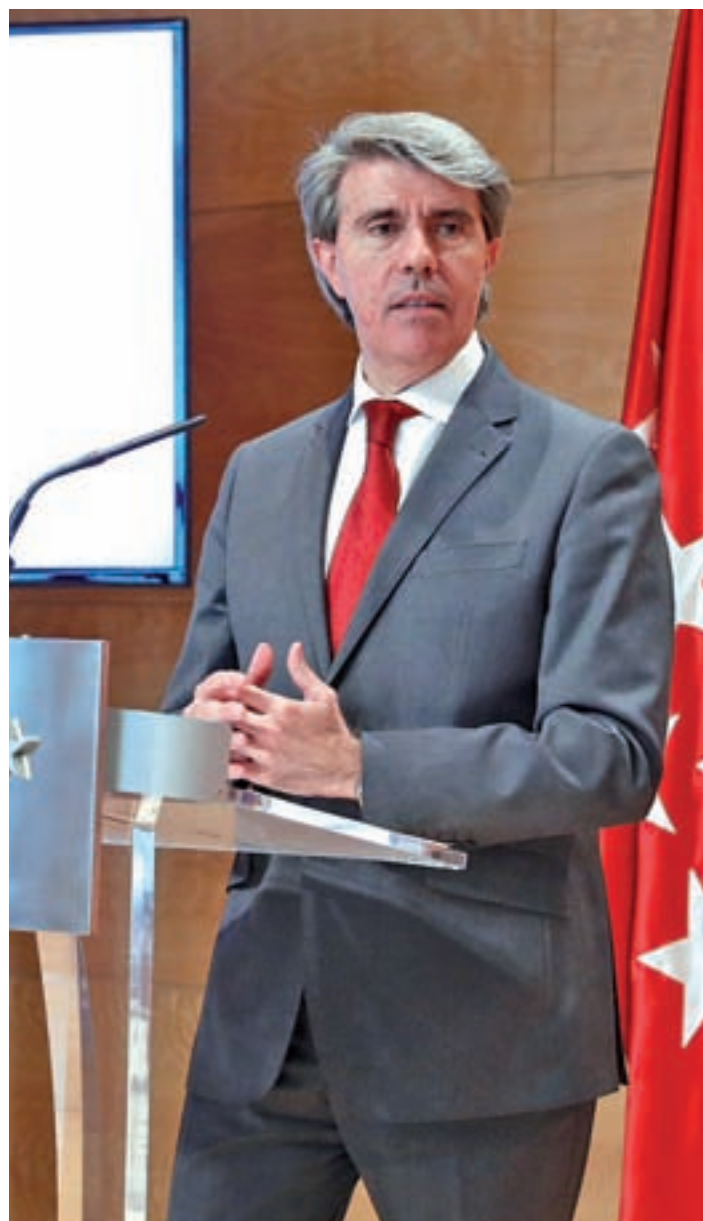
Ángel Garrido en un acto este martes

El presidente de la Comunidad firmó el lunes el decreto de convocatoria de elecciones a la Asamblea de Madrid, que tendrá 132 diputados para los próximos 4 años (dos más que en la presente legislatura), y que se constituirá el 11 de junio. El decreto establece que la campaña comenzará la madrugada del 10 al 11 de abril y que finalizará ese mismo momento del 25 de mayo. El texto se publicó el día 2 en el Boletín Oficial de la Comunidad y en el BOE.