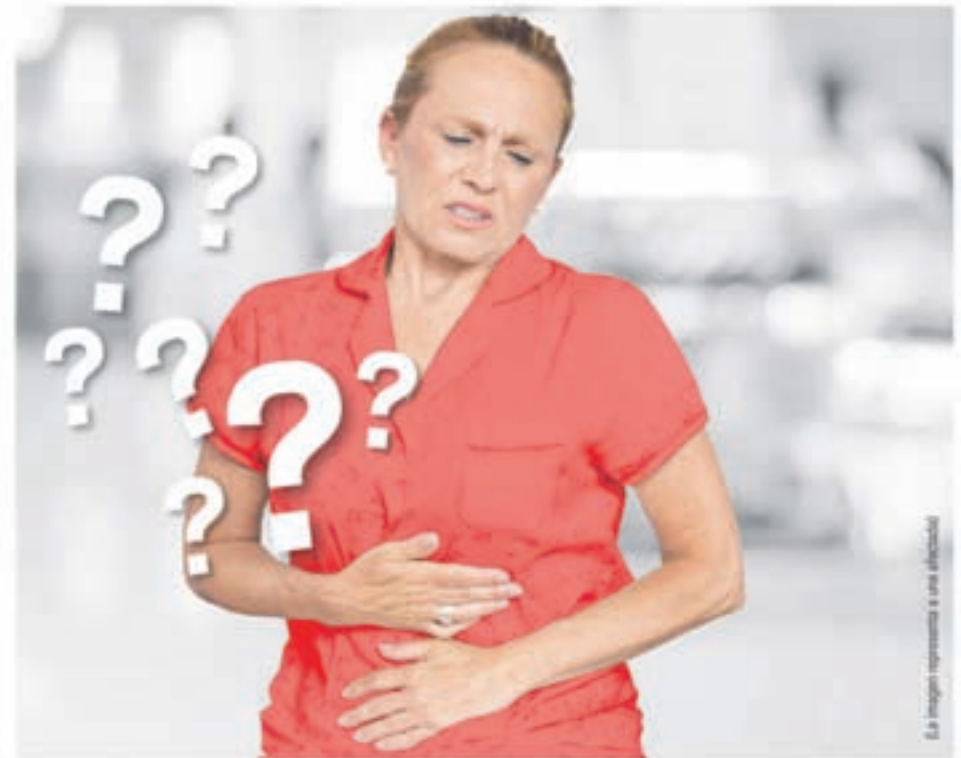
Las imágenes representan a una afectada.

Durante la búsqueda de una terapia eficaz para el síndrome del colon irritable, un equipo de investigadores realizó un gran descubrimiento: la cepa de bifidobacterias presente en Kijimea Colon Irritable (B. bifidum MIMBb75), exclusiva en el mundo, posee la capacidad de acumularse directa-