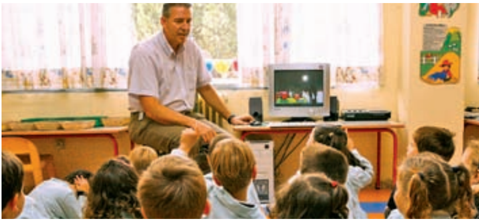
Algunas de las plazas regionales son para docentes