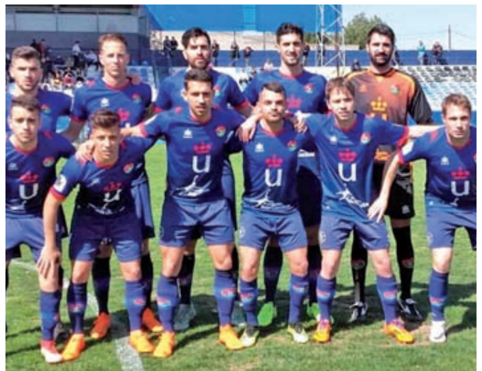
El equipo del Móstoles URJC, antes de uno de sus últimos encuentros MÓSTOLES URJC

Los mostoleños repiten las previsiones de la pasada semana, de modo que empaten, pierdan o ganen el choque, no variarán su posición. A día de hoy, el Móstoles URJC saca ocho puntos al sexto y al quinto clasificado, el CD San Fernando y el Rayo Vallecano B respectivamente, y uno más al Trival Valderas, que esta semana se queda