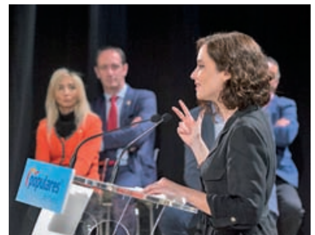
La candidata popular, Isabel Díaz Ayuso, en un acto

En esta línea, Díaz Ayuso propone extender la Red de Hospitales especializados en Cuidados y Rehabilitación y para ello ha prometido ejecutar las obras del antiguo hospital Puerta de Hierro para su conversión en un centro especializado en media y larga estancia. Con este mismo objetivo, propone llevar a cabo la reforma e incorporación del antiguo hospital militar de la zona de Chamberí-Moncloa, dentro del Complejo Clínico San Carlos.