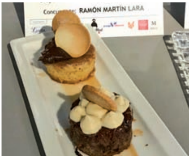
El dulce de Hotel Catalonia Atocha destacó por su innovación

En este sentido, ASEMPAS, junto a la Asociación de Cocineros y Reposteros de Madrid (ACYRE) y la Asociación Empresarial Hotelera de Madrid (AEHM), han elegido, por tercer año consecutivo, 'Las mejores torrijas de la Comunidad de Madrid', elaboradas con productos originarios de la región. El objetivo de este concurso es promover