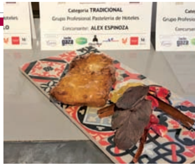
El plato del Hotel Café La Ópera ganó en la versión tradicional

la repostería madrileña y poner en valor la aportación de estos establecimientos a sus tradiciones gastronómicas. De entre los 23 participantes, el jurado destaca las elab-