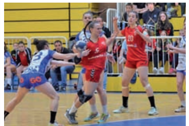
Un jugada del Helvetia