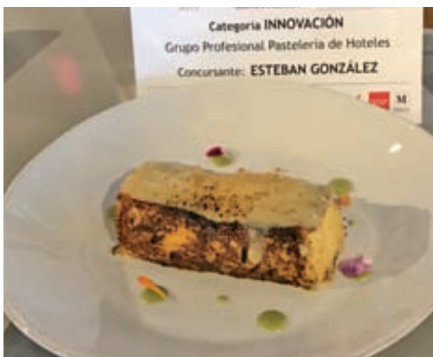
El postre de Hotel Bless Colección Madrid fue muy aplaudido