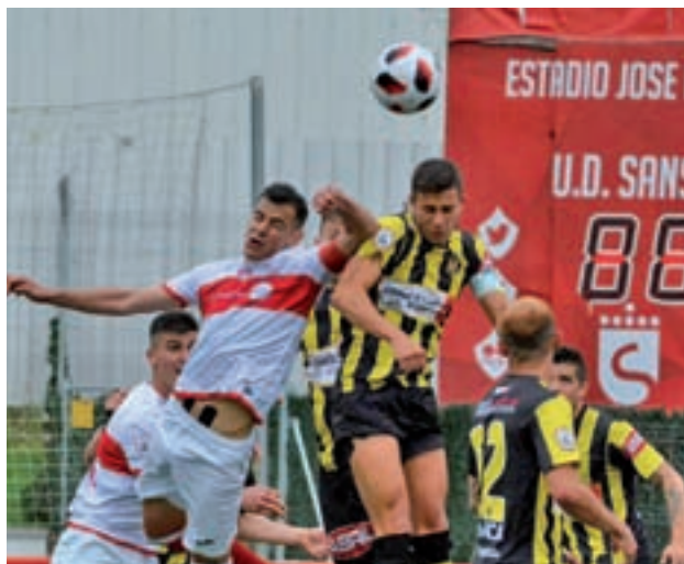
Una jugada del Sanse y el Rápido de Bouzas

La UD Sanse va a jugar este domingo a las 17 horas contra el Pontevedra CF, en un encuentro en el que los sanseros competirán como visitantes después de una inesperada derrotada, 1-0, ante el Club Rápido de Bouzas.