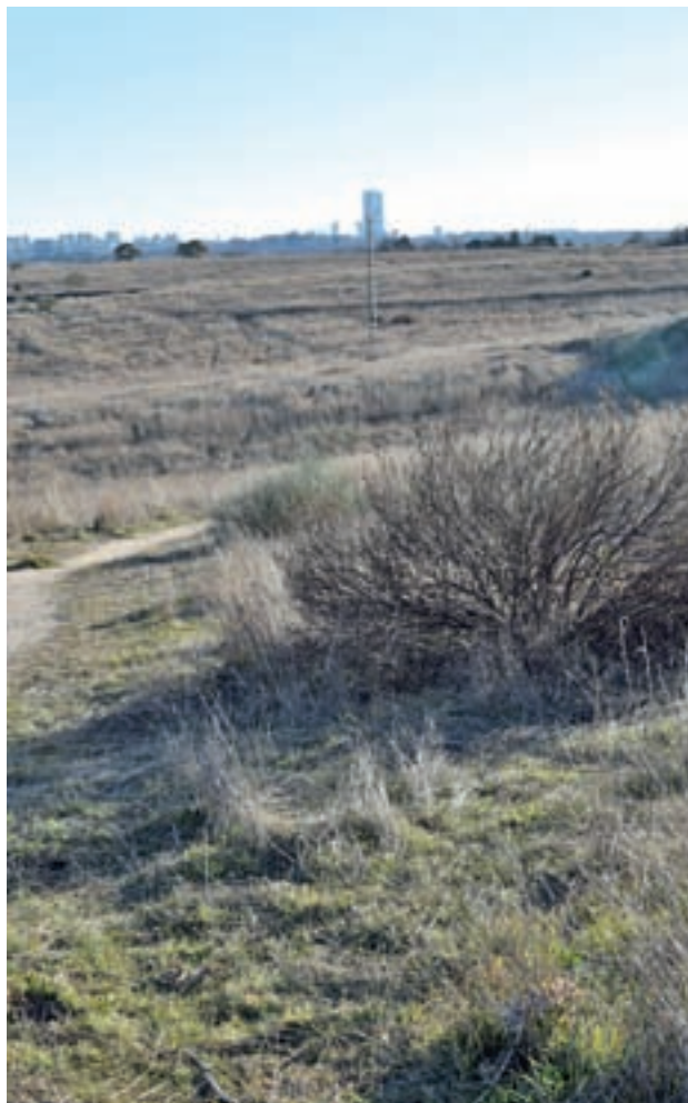
Los Carriles