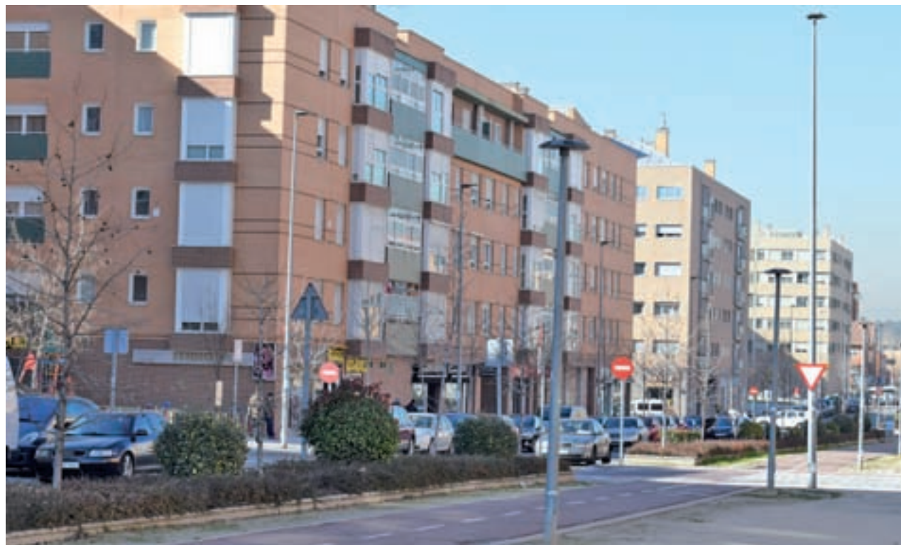
Viviendas en San Sebastián de los Reyes

El precio del metro cuadrado durante el primer trimestre de este año ascendió en la Comunidad de Madrid hasta los 2.500 euros, lo que convierte a la región en una de las más caras para vivir de todo el país. El coste de una casa en esta autonomía se ha incrementado un 20,6% en solo un año, según los datos aportados por Pisos.com