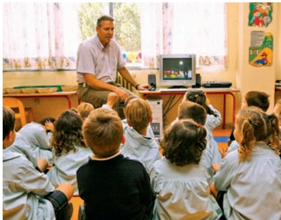
Algunas de las plazas regionales son para docentes

En el ámbito nacional, hay un total de 28.539 plazas públicas, más 5.254 correspon-