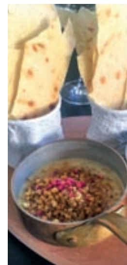
Crême brûlée de foie

rioridad y, por eso, hasta el 21 de abril, todos los domingos ponen a disposición de sus clientes un spanish lunch de primavera para vivir la Pascua en un palacio. El menú está compuesto