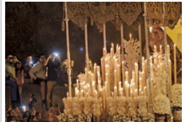
La Madrugá (Sevilla)

Y si hay alguna procesión alabada y reconocida en el resto de España es la de los Legionarios en Málaga. A 180 pisadas por minuto, los militares desembarcan en el puerto de la ciudad para llevar a hombros al Cristo de Mena, mientras miles de personas esperan cerca de la iglesia de Santo Domingo.