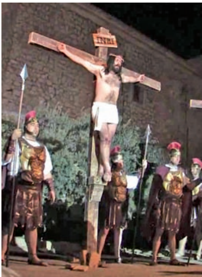
Belmonte de Tajo