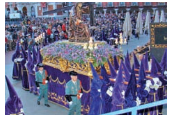
Procesión General (Valladolid)