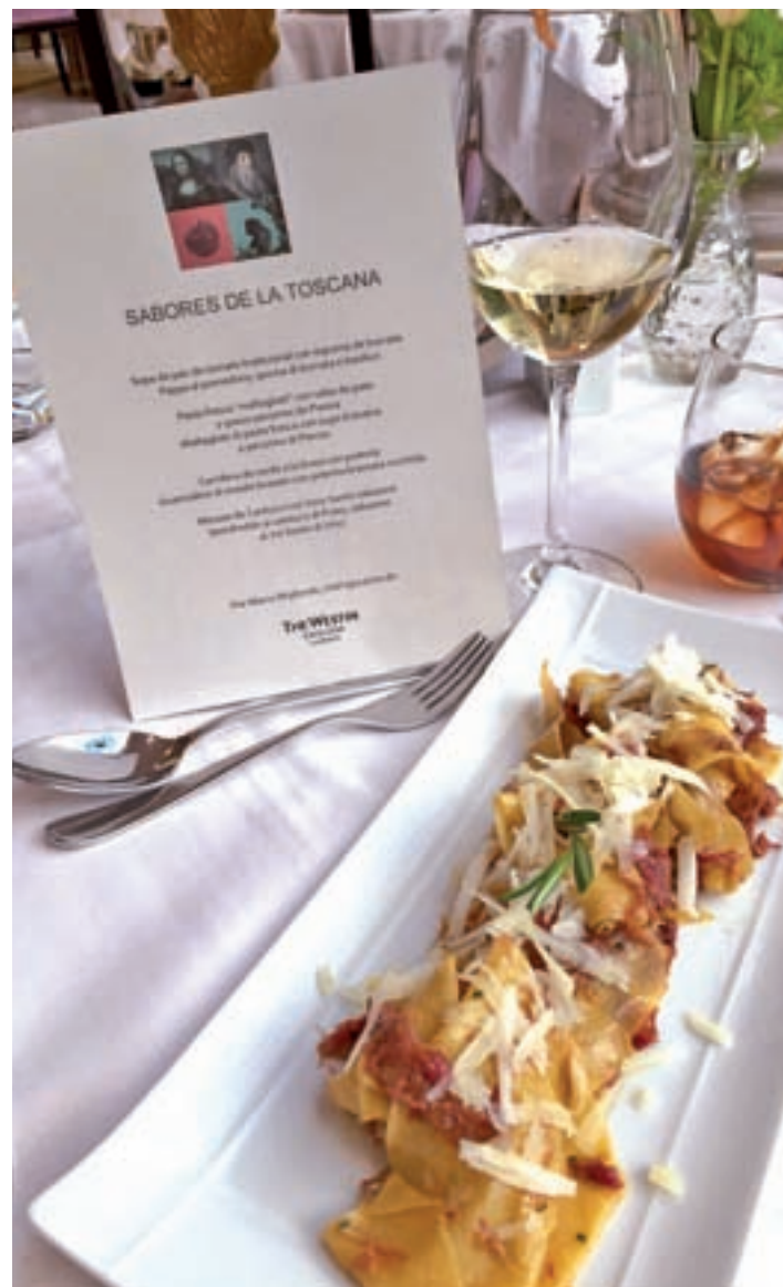
Pasta fresca con salsa de pesto GENTE

Se podrá degustar hasta el 30 de abril en el restaurante La Rotonda del hotel y está compuesto por cuatro platos: