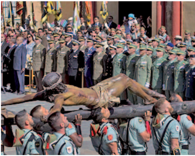
Procesión de los Legionarios (Málaga)