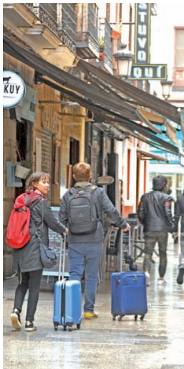
El clima será inestable los primeros días

Otra de las herramientas más populares incluye un aviso sobre los niveles de alerta, muy útil en esta época.