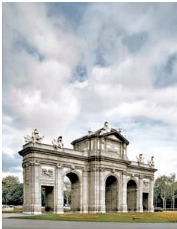
MADRID: La capital sigue siendo el destino favorito de los españoles a la hora de pasar las vacaciones de Semana Santa. Sus museos, monumentos o tiendas son algunos de sus atractivos, que la colocan por encima de Barcelona, Málaga o Sevilla.

En la sexta y en la séptima plaza nos encontramos a dos ciudades andalu-