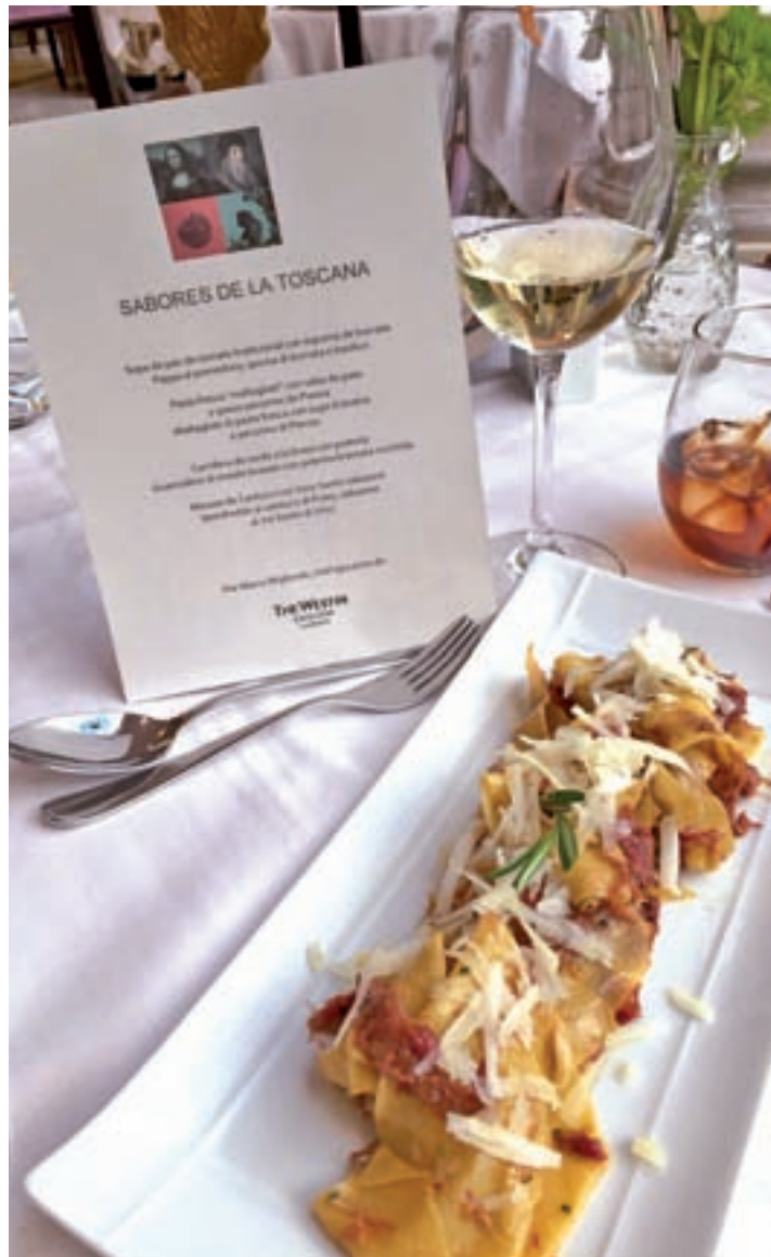
Pasta fresca con salsa de pesto GENTE

Se podrá degustar hasta el 30 de abril en el restaurante La Rotonda del hotel y está compuesto por cuatro platos: