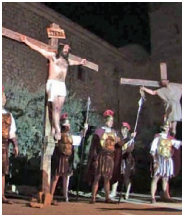
Belmonte de Tajo