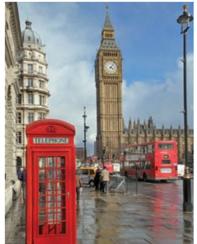
LONDRES: Ni siquiera el Brexit ha desbancado a la capital británica como primera opción a la hora de cruzar nuestras fronteras. París, Roma, Ámsterdam, Bruselas, Berlín y Lisboa confirman la tendencia de los viajeros a optar por grandes urbes europeas.