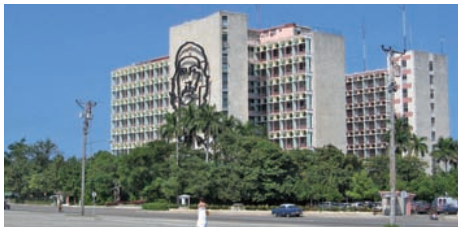
LA HABANA: La Semana Santa no es una época para los grandes trayectos, al menos según revelan los datos de Jetcost.es. El primer destino transoceánico que aparece en la lista es La Habana (12). A la capital de Cuba solo la acompañan en las 30 primeras posiciones dos ciudades norteamericanas. La primera de ellas es Nueva York (16), mientras que la otras es Miami (24).

zas, Málaga y Sevilla, que en esta época unen las tradicionales y multitudinarias procesiones de Semana Santa al resto de atractivos que ya las convierten en un destino apetecible durante el resto del año.