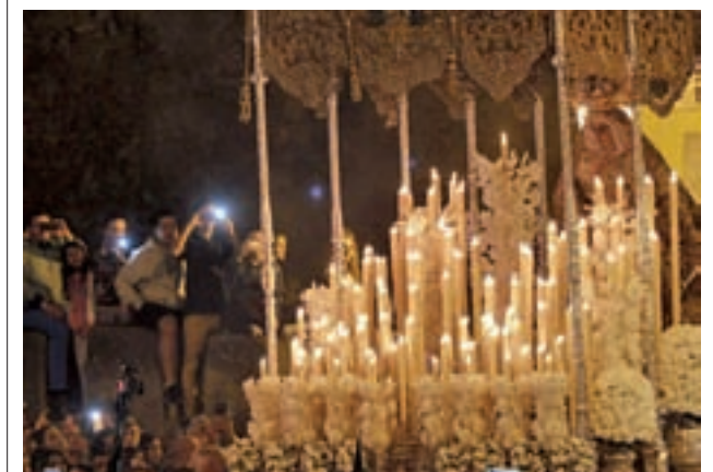
La Madrugá (Sevilla)

Y si hay alguna procesión alabada y reconocida en el resto de España es la de los Legionarios en Málaga. A 180 pisadas por minuto, los militares desembarcan en el puerto de la ciudad para llevar a hombros al Cristo de Mena, mientras miles de personas esperan cerca de la iglesia de Santo Domingo.