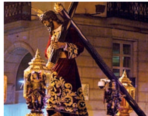
Jesús del Gran Poder

llegará a la Iglesia de Nuestra Señora de las Maravillas. La segunda será la del Cristo de la Fe y del Perdón y María Santísima Inmaculada, Madre de la Iglesia, conocida como la del Cristo de Los Estudiantes. Pero los días más esperados, sin duda alguna, serán el Jueves y Viernes Santo, cuando se concentran las procesiones que congregarán a un mayor número de público. El 18, una de las primeras en salir será la del Divino Cautivo, con inicio y final en el Colegio Calasancio (19 horas). También el jueves será el turno de Jesús 'El Pobre' y de María Santísima del Dulce Nombre, que recorrerán las calles de Madrid saliendo desde la Iglesia de San Pedro 'El Viejo' (19 horas). Una hora más tarde (20 h) saldrá desde la Colegiata de San Isidro