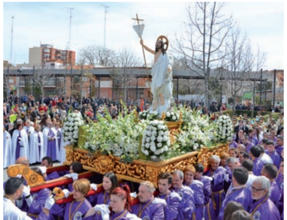
Procesión del Encuentro del Domingo de Resurrección FIESTAS LITÚRGICAS EN MÓSTOLES

las procesiones. Todas estas situaciones vuelven a poner la lupa sobre las habituales barreras físicas con las que se encuentran las personas con discapacidad. Sin embargo, cada vez hay más localidades de la geografía española que toman conciencia sobre este problema e intentan poner soluciones. Un ejemplo de ello es Móstoles, un referente importante en cuanto a las celebraciones propias de estas fechas, que contará con la primera Semana Santa de carácter inclusivo a nivel regional, gracias al trabajo conjunto de las entidades que conforman la Junta de Hermandades.