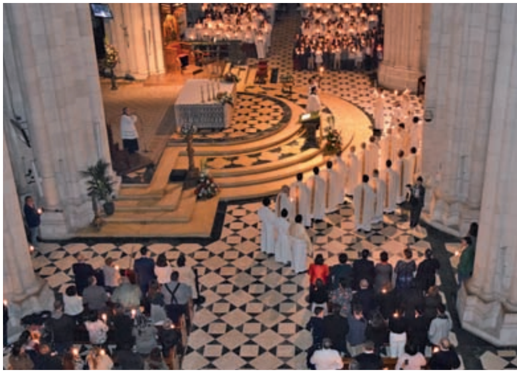
Celebración de la Pascua en La Almudena

Motivo astronómico Y es que la fecha de la Semana Santa depende de las órbitas solares y lunares, ya que el Domingo de Resurrección (o Pascua de Resurrección) se celebra el domingo siguiente a la primera luna llena del equinoccio de primavera, cayendo en un paréntesis de 35 días entre el 22 de marzo y el 25 de abril. Según explica la Archidiócesis de Canarias, las fe-