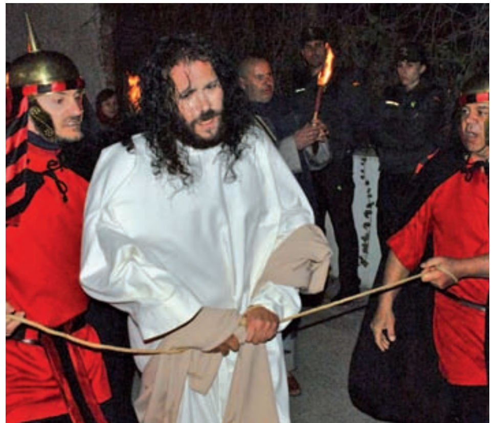
Morata de Tajuña

Más de 400 vecinos la hacen posible cada año en Morata de Tajuña (12 escenarios). Se trata de una cita que cuenta con la Bendición Papal de San Juan Pablo II para actores y asistentes, así como sus dulces propios típicos: los 'pasioncitos'.