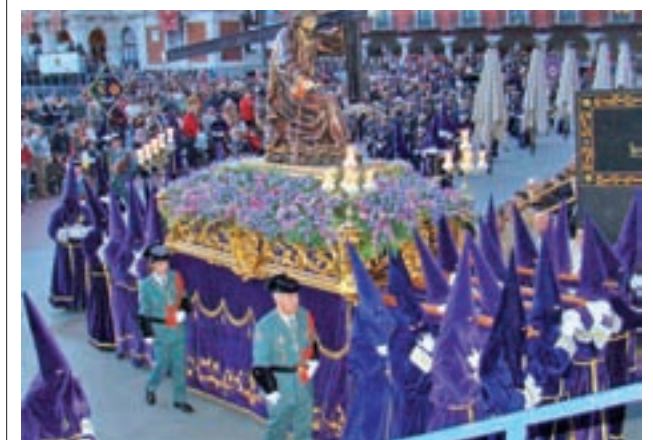
Procesión General (Valladolid)