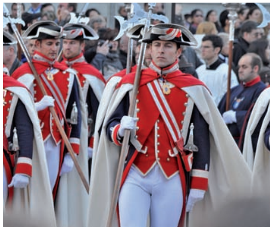
Procesión del Cristo de los Alabarderos

Las primeras en salir a la calle, este domingo 14 de abril, serán las de Nuestro Padre Jesús del Amor, 'La Borriquita', que partirá de la Catedral de Santa María la Real de La Almudena a las 16:30 horas y