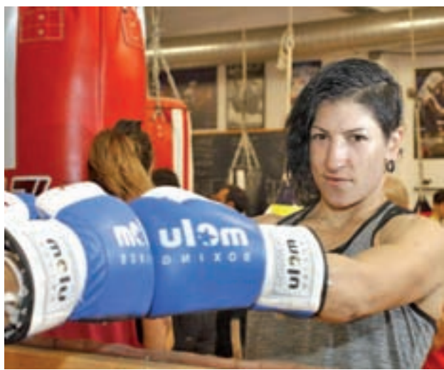
Gutiérrez es campeona de Europa de boxeo

El PSOE local se mostró confiado también de que conseguirán una "España progresista" y animó a los asistentes a "elegir con su voto si quieren "volver al pasado o seguir con un gobierno progresista y social".