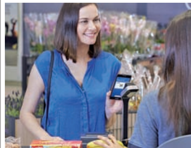
Lidl Plus se utiliza con el móvil

Al terminar la jornada, generalmente por la tarde, regresa a su hogar