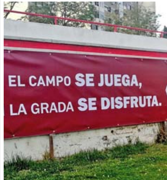
Campaña en el estadio de la RSD Alcalá

En una situación similar, pero en la parte baja de la tabla, se encuentra la RSD Alcalá, que llega a su encuentro de este sábado, frente al Rayo B, después de vencer por la mínima al Atlético de Pinto. Una valiosa victoria que le deja en una posición, aunque no matemática, si de práctica salvación de la categoría. En el puesto undécimo de la clasificación, tiene 8 puntos de ventaja sobre el Vicálvaro, el primero en posiciones de descenso.