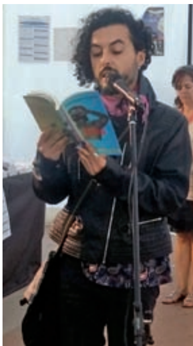
Mayores y niños: Los participantes podrán elegir el libro que desean leer entre los que estén disponibles en la edición de este año.