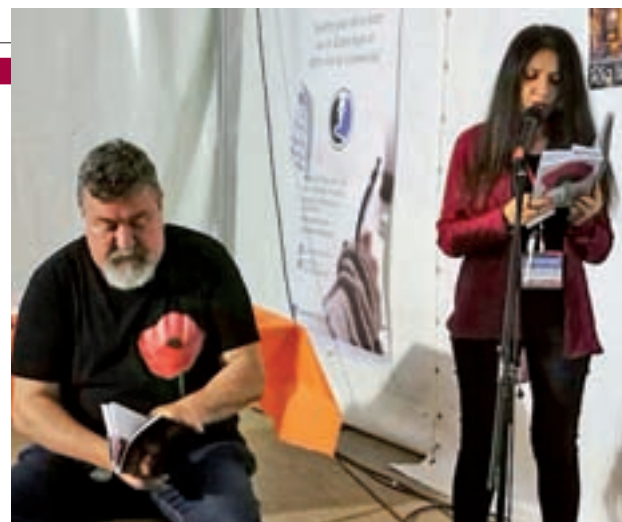
Uno de los momentos de la maratón del año pasado

Todas las actividades culturales serán gratuitas para el público lector. Además, los