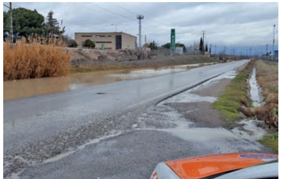
Carretera de Vicálvaro

ADEMÁS UNIRÁ COSLADA CON EL ANILLO VERDE CICLOTURISTA DE LA COMUNIDAD