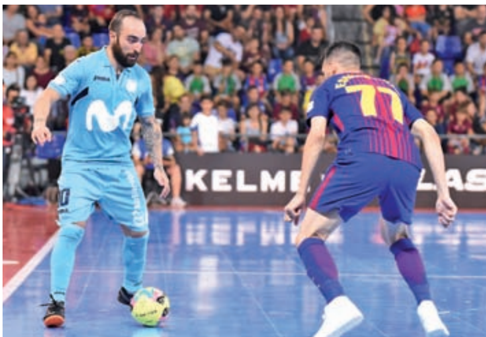
Podría haber final española en la máxima competición europea MOVISTAR INTER