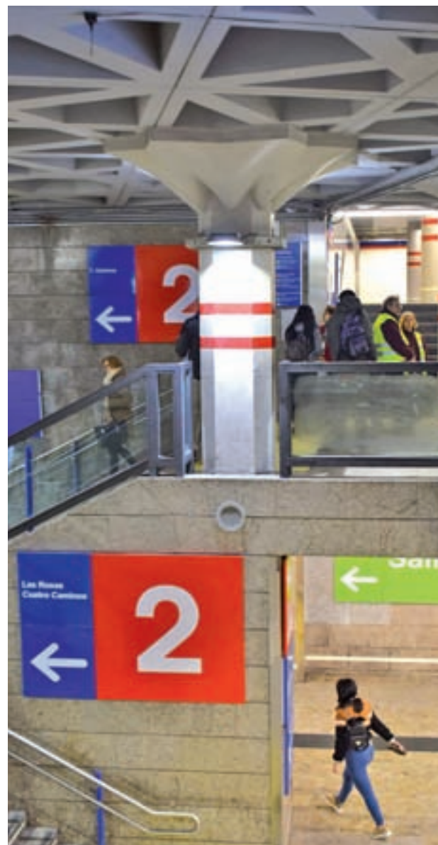
Carteles de las Línea 2 en Sol

El cierre se originó durante el pasado mes de enero, cuando los trabajos que realiza la constructora OHL en el complejo de Canalejas dañaron el túnel que transcurre entre Sol y Sevilla. La consejera de Transportes, Vivienda e Infraestructura de la Comunidad, Rosalía Gonzalo, destacó que Metro de Madrid está coordinándose con la empresa para realizar las obras respetando "las condiciones técnicas imprescindibles". OHL tendrá que abonar los 3,5 millones que costarán, además de enfrentarse a una reclamación por los perjuicios causados. No se trata del único litigio del Gobierno regional con esta compañía, a la que tiene demandada en los tribunales por el abandono de la prolongación