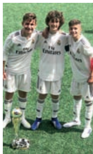
Los campeones, con el trofeo

La última página supuso una victoria del Real Madrid por los goles de diferencia requeridos para ser campeón ante el Valencia (2-0).