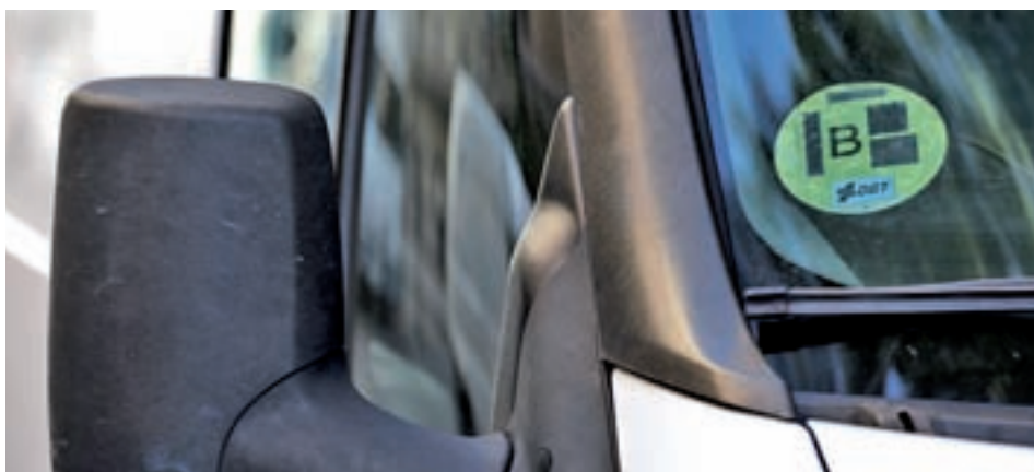
Distintivo ambiental en el parabrisas de un vehículo