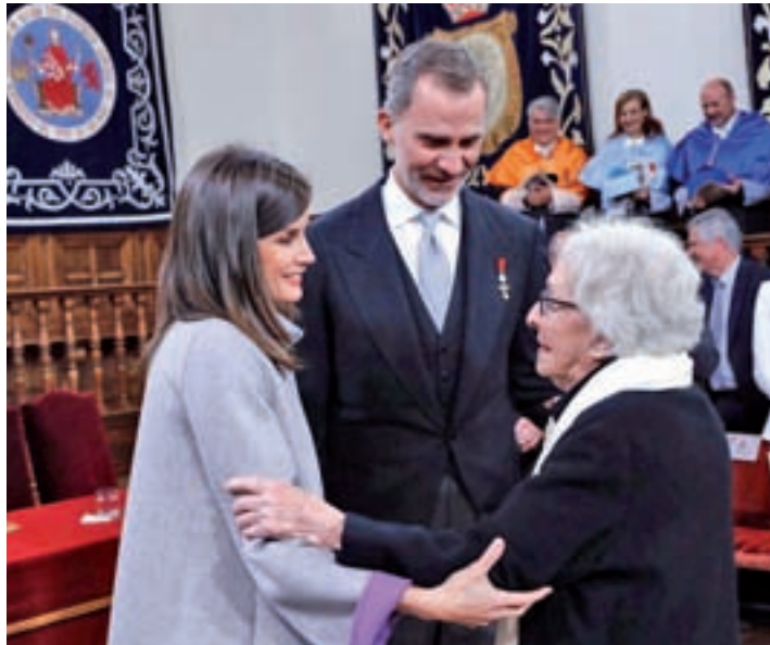
Los Reyes, junto a la galardonada Ida Vitale

La galardonada con el máximo reconocimiento de nuestro país a los creadores españoles e hispanoamericanos ha sido la uruguaya Ida Vitale, nacida en Montevideo en 1923. Su prolífica carrera ha hecho merecedora de galardones como el Premio Octavio Paz (2009), el Premio Reina Sofía de Poesía Iberoamericana (2015), el Premio Internacional de Poesía Federico García Lorca (2016) y el Premio de la Feria Internacional del Libro de Guadalajara (2018). Ha sido discípula de José Bergamín y ha colaborado con Juan Ramón Jiménez y Octavio Paz. Se la considera además integrante de la Generación del 45, a la