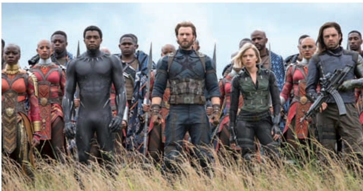
Thanos sigue siendo el enemigo a batir para este grupo de superhéroes

De nuevo los hermanos Russo se ponen al frente de un film cuyo reparto está lleno de estrellas: Robert Downey Jr., Chris Evans, Chris Hemsworth, Scarlett Johansson, Mark Ruffalo... Todos ellos bajo el halo de un grupo de superhéroes que tienen como misión parar los pies al villano por excelencia, Thanos, que amenaza con dominar el universo gracias a las Gemas del Infinito.