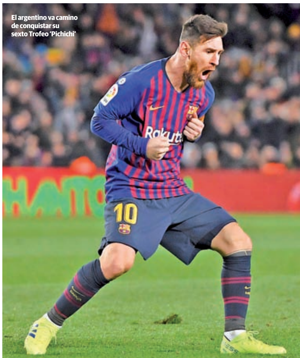
El argentino va camino de conquistar su sexto Trofeo 'Pichichi'

El peso del crack argentino en la última década liguera es patente en varios aspectos del juego. Los dos campeonatos logrados por el Ma-