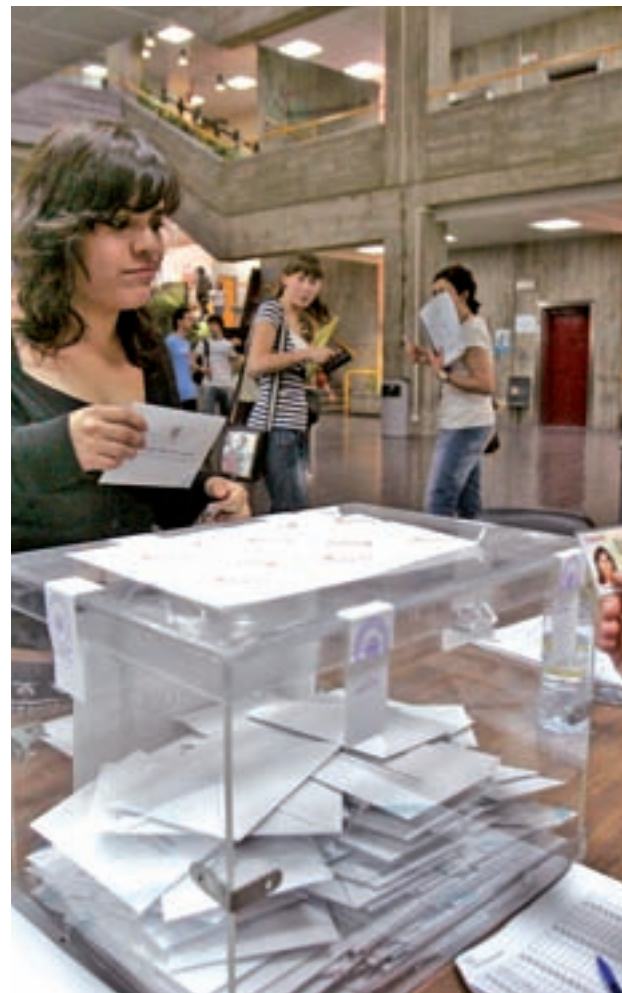
Los comicios serán este domingo 28 de abril

Lo único que parece seguro es que se acentuará la fragmentación parlamentaria que comenzó en 2015 con la irrupción de Ciudadanos y Podemos y que ahora se amplía hacia el lado derecho del arco con Vox. Esta situación provoca que no sea tan importante ganar los comicios como lograr aglutinar una