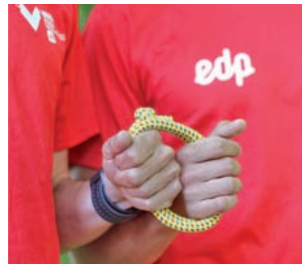
Esta cuerda une a los corredores con sus guías

Estos corredores son un ejemplo de las más de 2.800 personas inscritas en Comparte tu Energía en todo el mundo desde que la energética EDP, en colaboración con la ONCE y la Federación Española de Deportes para Ciegos (FEDC), lanzara esta iniciativa solidaria.