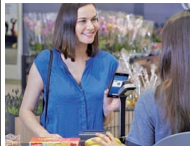
Lidl Plus se utiliza con el móvil

Al terminar la jornada, generalmente por la tarde, regresa a su hogar