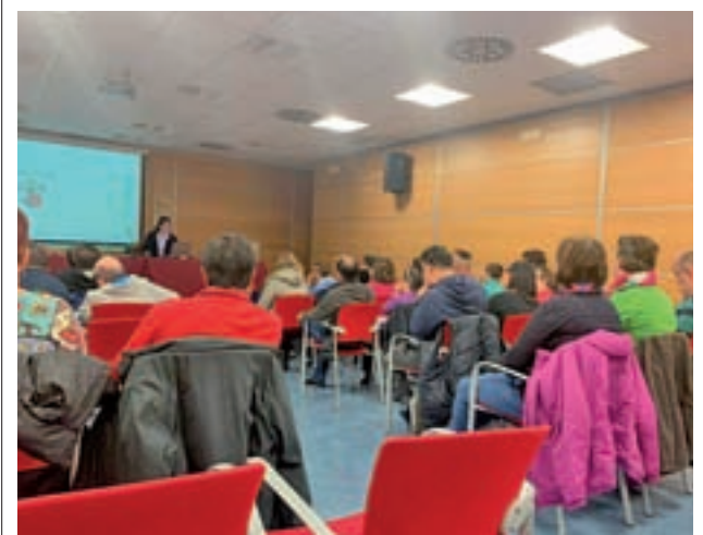
Un momento de la sesión informativa