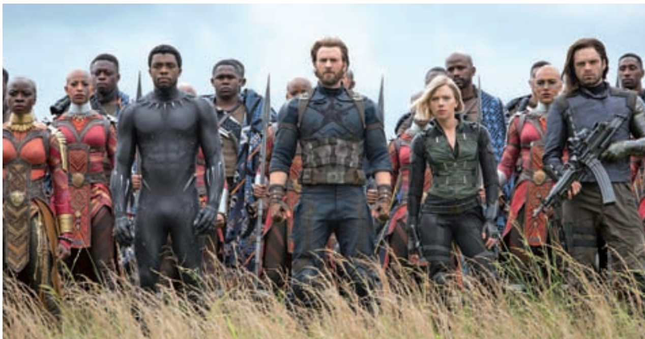
Thanos sigue siendo el enemigo a batir para este grupo de superhéroes

De nuevo los hermanos Russo se ponen al frente de un film cuyo reparto está lleno de estrellas: Robert Downey Jr., Chris Evans, Chris Hemsworth, Scarlett Johansson, Mark Ruffalo... Todos ellos bajo el halo de un grupo de superhéroes que tienen como misión parar los pies al villano por excelencia, Thanos, que amenaza con dominar el universo gracias a las Gemas del Infinito.