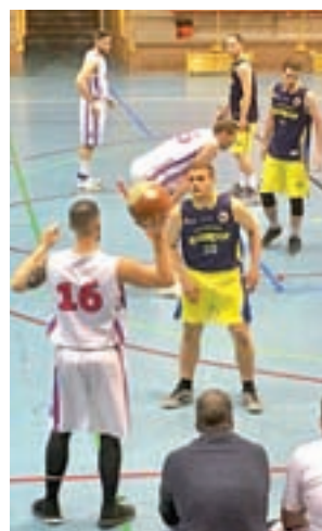
Partido del Villa

Sea cual sea el resultado de este fin de semana, el segundo asalto se disputará el próximo sábado 12 de mayo en el Jesús España en un horario aún por confirmar. En caso de que sea necesario, el tercer y definitivo encuentro se jugaría de nuevo en Paracuellos del Jarama el sábado 19 de mayo.