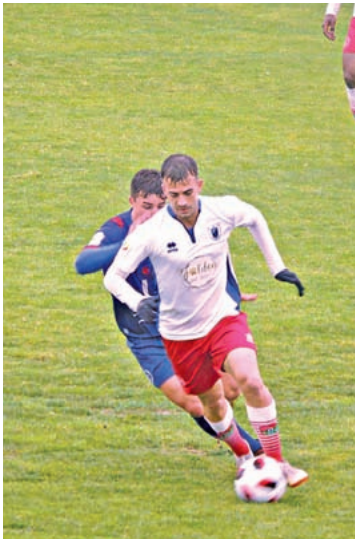
La AD Parla perdió en Móstoles AD PARLA

juegan prácticamente nada. Con los pinteños salvados y sin opciones de 'play-off' de ascenso y con los parleños con un colchón de 7 puntos respecto a los puestos de descenso a Preferente, el honor es casi lo único en juego en este enfrentamiento.