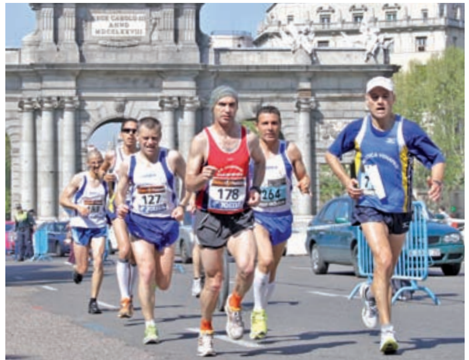
Imagen de una edición anterior

El pistoletazo de salida se dará a las 8 de la mañana para