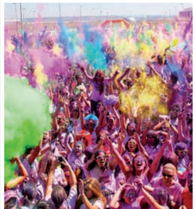
El colorido llenará las calles de Parla