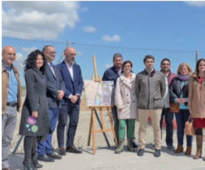
Goyache y los miembros de la Corporación, en los terrenos

El nuevo campus tendrá las instalaciones necesarias para la formación de graduados en estas especialidades y dará cobertura a estudiantes de la zona Sur de Madrid y a muni-