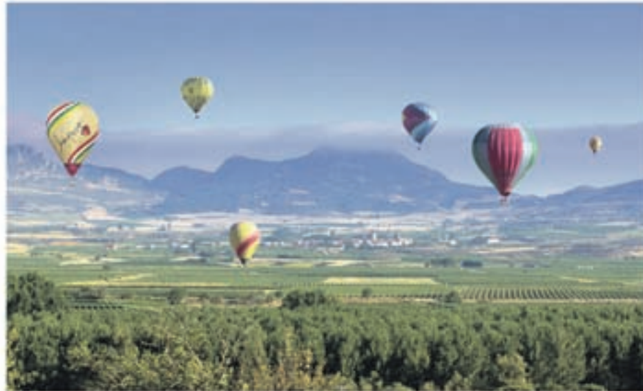
Paseos en globo sobrevolando el mar de viñedos riojanos.