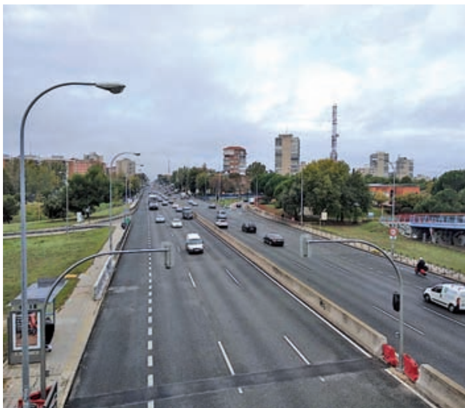
Los semáforos están en funcionamiento en la A-5 desde febrero

Carmena agradeció a todos los grupos las buenas ideas aportadas, especialmente a los socialistas, a quienes dio un consejo de cara a la posibilidad de "volver a gobernar juntos", que sean "prudentes". Además, invitó a café con dinero de su bolsillo a los partidos de la oposición madrileña para limar las asperezas y alertó del "cainismo político" que pone en peligro las instituciones.