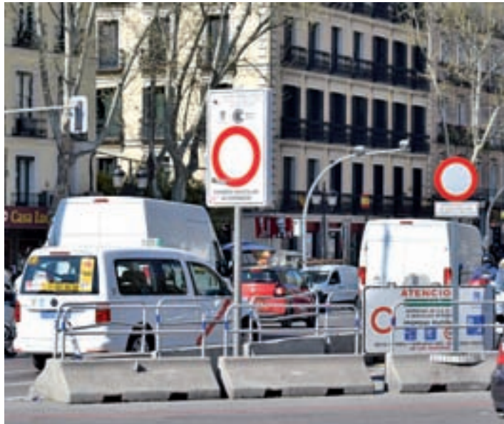
El Ayuntamiento permite la distribución nocturna de mercancía

“Después de años marcados por el buen funcionamiento de la Semana Santa en Madrid como consecuencia del incremento de las procesiones y de la actividad turística, la de 2019 ha sido la peor desde los difíciles años de la crisis”, apuntó la Plataforma en un comunicado. Los afectados creen que “toda la información que durante los últimos 6 meses ha rodeado la polémica de Madrid Central ha terminado por proyectar una imagen antipática y hos-