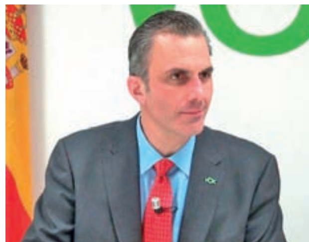
Javier Ortega Smith es el candidato a la Alcaldía por Vox