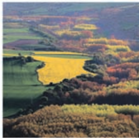
A cada paso, un paisaje mágico.

Y aquellos que se acerquen a La Rioja en busca de cultura y tradiciones se sorprenderán con citas musicales de todos los estilos a lo largo y ancho de su geografía y con la historia, cuevas, castillos, iglesias, restos arqueológicos, murallas, fiestas, museos y folclore que hacen de ella un destino auténtico y singular.