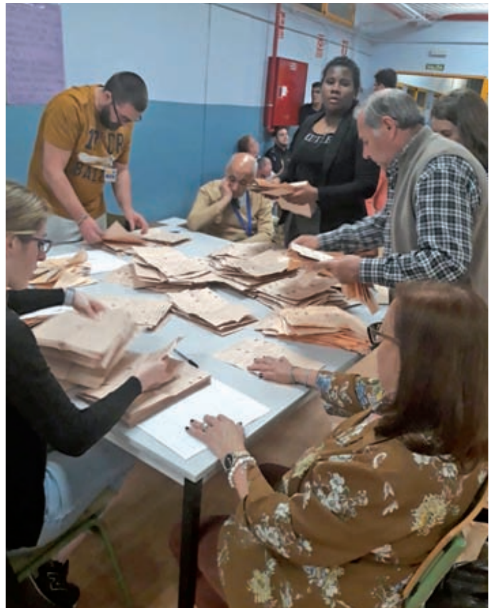
Un momento del recuento de papeletas en el colegio Honduras de Villa de Vallecas

Por primera vez irrumpió Ciudadanos como el partido más votado a nivel distrital, en este caso en Hortaleza y Barajas. Por último, Unidas Pode-