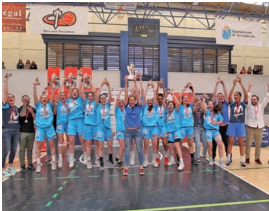
Las jugadoras colegiales, en el momento de recibir el trofeo de campeón FBM

En la gran final del sábado 4, el Movistar Estudiantes quiso dejar claro desde el principio que no estaba dispuesto a sufrir sorpresas y al final del