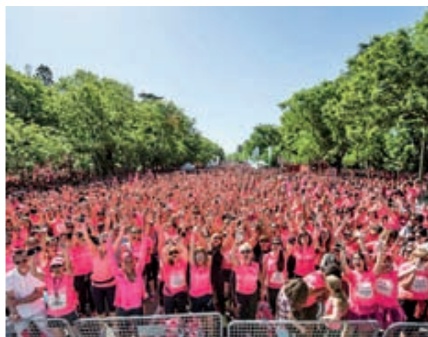
Imagen de una edición anterior

La salida estará ubicada en la calle Princesa, y la meta en Paseo de Camoens.