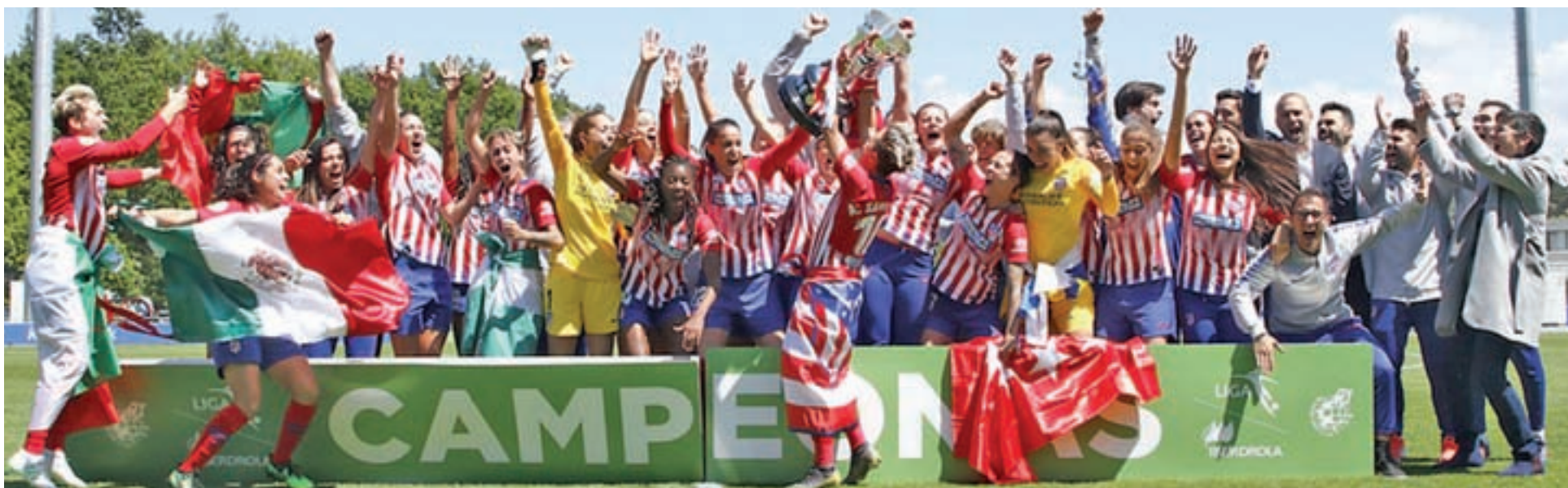
Zubieta fue testigo de la consecución de un nuevo título por parte de las jugadoras rojiblancas