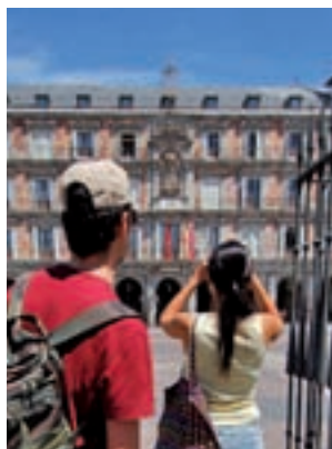
Turistas en la Plaza Mayor

Con estas cifras, el número de turistas llegados desde fuera de nuestras fronteras en los primeros tres meses del año se eleva hasta los 1.766.538, lo que supone un