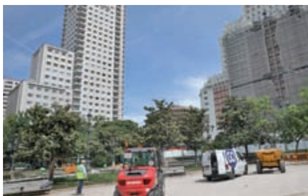
Estado actual de los trabajos

mayo, a tres semanas vista de las elecciones municipales. Otros de los trabajos que se llevarán a cabo en los próximos días será la protección de la vegetación, tanto la que va a seguir en su emplazamiento actual como la que será trasplantada a otros lugares dentro de la plaza.