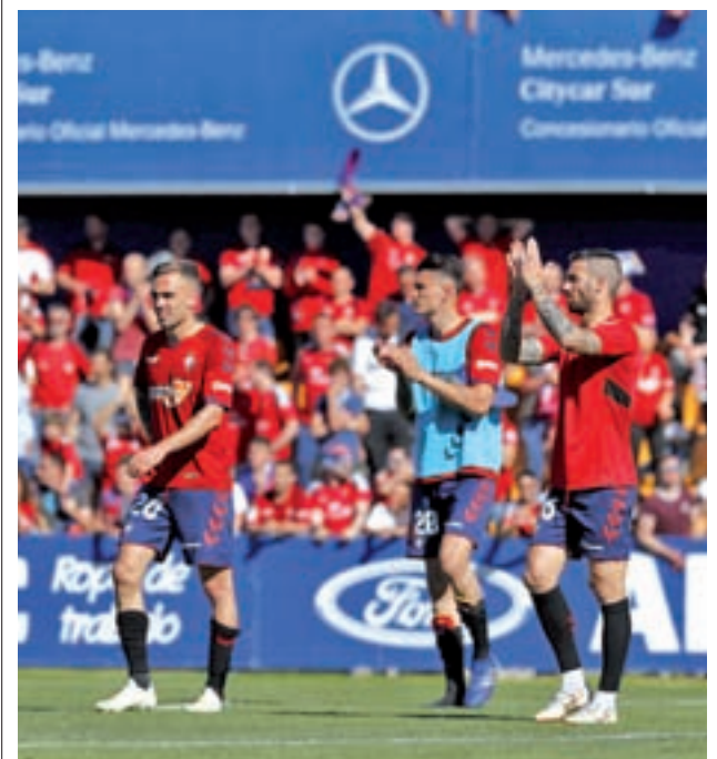
El equipo navarro empató a cero en Alcorcón LALIGA.ES

Tanto Landa como el resto de sus compañeros no deberán perder de vista a rivales como Vincenzo Nibali, ganador en las ediciones de 2013 y 2016, o el colombiano Miguel Ángel 'Superman' López, que el año pasado fue tercero en la clasificación general, además de portar el maillot blanco que le acreditaba como el mejor ciclista joven. Un compatriota suyo, Egan Bernal, también se perderá la cita italiana por una lesión en la clavícula, dejando aún más huérfano al nuevo Ineos, el equipo que toma el testigo de Sky.