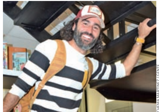
CHEMA MARTINEZ / GENTE

El presentador de 'Maraton Man' (Movistar+) triunfa con su primer libro, 'La vida mola' • En él se cuentan algunas de las historias que han marcado su trayectoria personal y profesional y en las que el 'running' juega un papel central