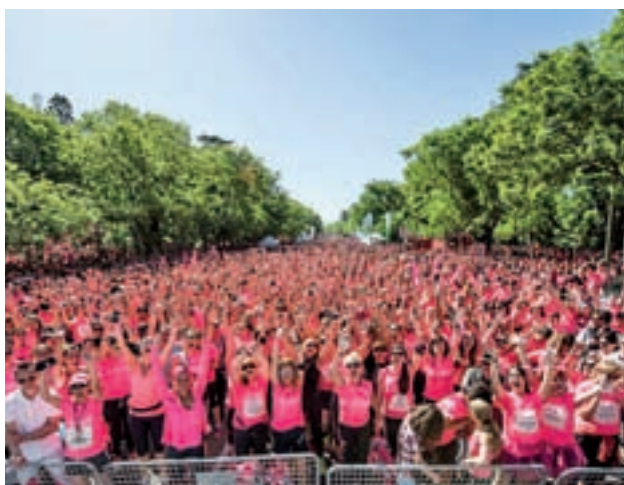
Imagen de una edición anterior