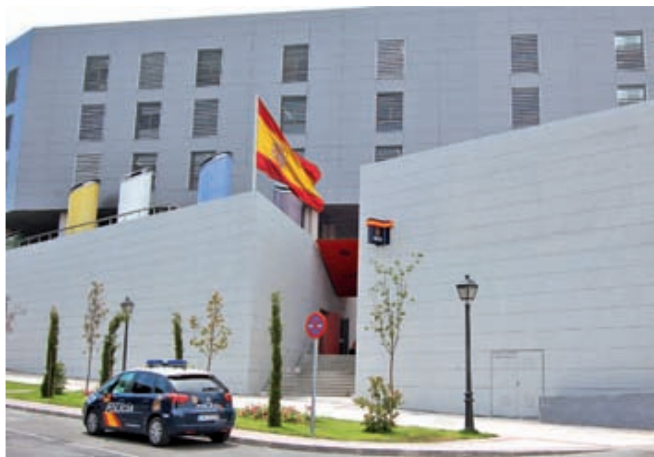
Comisaría de Móstoles

El herido recibió varias puñaladas por la espalda, a la altura de la escápula. Fue atendido por voluntarios de Protección Civil y luego estabilizado y trasladado por el Summa al Hospital 12 de Octubre, donde ingresó con pronóstico grave. Tan solo un día