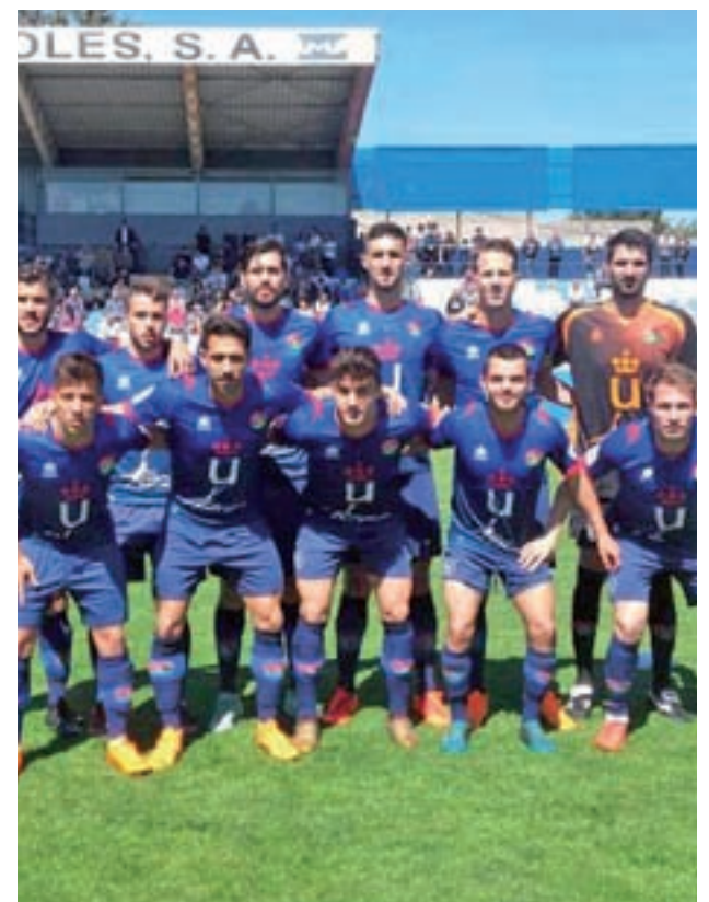
El Móstoles en su último encuentro

Los azulones se desplazarán este domingo 12 de mayo a las 11:30 horas hasta el campo de Santiago del Pino donde tendrá lugar la trigésimo-séptima jornada del Grupo VII de Tercera División, siendo este el último partido del campeonato que harán como visitantes. Cabe recordar que el choque de ida se saldó con