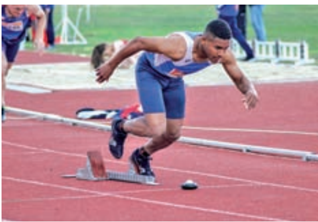
Un deportista en plena carrera