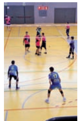
Un partido del Móstoles

rá el 11 de mayo en las instalaciones del Pabellón Municipal Móstoles Sur, hasta un total de doce equipos se disputarán las plazas que les permitirán subir. Los mostoleños se enfrentarán al Newman Blanco a las 13:30 horas, mientras que a las 17:30 lo harán ante el Torreledones.