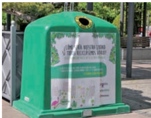
Uno de los veinte iglúes

Todo forma parte de la campaña "¿Cómo sería nuestra ciudad si todos reciclásemos envases de vidrio?" para concienciar a los ciudadanos