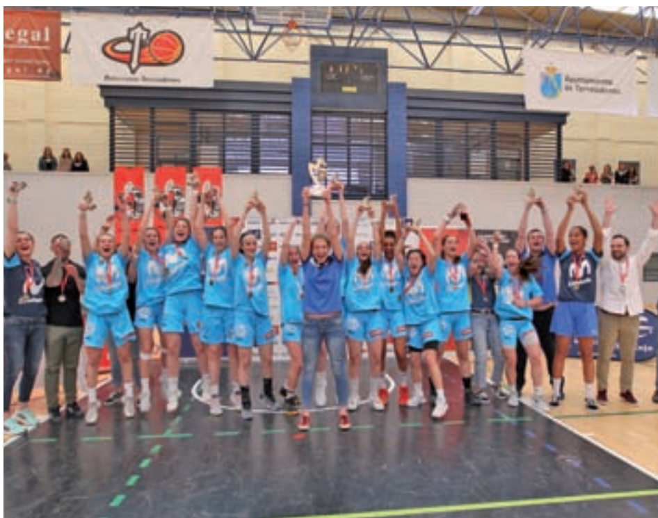
Las jugadoras colegiales, en el momento de recibir el trofeo de campeón FBM