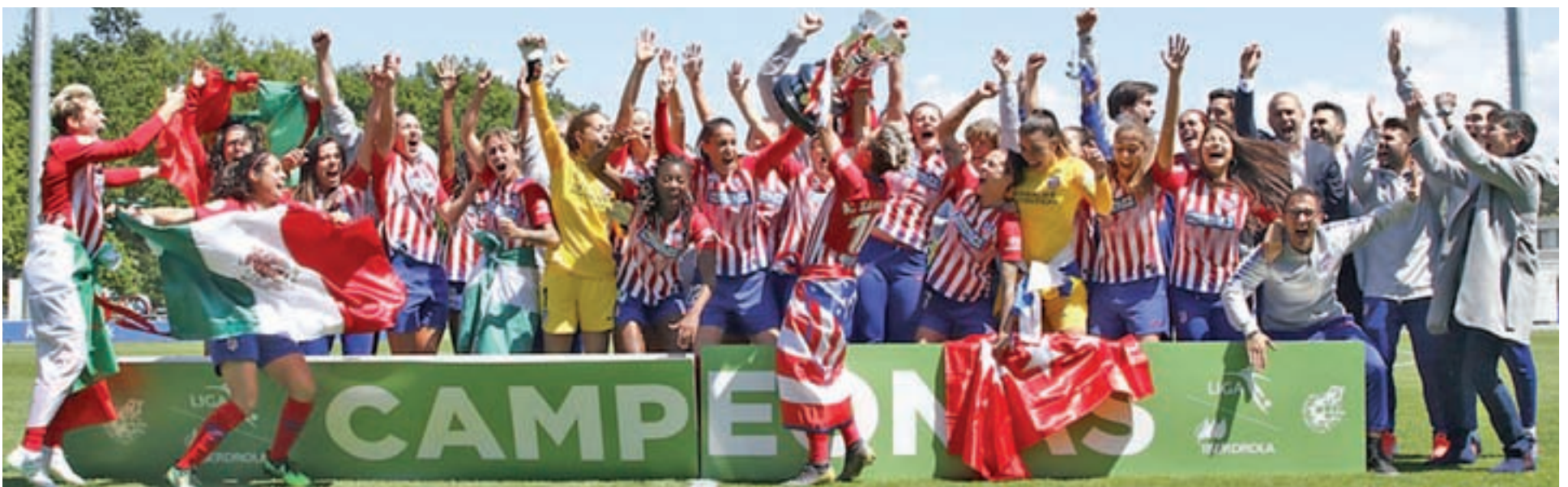
Zubieta fue testigo de la consecución de un nuevo título por parte de las jugadoras rojiblancas