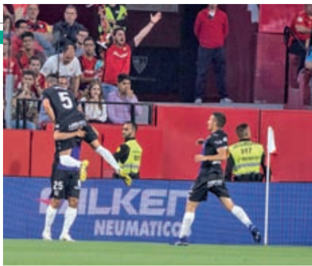
El Leganés goleó al Sevilla por 0-3

Para empezar, este domingo 12 (18:30 horas) los blanquiazules disputarán su último partido de la temporada como locales, una buena ocasión para que la parroquia pepinera rinda el homenaje merecido a la plantilla. En-