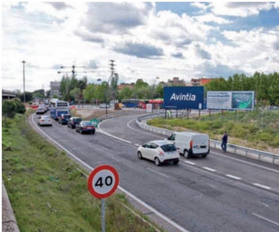
Imagen del nuevo carril

De esta manera, “los vehículos que se desplacen hacia el Centro de Leganés ya no necesitarán hacer la rotonda de acceso (que tiene semáforos) sino que se van a incorporar directamente”, han precisado fuentes municipales. Han indicado, además, que este nuevo carril, que se une a los ya existentes, “agilizará el denso tráfico que se produce en la zona y mejorará la movilidad”. Según datos de la Policía Local, más de 8.000 vehículos acceden a la ciu-