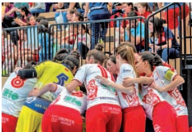
Las pepineras se conjuran para lograr la permanencia