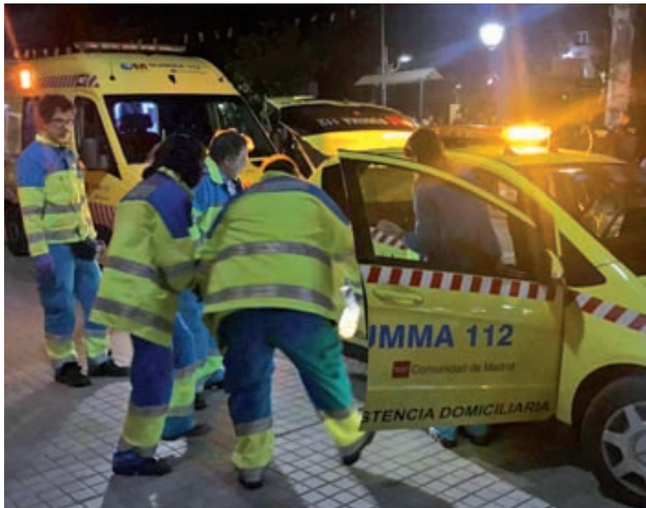
Sanitarios del 112 atienden a los heridos

Tras estos episodios de apuñalamientos en la región, y acerca de estos hechos, el presidente en funciones de la Comunidad de Madrid, Pe-