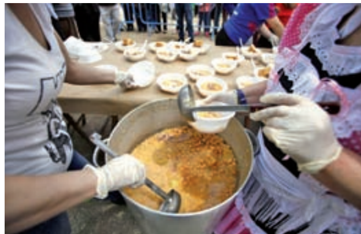
El San Isidro más tradicional estará presente en las calles de Madrid

nas con discapacidad, interpretación en lengua española y mochilas vibratorias para ciudadanos con discapacidad auditiva.