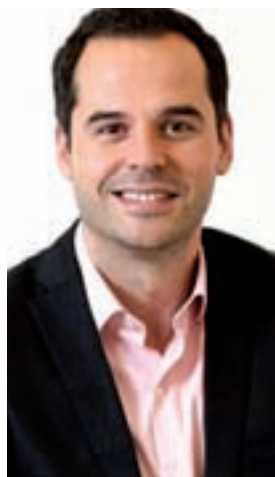
Ignacio Aguado CIUDADANOS