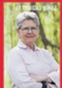
#7 TRINIDAD BUZÓN