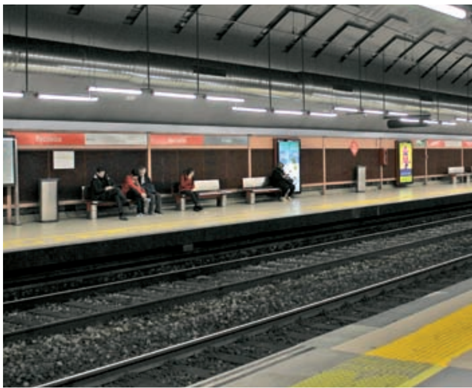
La estación de Recoletos es una de las que se cerrará al público

Las obras afectarán a las líneas C1, C2, C7, C8 y C10, razón por la que se pondrá en marcha un plan alternativo de movilidad que detalló el director de Cercanías de Madrid, Manuel Pedrosa. Entre otras medidas, al interrumpirse el servicio de trenes entre Atocha y Chamartín, se establecerá un servicio especial de la EMT con autobuses que realizarán el recorrido entre Atocha y Nuevos Mi-