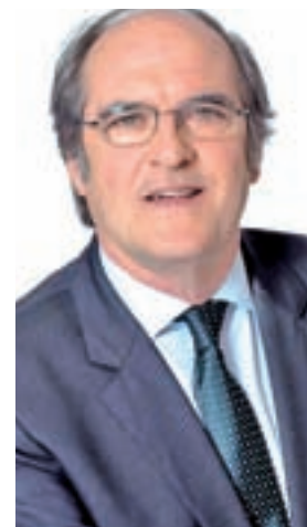
Ángel Gabilondo PSOE