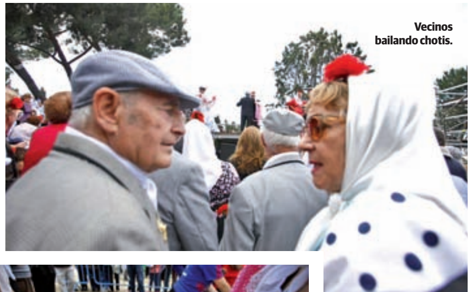
Vecinos bailando chotis.

Es necesario destacar que el Consistorio madrileño, firme en su apuesta por garantizar la igualdad en el acceso a la cultura, ha ideado diferentes medidas para asegurar el disfrute de todos los vecinos. De este modo dispondrá de 200.000 pulseras para perso-