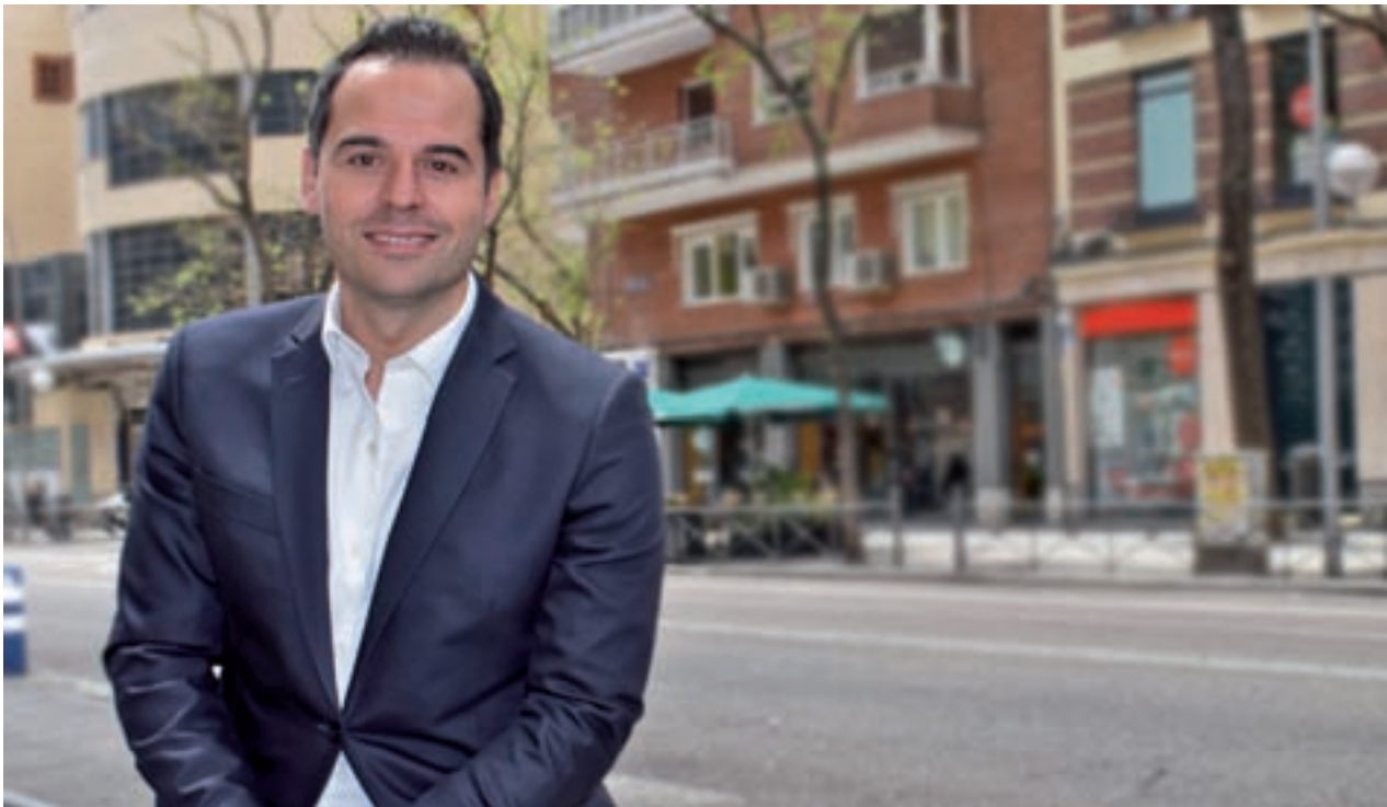
CHEMA MARTÍNEZ / GENTE