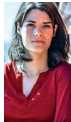
Isabel Serra UNIDAS PODEMOS