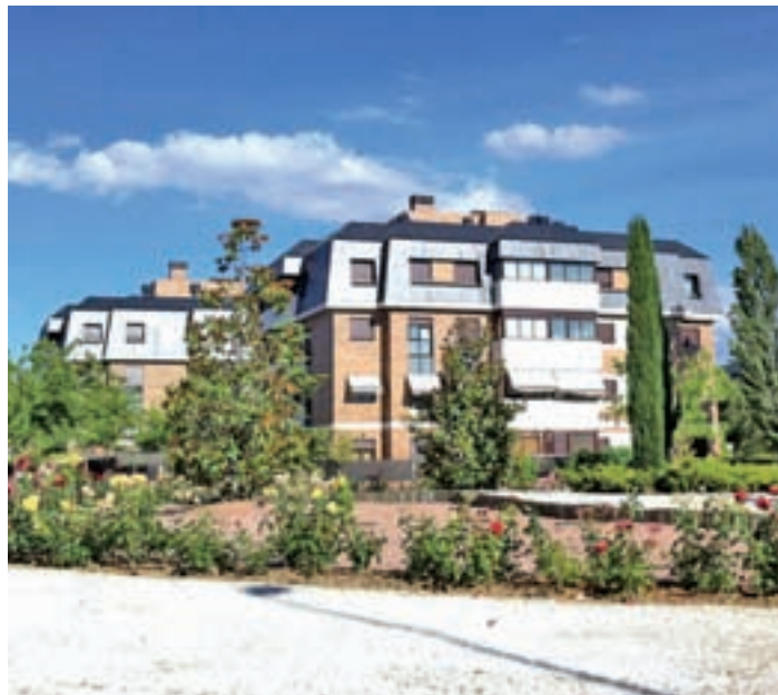
El Valle de la Oliva

El Pleno del Ayuntamiento de Majadahonda aprueba ceder suelo para un nuevo inmueble de la Benemérita • El acuerdo contempla que la construcción debe hacerse en un lustro