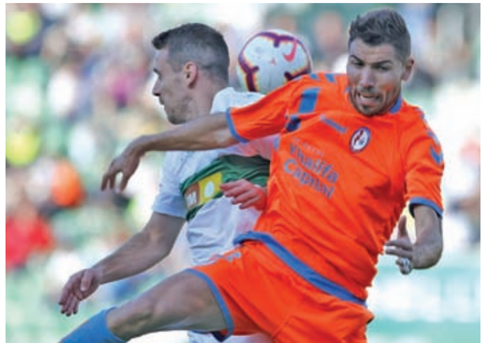
Derrota ante el Elche RAYO MAJADAHONDA

A pesar de ello, el conjunto comandado por Luis Miguel Ramis viene de empatar a cero ante el Numancia y de perder por dos goles a cero ante el Osasuna en Pamplona. Sin embargo, estos resultados negativos no han desechado las probabilidades del ascenso a la categoría reina del fútbol español, ya que los albaceteños están terceros en la clasificación a tres puntos del Granada, aunque se encuentran lejos del Osasuna, que está a nueve puntos. Salvo catástrofe jugarán las eliminatorias por el ascenso ya