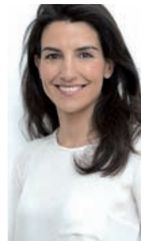
Rocío Monasterio VOX

drid. El partido liderado por Pablo Iglesias ha elegido a Isabel Serra para encabezar una candidatura que tendría que haber liderado Íñigo Errejón, número uno de Más Madrid. La decisión de este último de unirse a Manuela Car-