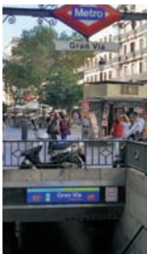
Metro de Gran Vía GENTE