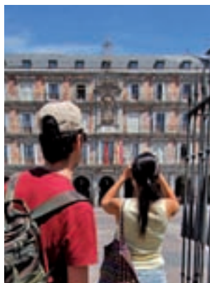
Turistas en la Plaza Mayor

Con estas cifras, el número de turistas llegados desde fuera de nuestras fronteras en los primeros tres meses del año se eleva hasta los 1.766.538, lo que supone un