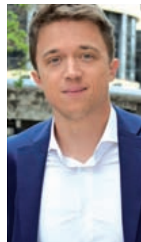
Íñigo Errejón MÁS MADRID