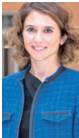
Isabel Díaz Ayuso PARTIDO POPULAR