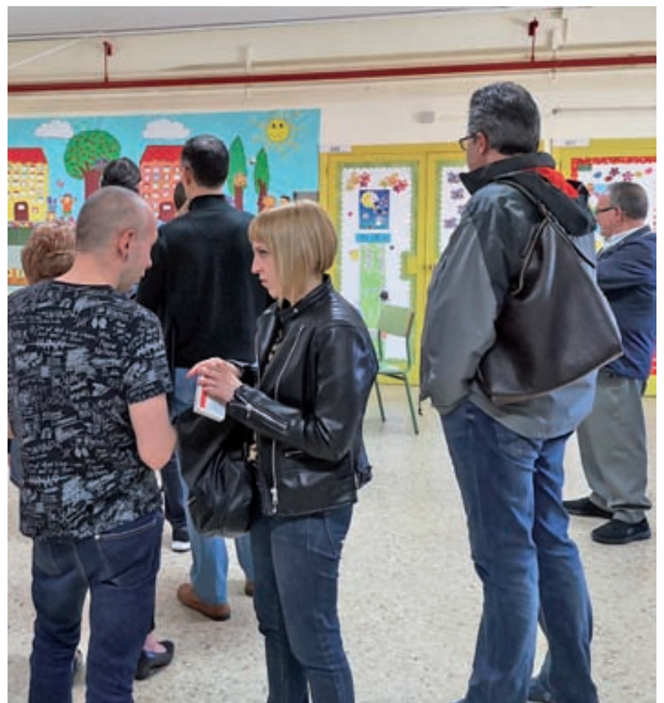
Colegio en el Noroeste

En Collado Villalba, el PSOE venció con 8.928 apoyos, seguido de Ciudadanos con 7.141, Unidas Podemos con 5.790 y el PP fue el cuarto partido con 5.255. Vox consiguió