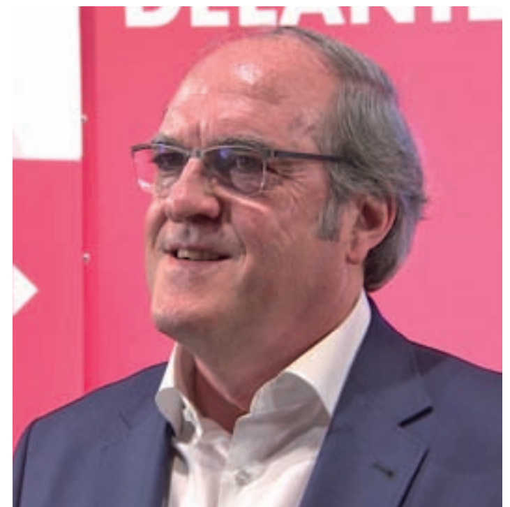
Dos aspirantes al cargo: La Asamblea de Madrid elegirá al próximo presidente regional antes del 3 de julio. Los candidatos a lograr mayoría absoluta son la popular Isabel Díaz Ayuso, que es la que parte con más opciones en estos momentos, y el socialista Ángel Gabilondo, que ganó los comicios.