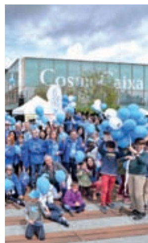
Día del Voluntario

41 ciudades de toda España. La edición de este año, impulsada por la labor de mil voluntarios de 'La Caixa' estuvo dedicada a la creatividad, la diversión y la ilusión, con talleres de manualidades, juegos educativos y deportivos,