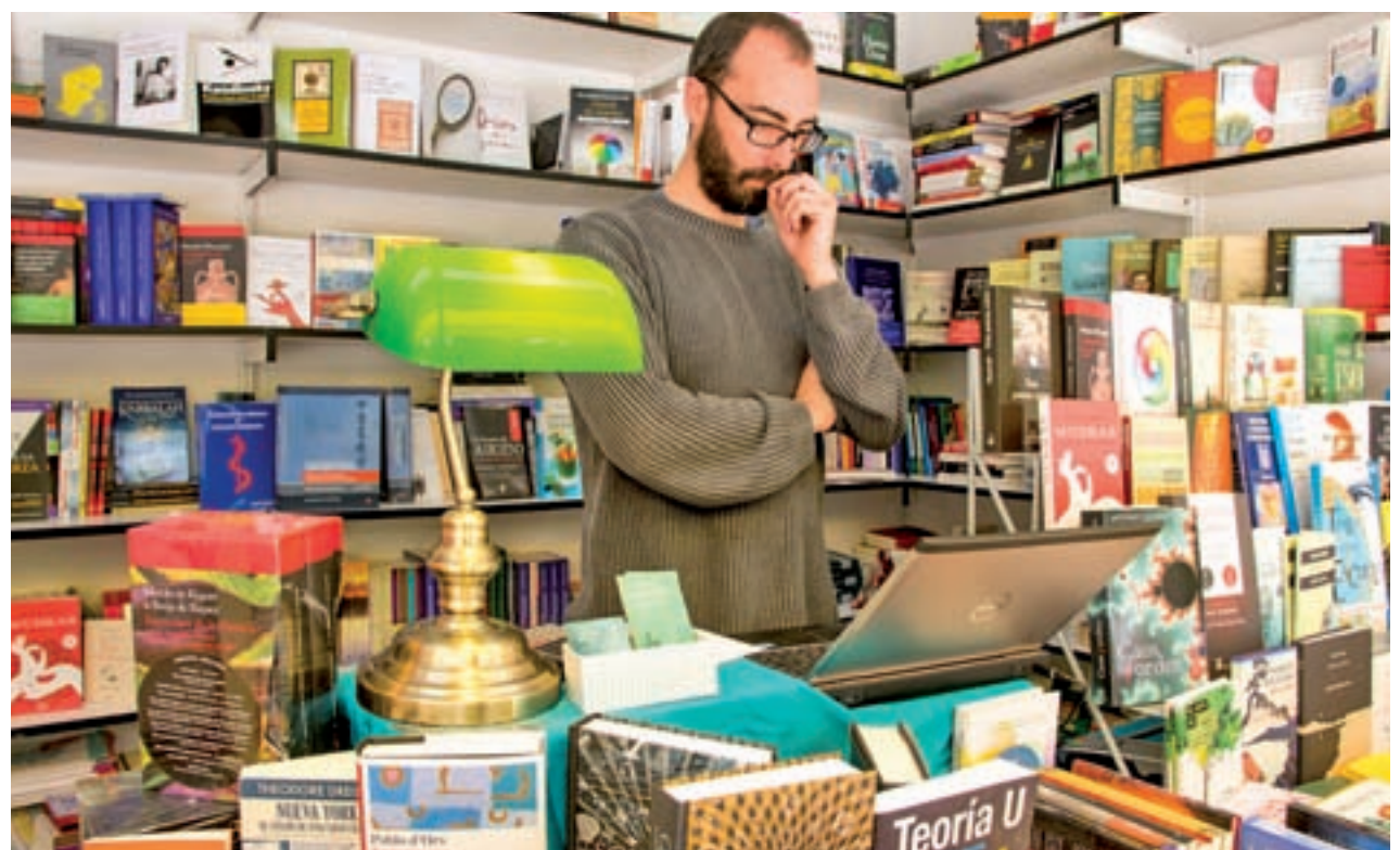
Los visitantes podrán pasear por 360 casetas FERIA DEL LIBRO DE MADRID

EL PRESUPUESTO DESTINADO A ACTIVIDADES SUBE DEL 3% AL 14%