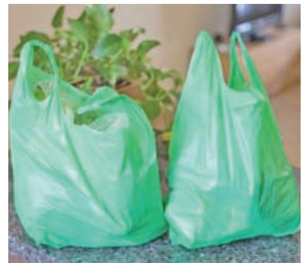
Bolsas de plástico en los supermercados

Este informe se elaboró el pasado mes de febrero con las entrevistas realizadas a 700 personas procedentes de varios puntos de España.