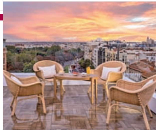
Vistas desde el hotel H10 Puerta de Alcalá

El H10 Puerta de Alcalá invita el miércoles 5 de junio a quienes visiten su terraza a compartir la espectacular