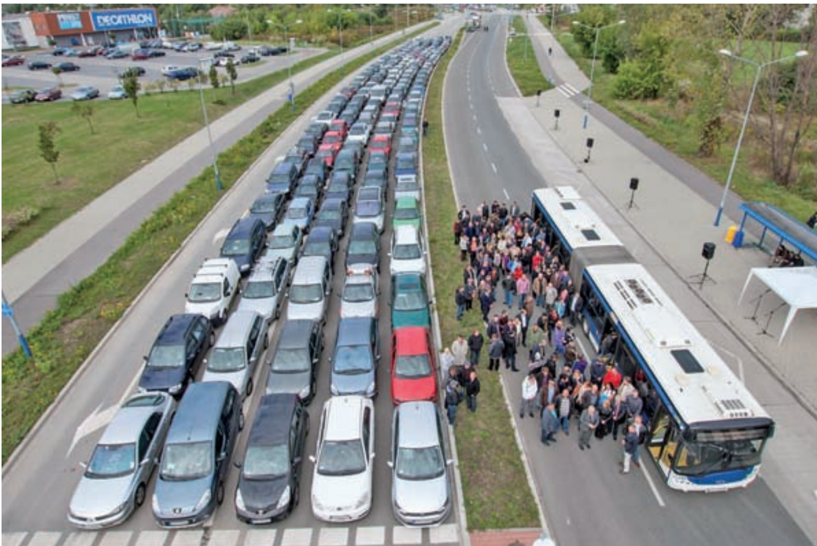
La movilidad urbana es uno de los retos a los que se enfrentan las administraciones públicas