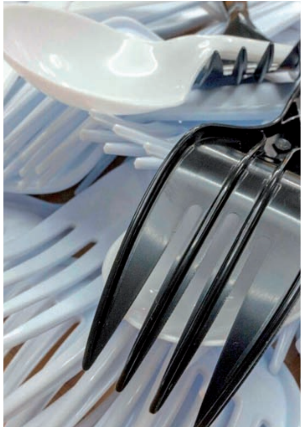
Los cubiertos de plástico tienen los días contados en Europa

te el proceso de reciclado. La idea es que, al margen de estas iniciativas comunes, los Estados miembros tomen "las medidas necesarias" para reducir de manera significativa el consumo de otros productos, como los recipientes de