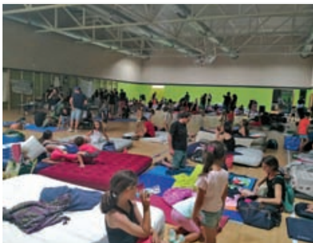
Un momento del acto reivindicativo

Por otro lado, los robos con violencia e intimidación subieron un 8,2%, de las 2.351 hasta los 2.543 infracciones; y los perpetrados con fuerza en casas bajaron un 11%, anotando un total de 1.252 frente a los 1.406 de hace 12 meses. Siguiendo con los números, los hurtos crecieron un 6,8%, hasta los 30.206 (en 2018 fueron 28.982). Y aunque bajaron las sustracciones de vehículos un 6% (1.281 denuncias), los delitos relacionados con el tráfico de drogas subieron un 32% (de 341 a 250).