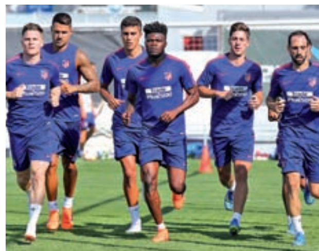
Imagen de la pretemporada de 2018

El lugar donde se llevarán a cabo las primeras sesiones de entrenamiento será un destino habitual, la localidad segoviana de Los Ángeles de San Rafael, donde los pupilos de Simeone comenzarán a