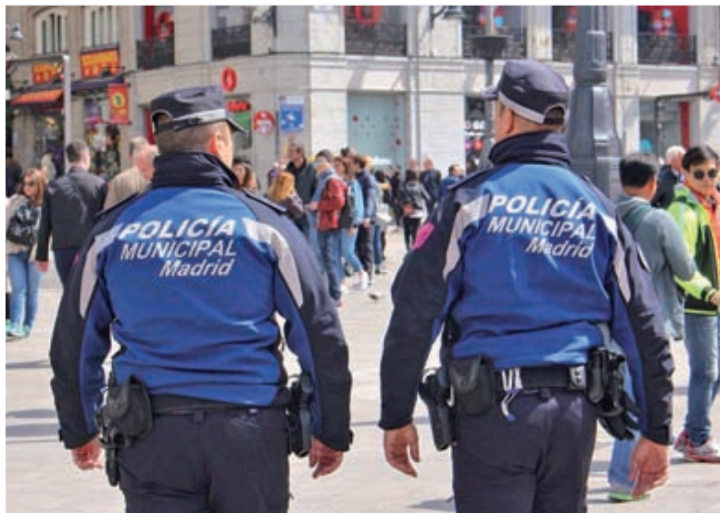
Dos agentes patrullan por la Puerta del Sol

lesiones y riñas, y también de tráfico de drogas. Así, lo refleja el Balance de la Criminalidad elaborado por el Ministerio del Interior compuesto por datos de Policía Nacional y Municipal, y que analiza las denuncias de las que hubo constancia en comunidades autónomas, provincias, islas, capitales y localidades con más de 30.000 habitantes, en los primeros tres meses del año.