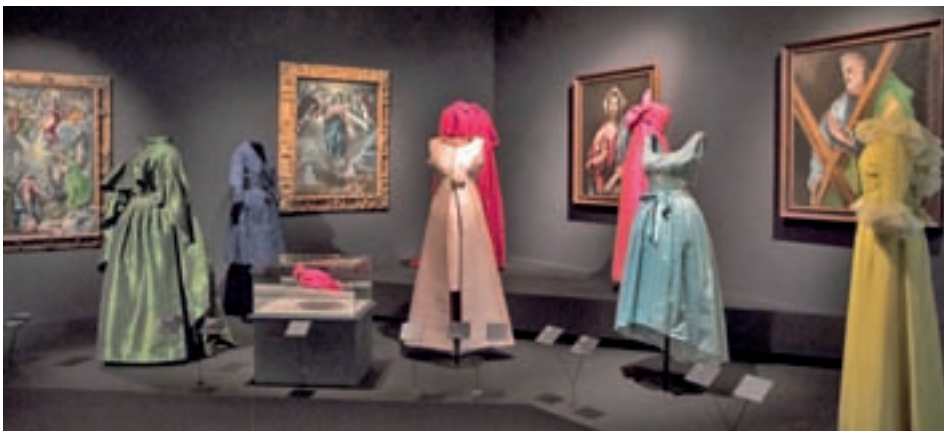
El Greco es una de sus grandes referencias MUSEO NACIONAL THYSSEN- BORNEMISZA