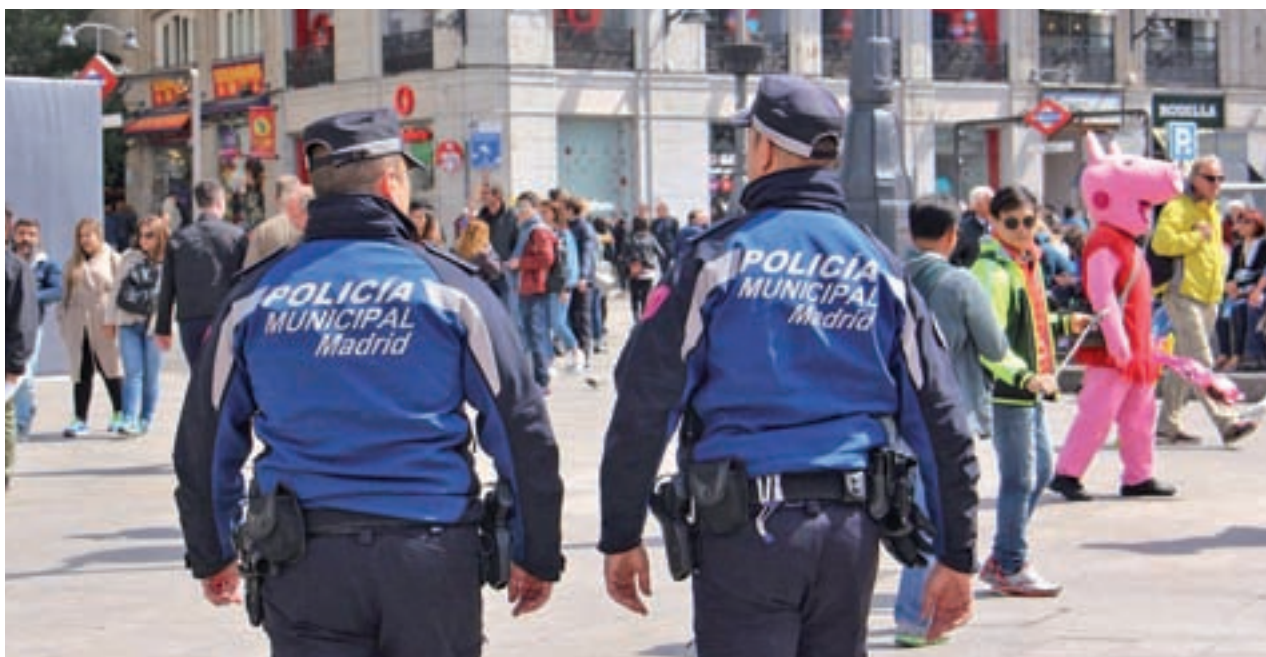
Dos agentes patrullan por la Puerta del Sol