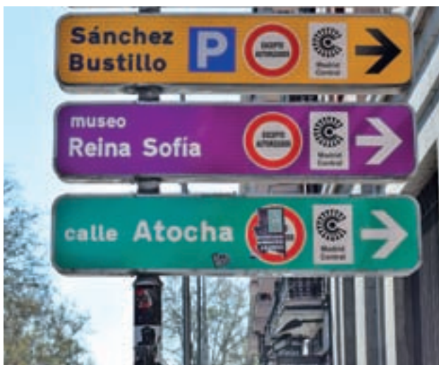
Limitaciones en Madrid Central