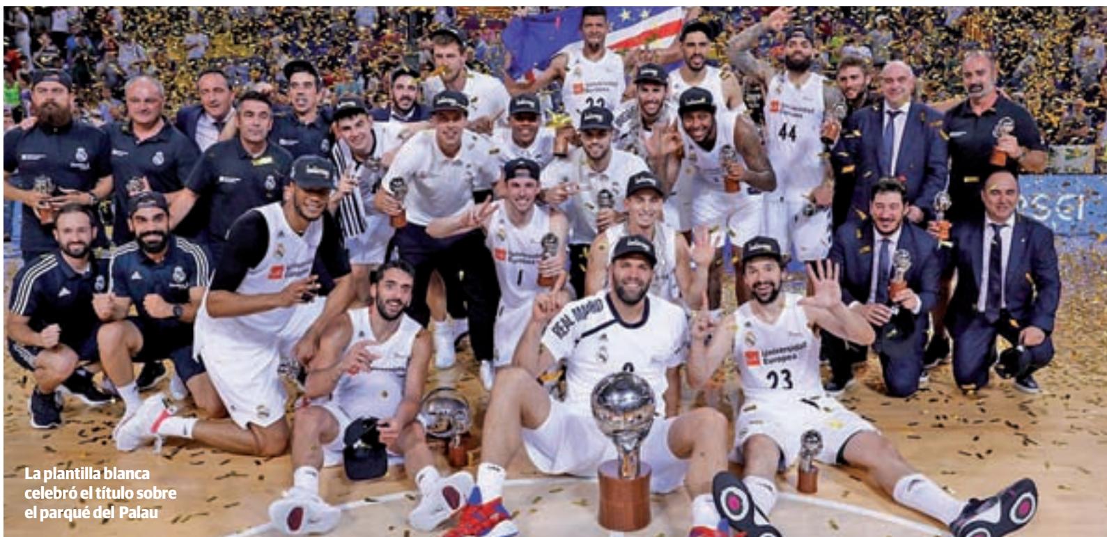
La plantilla blanca celebró el título sobre el parqué del Palau

EL VITORIANO YA ES EL CUARTO TÉCNICO CON MÁS TÍTULOS DE LIGA ENDESA