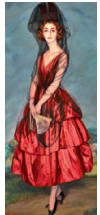
MUSEO NACIONAL THYSSEN- BORNEMISZA