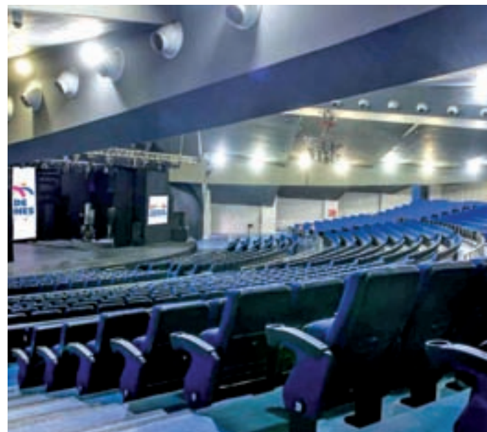
Reapertura del Gran Teatro Auditorio: Con motivo del 50 aniversario del Parque de Atracciones, el Gran Teatro Auditorio, que en los años 90 albergó los conciertos de los principales artistas nacionales, reabre totalmente remozado como lugar de celebración de eventos, conciertos y todo tipo de citas y congresos.

100 millones Desde que abriera sus puertas en mayo de 1969, el conocido como 'parque de los madrileños' ha recibido a más