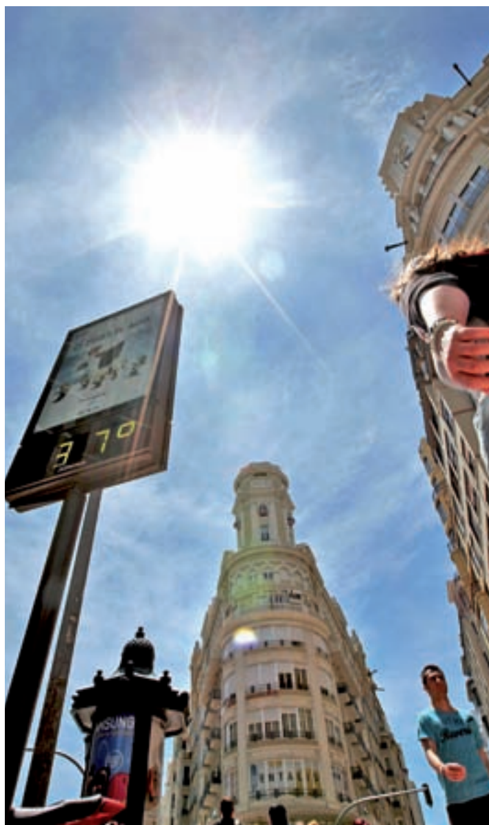
Las altas temperaturas serán una constante GENTE

"Estamos en el tercer año hidrológico y natural más seco del siglo XXI", comentó Del Campo, que añadió que, de acuerdo con el valor del Índice de Precipitación Estandarizado (SPI), se puede hablar de sequía en España en las provincias de La Coruña, Burgos, Vizcaya, Huesca, en el sur de Castilla y León, la Comunidad de Madrid, Extremadura, oeste de Castilla-La Mancha, el tercio occidental de Andalucía, norte de Tenerife y La Palma.