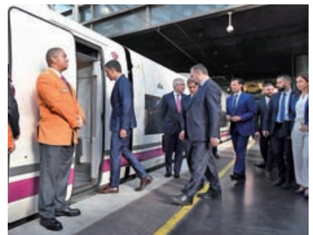
Pedro Sánchez, durante el viaje inaugural

El presidente del Gobierno en funciones, Pedro Sánchez, junto al ministro de Fomento, José Luis Ábalos, presidió el viaje inaugural del nuevo trayecto desde la estación de Madrid-Atocha, al que posteriormente se sumó el presidente de la Junta de Andalucía, Juan Manuel Moreno, entre otras autoridades.