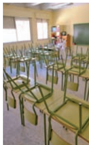
Las aulas están vacías

años). Los del segundo ciclo (3 a 6 años) y los de Primaria harán lo propio el lunes 9, mientras que los de Secundaria, Bachillerato y Formación Profesional regresarán a la actividad lectiva el martes 10 de septiembre.