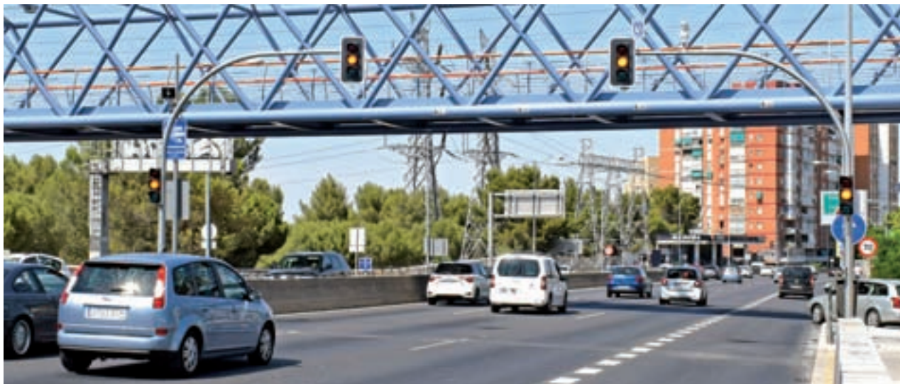
Los dispositivos de la carretera de Extremadura lucen solo en ámbar

El Ayuntamiento los ha desactivado esta semana apenas cuatro meses después de su entrada en funcionamiento ● El radar de tramo seguirá controlando la velocidad, si bien el límite ha pasado de 50 a 70 kilómetros por hora