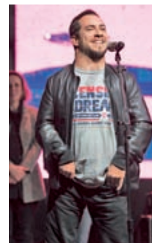
Juan M. Montilla 'El Langui'

de sobresale el concierto del grupo La Excepción, capitaneado por Juan Manuel Montilla 'El Langui' (este viernes 28 de junio a las 22 horas en el recinto ferial del Parque de Salvador Allende). Otras de las citas a tener en cuenta se-