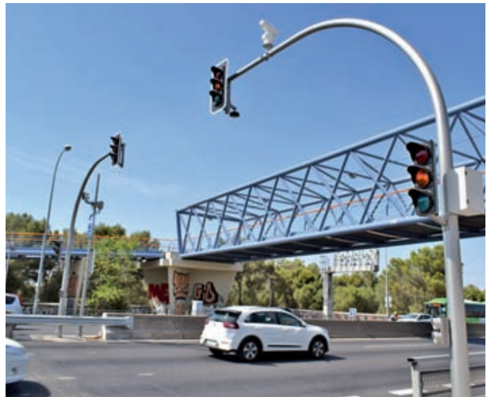
Los controvertidos semáforos instalados a la salida de la carretera de Extremadura

Por otro lado, el radar de tramo de la A-5 se mantiene una