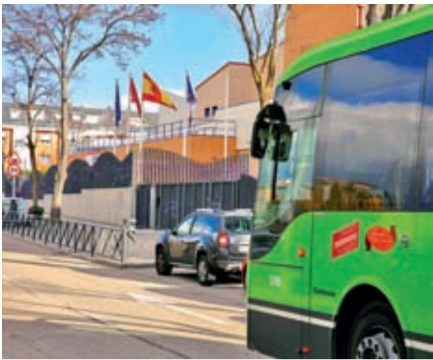
El centro educativo