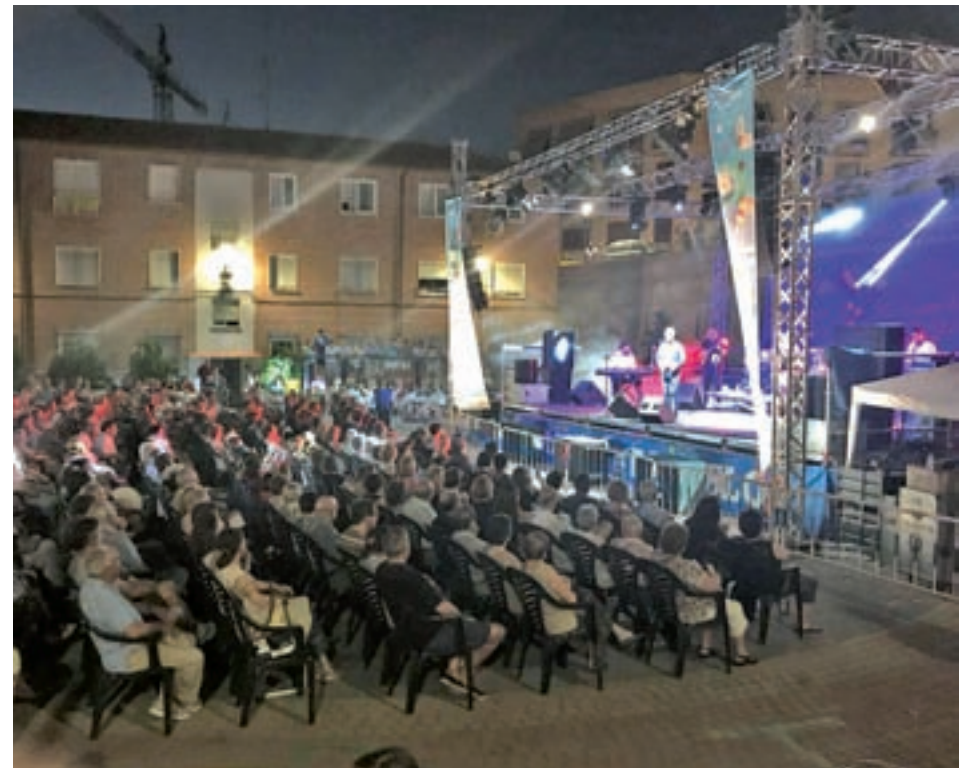
Anteriores actuaciones de la programación pozuelera

Comienza la programación de los 'Veranos de Pozuelo' con música, cine y espectáculos ● Habrá propuestas para toda la familia y actuaciones de humor como la de Luis Piedrahita