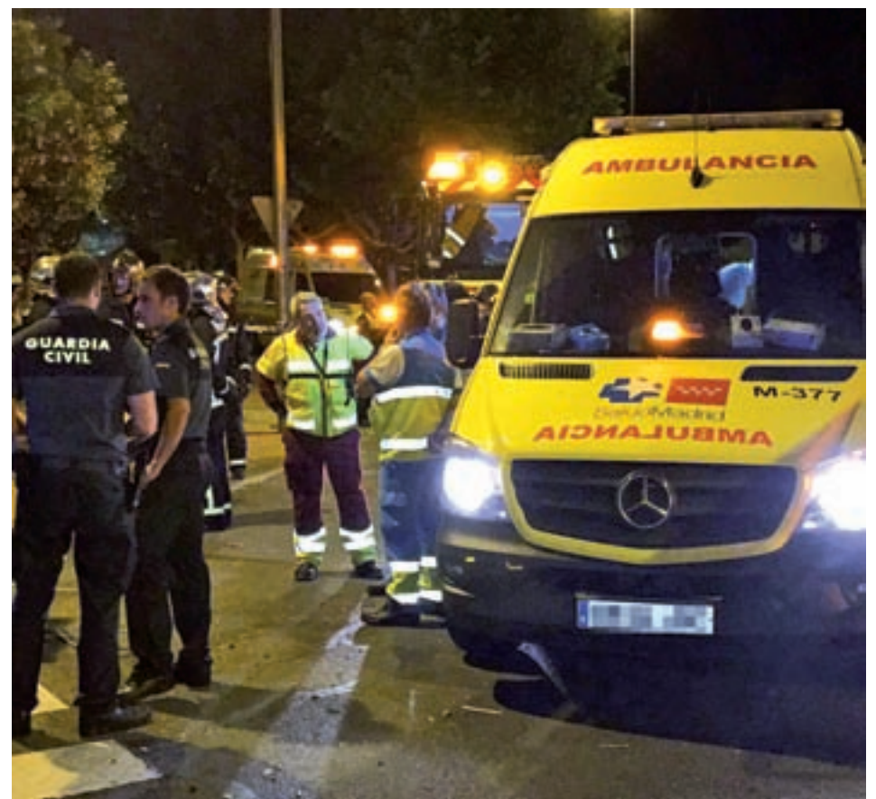
Suceso en el Noroeste

Pozuelo de Alarcón tampoco se ha mostrado satisfecho por sus datos de infracciones, ya que aumentaron de 766 del año pasado a 916 de este año, un porcentaje del 19,6%. Desglosando las cifras la localidad obtuvo buenos datos en aspectos impor-