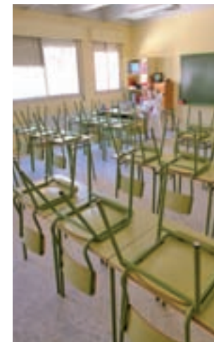
Las aulas están vacías

años). Los del segundo ciclo (3 a 6 años) y los de Primaria harán lo propio el lunes 9, mientras que los de Secundaria, Bachillerato y Formación Profesional regresarán a la actividad lectiva el martes 10 de septiembre.