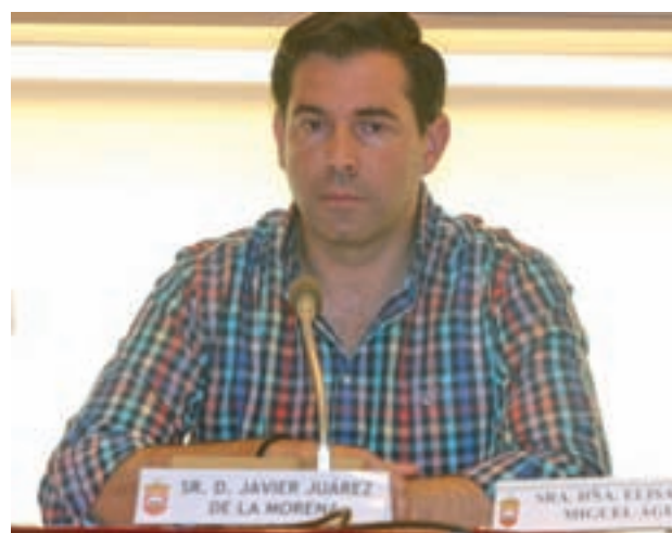
El portavoz del Gobierno, Javier Juárez

En esa sesión el Ejecutivo votó a favor de delegar en las juntas de Gobierno local un mayor número de cuestiones que hasta ahora, algo que rechaza la oposición, que considera que "se vacía al Pleno, que queda con el mínimo contenido".