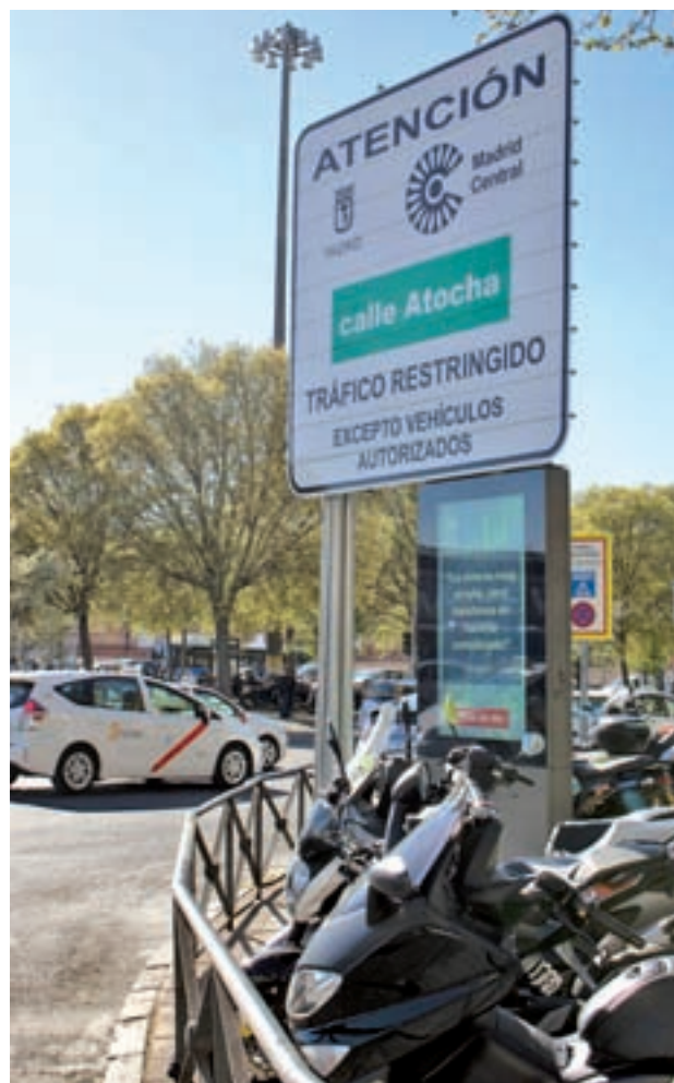
El cartel situado en la calle de Atocha

Mientras, el Ayuntamiento de Madrid, que ya anunció que iba a recurrir la sentencia, insistió este martes 9 de julio en que acatará las decisiones judiciales, aunque sigue pensando que la moratoria de sanciones en Madrid Central es “adecuada”. Además, recordó que “un auto de medi-