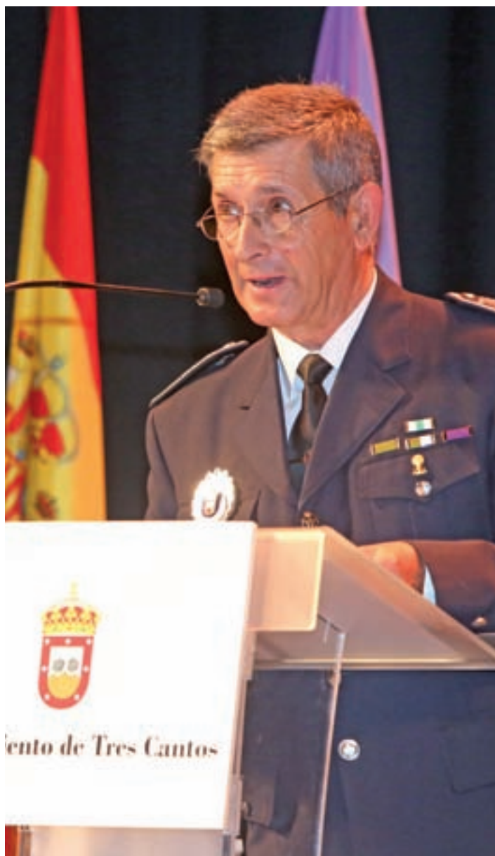
Alcázar en el Día de la Policía, el pasado 24 de junio

El exagente añade que, debido a que Tres Cantos es una ciudad joven, su población no tiene el fuerte arraigo social que sí existe en otras localidades. A ello se suma que la adolescencia es la etapa "donde más desconcierto e inseguridades" se tienen, lo que, a su juicio, hace imprescindible que esta ciudad del