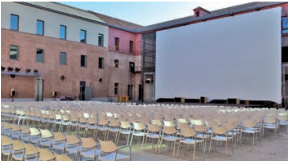
Cine de verano en Conde Duque