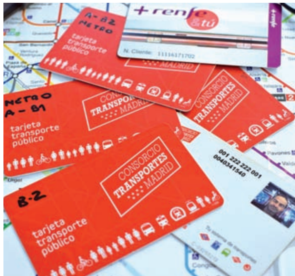
Las diferentes tarjetas Multi que han de utilizar algunos usuarios

"En una de ellas tengo los bonos de diez viajes que me permiten moverme entre la zona B2, que es donde vivo, y la A, que es donde trabajo", señala. "La segunda es solo B2 y la empleo en los autobuses urbanos de Majadahonda, mientras que la tercera es de B1-A y la utilizo cuando me acerco en coche a la estación de Renfe para dejarlo en el parking y después ir hasta la capital". En cualquiera de ellas