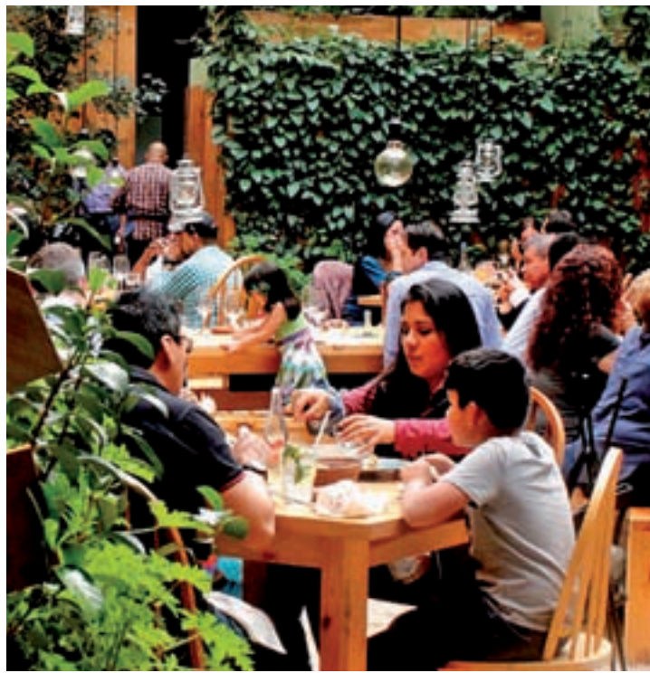
Comer fuera es la opción preferida

Es una de las alternativas que más crece, tres puntos.