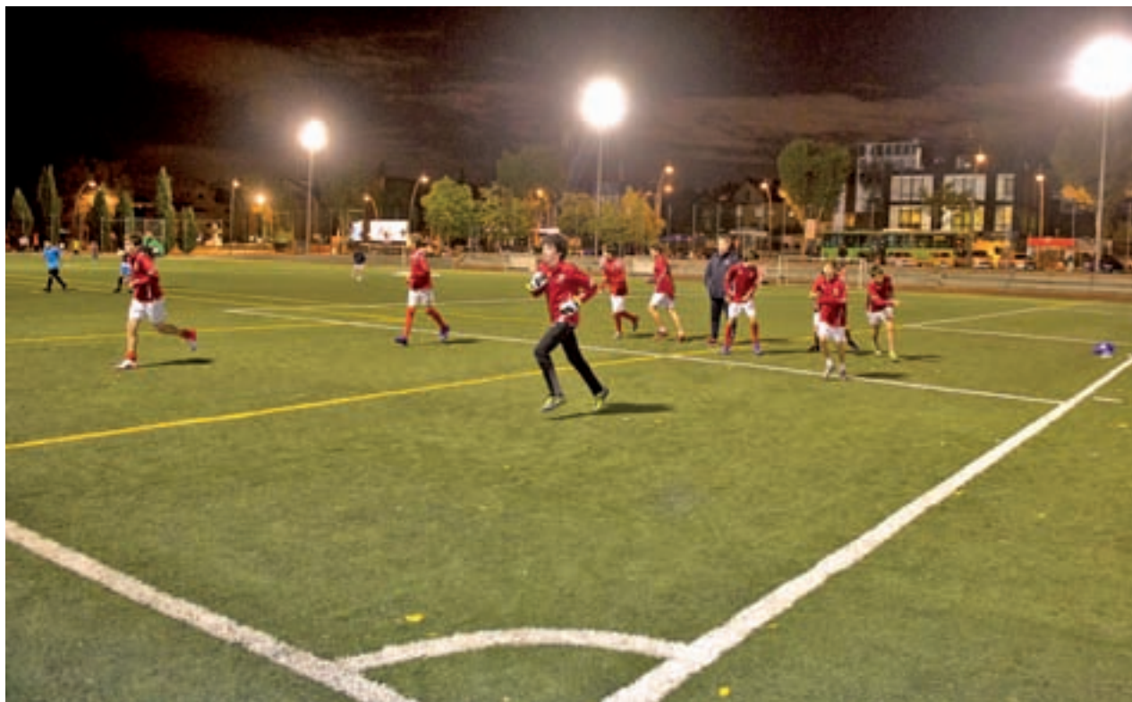
Campo de fútbol de El Pradillo

Otra de las medidas que afectarán en buena medida a los deportivos pozueleros será la remodelación del campo de hierba de la pista de atletismo en el Valle de las Cañas. En esta infraestructura se acometerá en un futuro, sin plazo aún fijado, las obras necesarias para conseguir su homologación, lo que permitirá disputar más campeonatos.