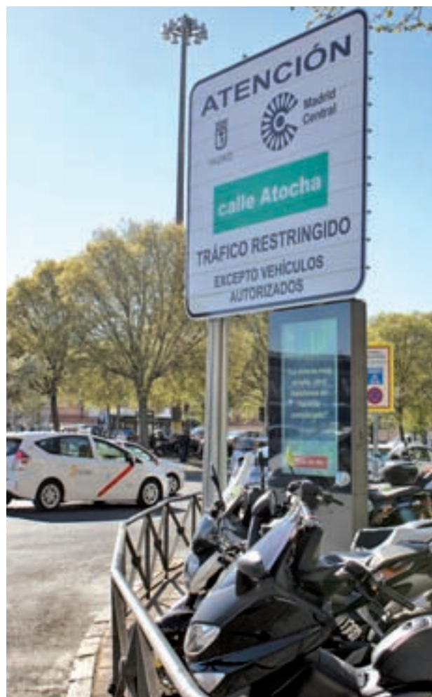
El cartel situado en la calle de Atocha

Mientras, el Ayuntamiento de Madrid, que ya anunció que iba a recurrir la sentencia, insistió este martes 9 de julio en que acatará las decisiones judiciales, aunque sigue pensando que la moratoria de sanciones en Madrid Central es “adecuada”. Además, recordó que “un auto de medi-