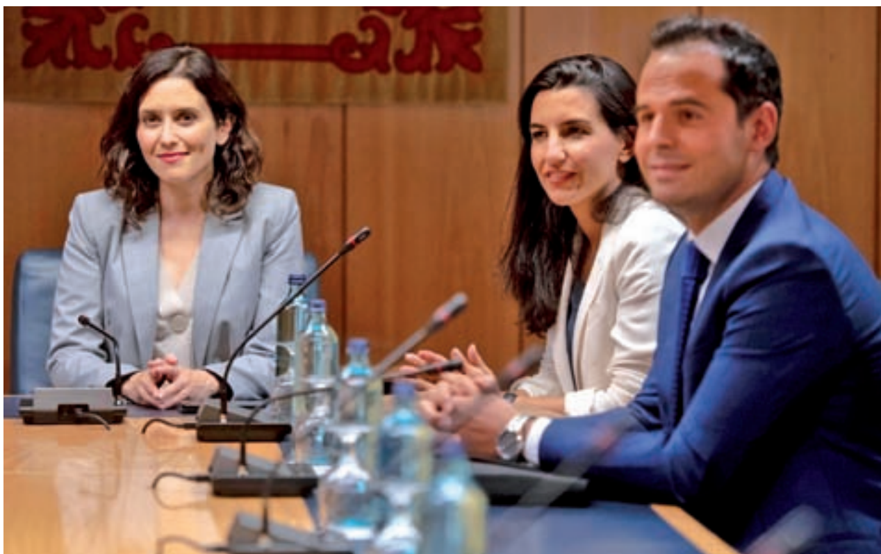
Díaz Ayuso, Monasterio y Aguado el pasado martes en la primera reunión a tres