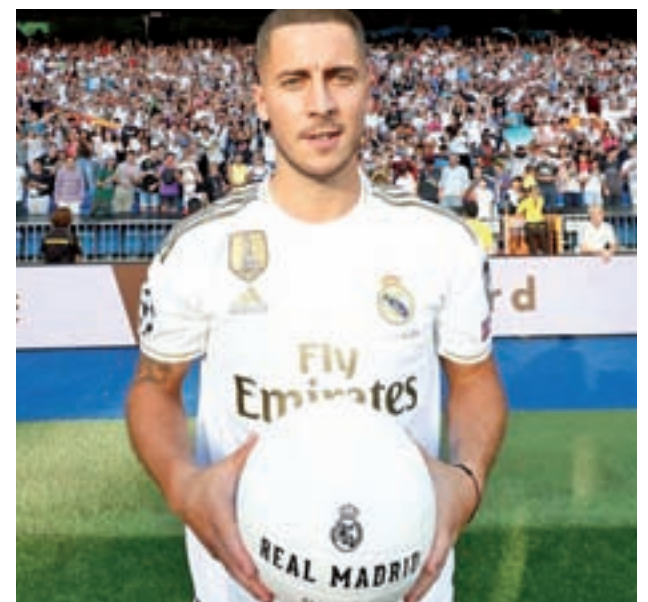
Eden Hazard está llamado a liderar el nuevo proyecto blanco

Todas estas cifras responden a la celeridad con la que Real Madrid, Atlético y Barcelona