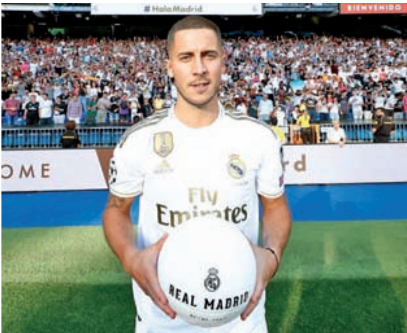
Eden Hazard está llamado a liderar el nuevo proyecto blanco