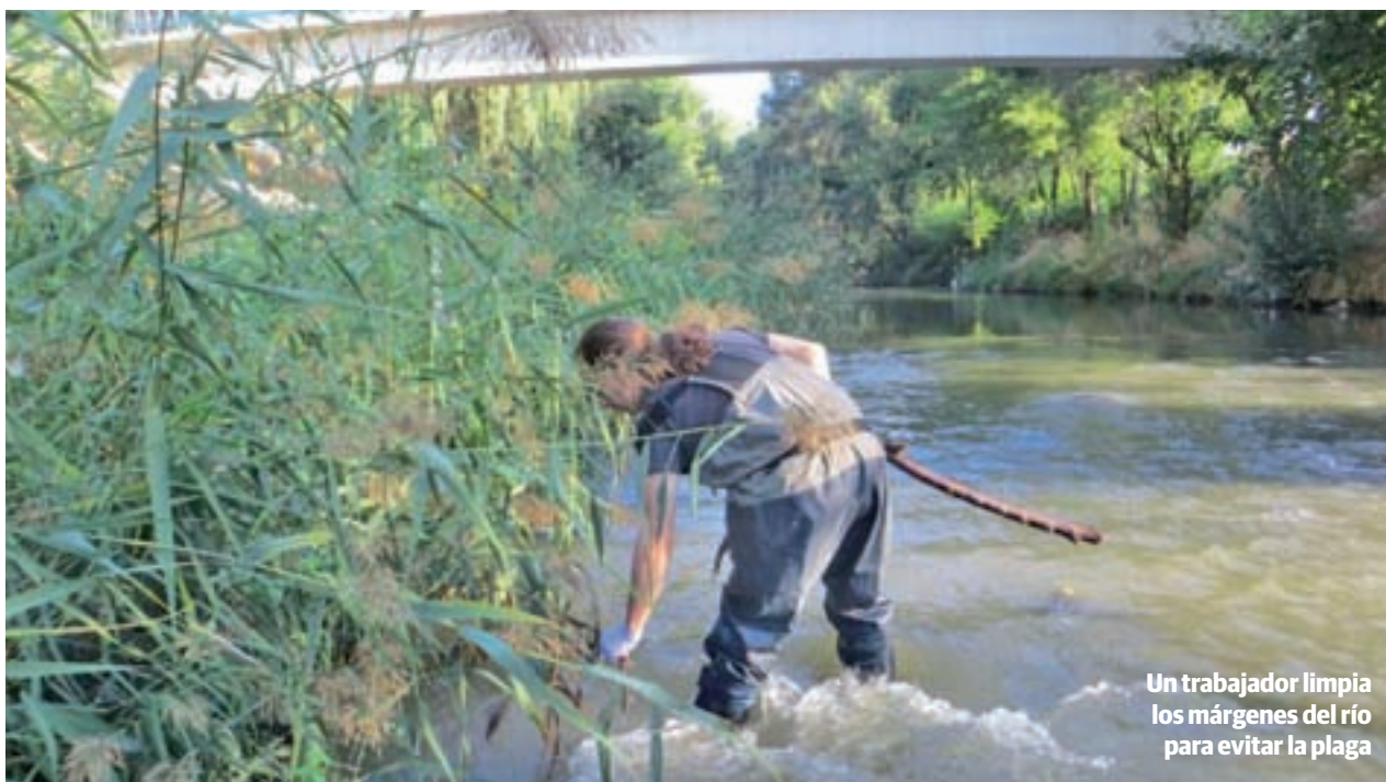
Un trabajador limpia los márgenes del río para evitar la plaga