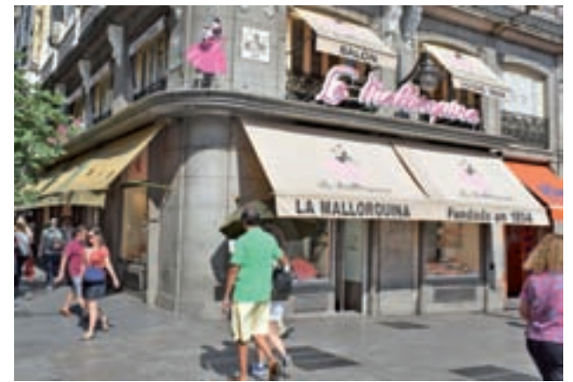
Escaparate principal de la confitería

La conocida pastelería festeja tan importante fecha con dos nuevos establecimientos • Abrió sus puertas en el año 1984, gracias a tres socios mallorquines que, además de dulces, ofrecían propuestas saladas