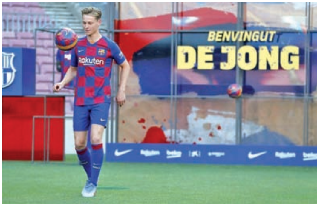
Frenkie De Jong ya se ha presentado con la camiseta del Barcelona