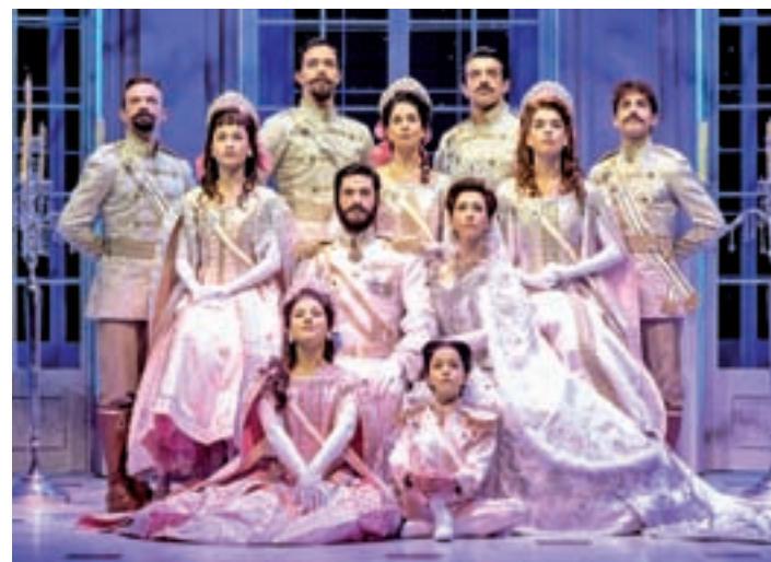
Escenografía totalmente nueva: Todo el montaje de Anastasia es completamente nuevo y su estreno ha coincidido con el aterrizaje de la producción en el Teatro Coliseum. Se ha creado desde cero pensando en el escenario de la Gran Vía.

LA PRODUCCIÓN HA RECIBIDO SIETE PREMIOS DEL TEATRO MUSICAL