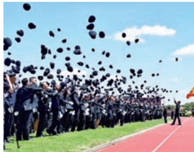
Los nuevos agentes se graduaron en Ávila

Algunas comisarías de distrito han recibido un considerable refuerzo de efectivos, especialmente las de Centro (100), Puente de Vallecas (55), Usera-Villaverde (50), Tetuán (40), Carabanchel (35), que junto con el resto de comisarías de Madrid y el Puesto