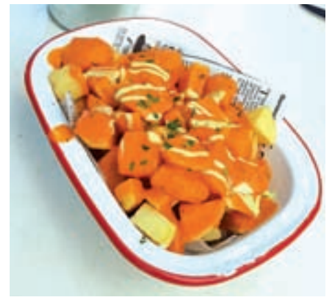
Las patatas bravas de Patio de Leones GENTE