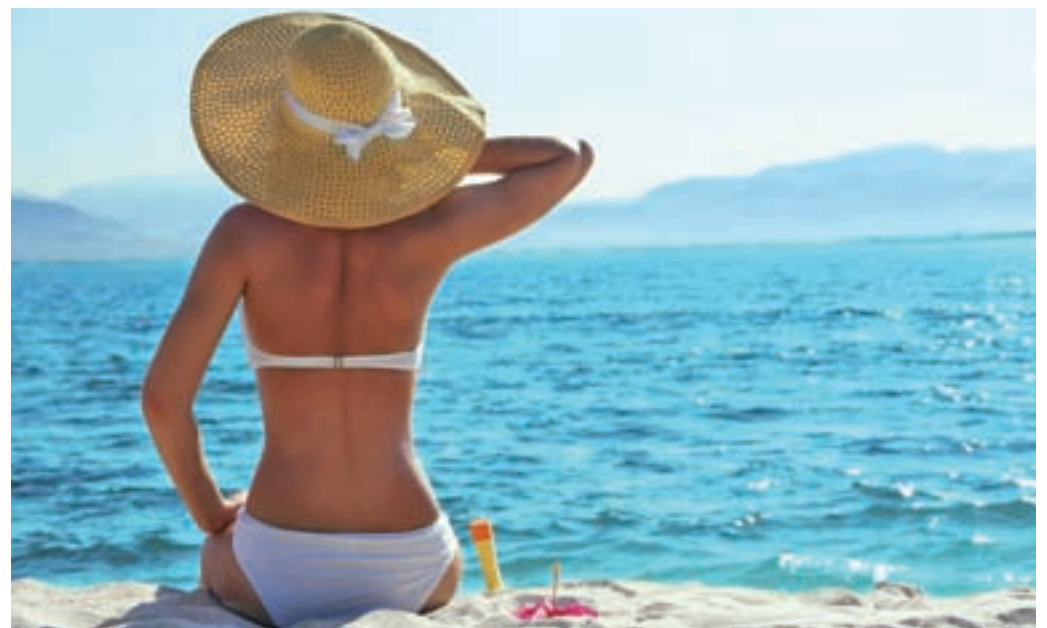
El mejor bronceado en la playa

Para el cuerpo, nos quedamos con el Scrub Plus Zionic de los centros de Carmen Navarro, inspirado en productos cien por cien mediterráneos como la lavanda, los cítricos y la sal marina. Además de dejarnos la piel radiante, nos relaja enormemente con el masaje que nos dan mientras nos extienden la crema hidratante.