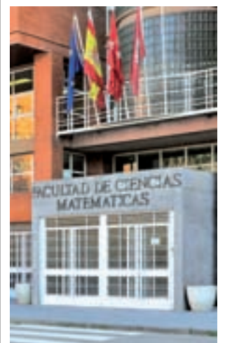
Facultad de Matemáticas

como son el Sistema Integrado de Información Universitaria (SIIU), que gestiona la Secretaría General de Universidades del Ministerio de Ciencia e Innovación con la colaboración de todas las universidades y las comunidades autónomas, así como la vida laboral de los afiliados a la Seguridad Social.