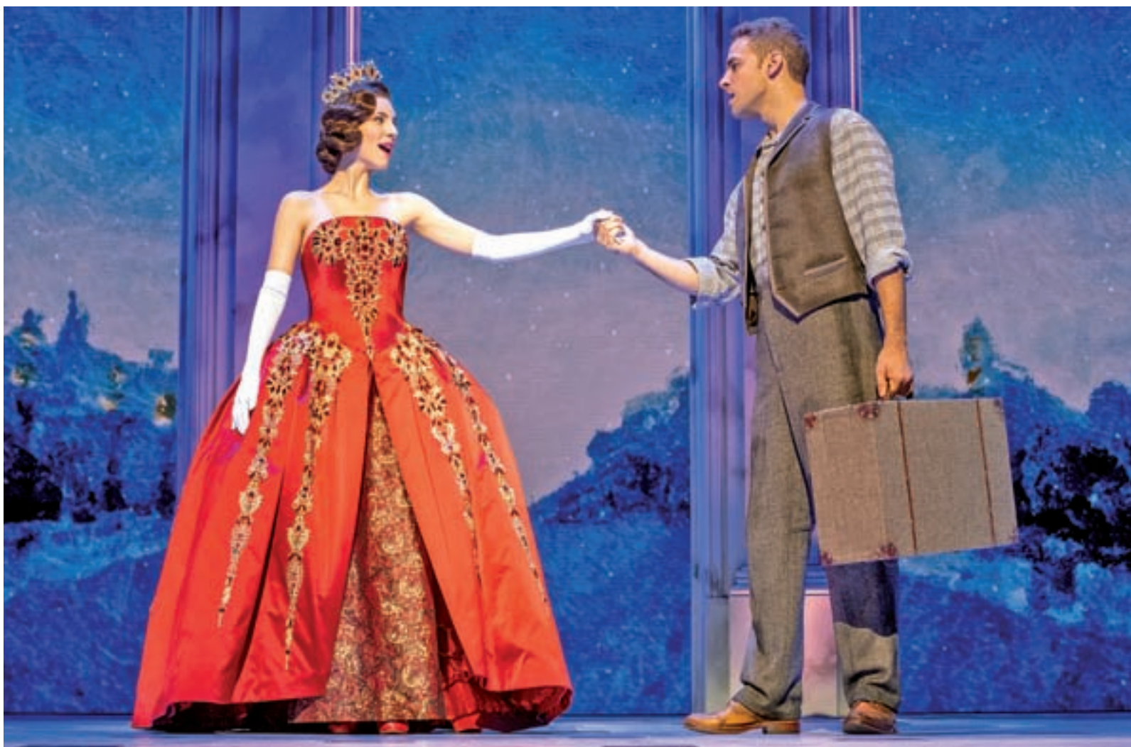
Un momento del espectáculo

EL VESTUARIO HA SIDO ELABORADO POR 16 TALLERES DE CUATRO PAÍSES