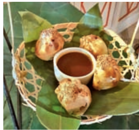
Dim sum de pato en Monsieur Sushista GENTE

Dentro de su menú son reseñables su pizza con láminas de atún curado, el arroz frito con confit de pato y salsa de frambuesa o su dim sum puff de pato con salsa hoisin.