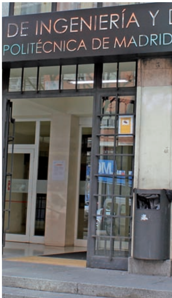
Universidad Politécnica de Madrid

en ese periodo. Por su parte, los de Derecho (55,7%) y Humanidades (57,6%) son los que menos afiliaciones registran al cuarto año de terminar sus estudios. A diferencia del anterior, este estudio desahoga los datos por sexos. Las mujeres fueron mayoría durante el curso 2013-2014, al-