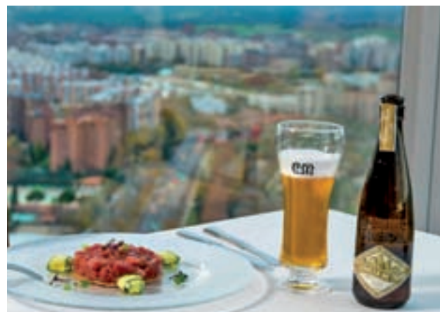
Las vistas de Madrid en Espacio 33 GENTE