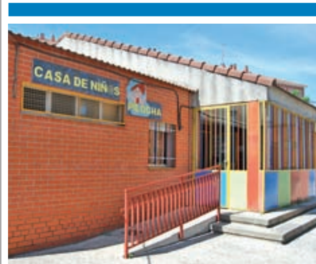
Casa de Niños Pilocho

Ciudadanos, PSOE, PP y Más Madrid votaron a favor de la anulación, mientras que Vox se abstuvo.