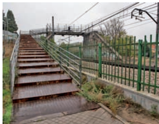
La actual infraestructura

ñora del Buen Consejo. Las reparaciones, para las que el Ayuntamiento invertirá cerca de 260.000 euros, tendrán un plazo de ejecución de cuatro meses desde el inicio de los trabajos e incluyen la remodelación de los accesos existentes en ambos lados con la instalación de rampas accesibles y escaleras. Además, se cambiarán las barandillas y se mejorará la iluminación.