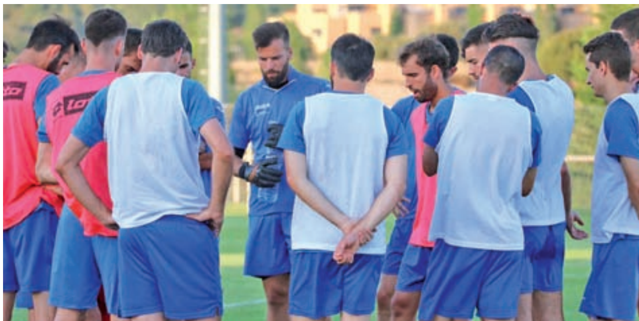
Las Rozas arrancará la Liga como local