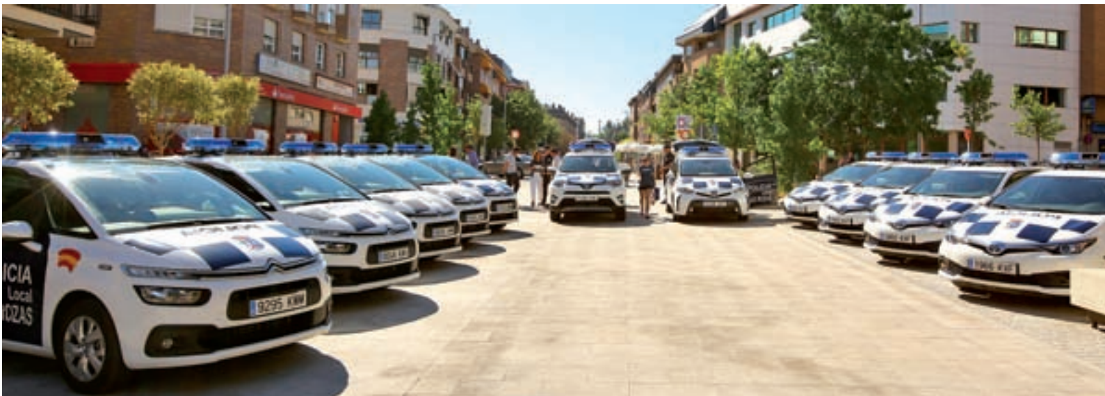
Nuevos vehículos de Las Rozas