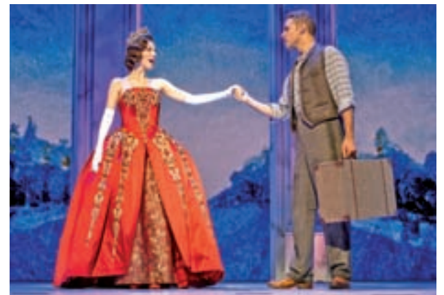
Un momento del espectáculo

● Permanecerá abierta al público en el Hotel Emperador de Madrid hasta el próximo domingo 11 de agosto