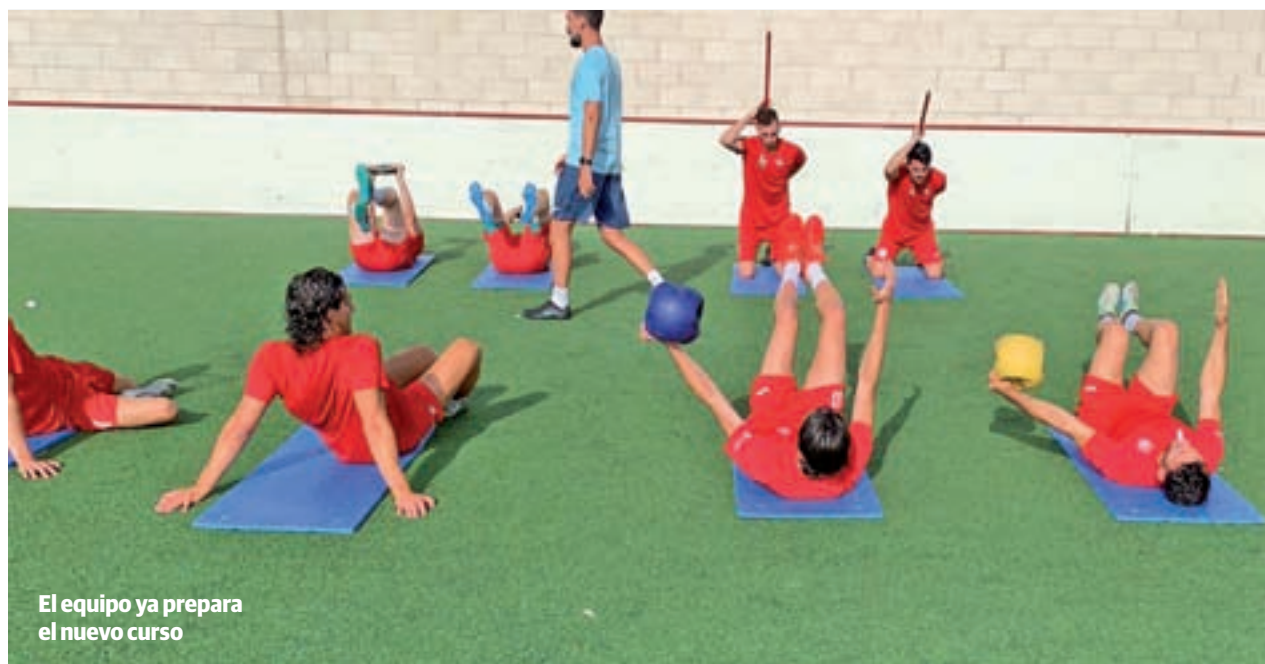
El equipo ya prepara el nuevo curso

con un recién ascendido, el Racing de Ferrol, como rival. En la segunda jornada tocará visitar el campo del Sporting B, antes de jugar nuevamente como local ante otro de los novatos en la categoría, el Ibiza.