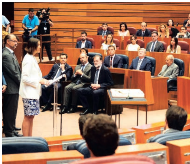
Intervención de la ministra Reyes Maroto en las Cortes de Castilla y León.