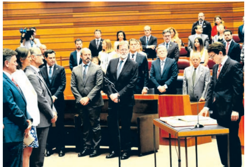
Fernández Mañueco jura como presidente de la Junta ante la mirada de varios invitados.