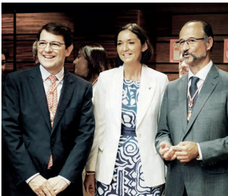
Fernández Mañueco, la ministra Reyes Maroto y el presidente de Las Cortes, Luis Fuentes.