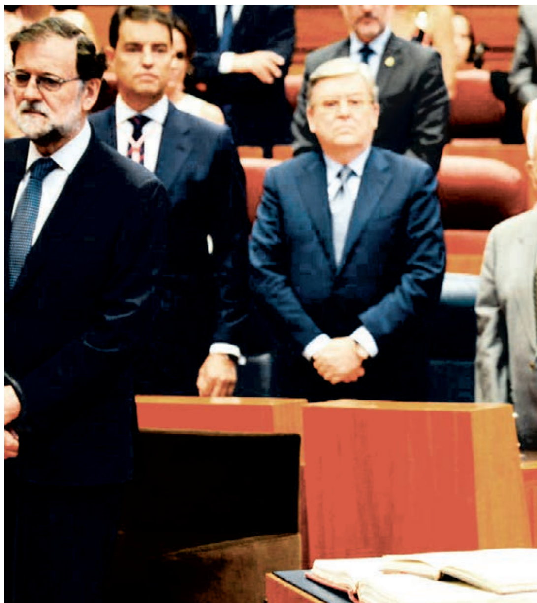
Alfonso Fernández Mañueco jura como presidente de la Junta de Castilla y León.

“Uno de los grandes poetas de nuestra lengua, Pablo Neruda, nacido hace hoy 115 años, escribió: ‘Queda prohibido no sonreír a los problemas, no luchar por lo que quieres, abandonarlo todo por miedo, no convertir en realidad tus sueños’. Hagamos realidad los sueños de la gente, sus aspiraciones, sus anhelos. Hagamos de esta tierra la mejor para vivir”, sentenció el presidente charro.