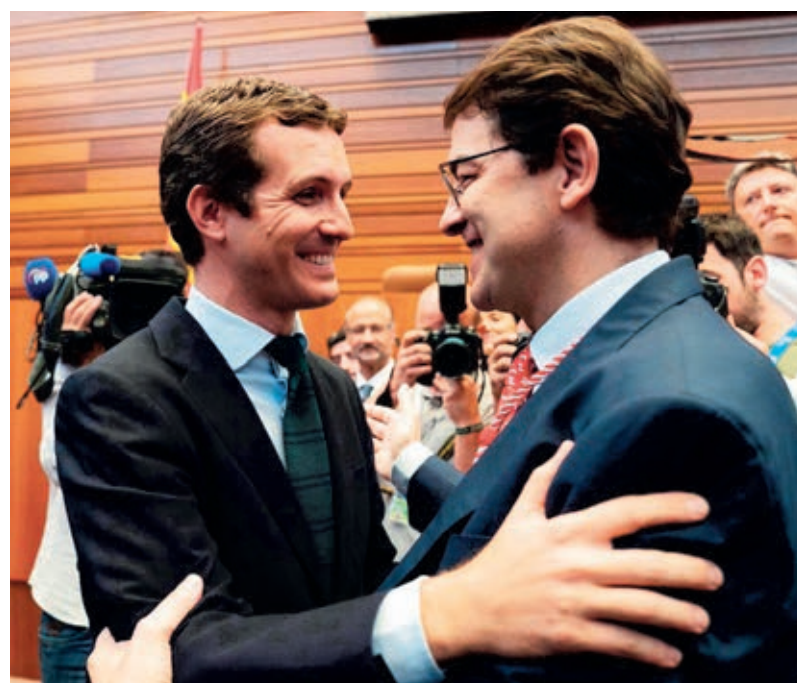
Alfonso Fernández Mañueco recibe la felicitación del presidente del PP, Pablo Casado.