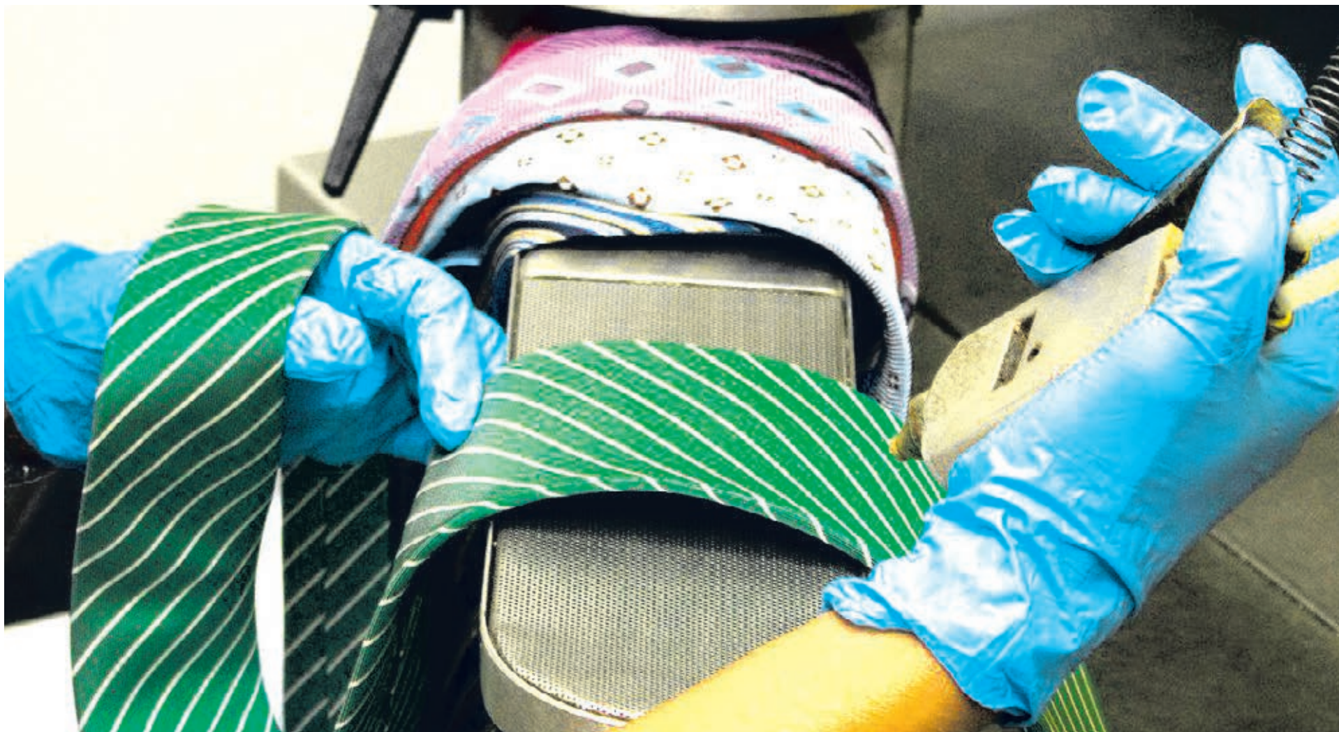
La Junta de Castilla y León invierte más de 20 millones de euros en programas de interés general, para atender fines sociales, entre ellos la inserción laboral.

Para las personas drogodependientes se destinará 1.147.000,85 euros y se actuará en prevención del consumo de drogas, reducción de los daños, asistencia a drogodependientes, integración sociolaboral de drogodependientes, atención a drogodependientes y familias.