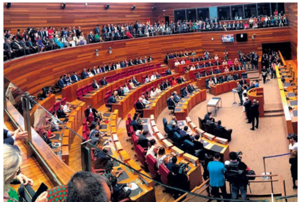
Imagen zenital de Las Cortes en la investidura de Fernández Mañueco.