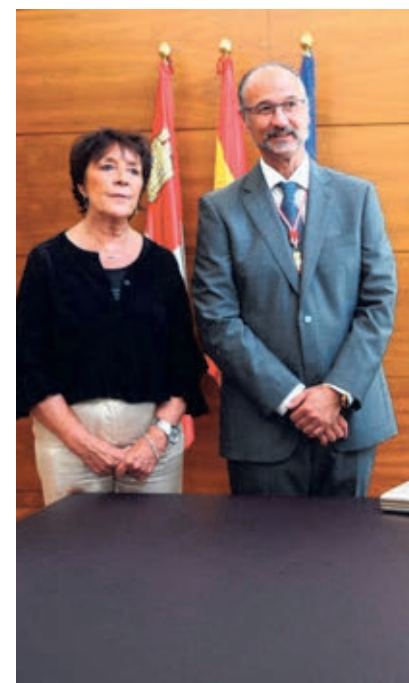
La ministra Reyes Maroto durante la firma en el libro.