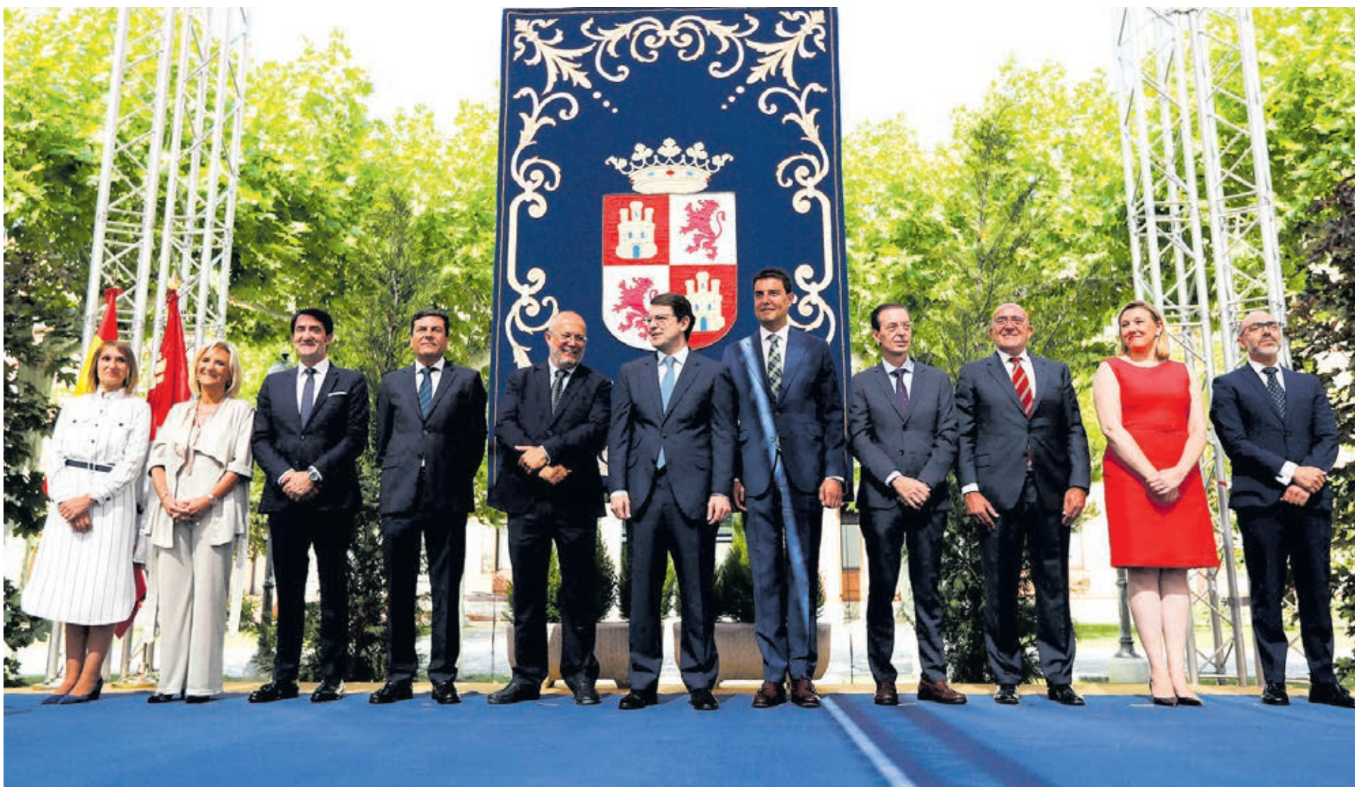
Foto de familia del nuevo Gobierno regional, con el presidente Alfonso Fernández Mañueco; el vicepresidente Francisco Igea; y los responsables de las distintas consejerías.