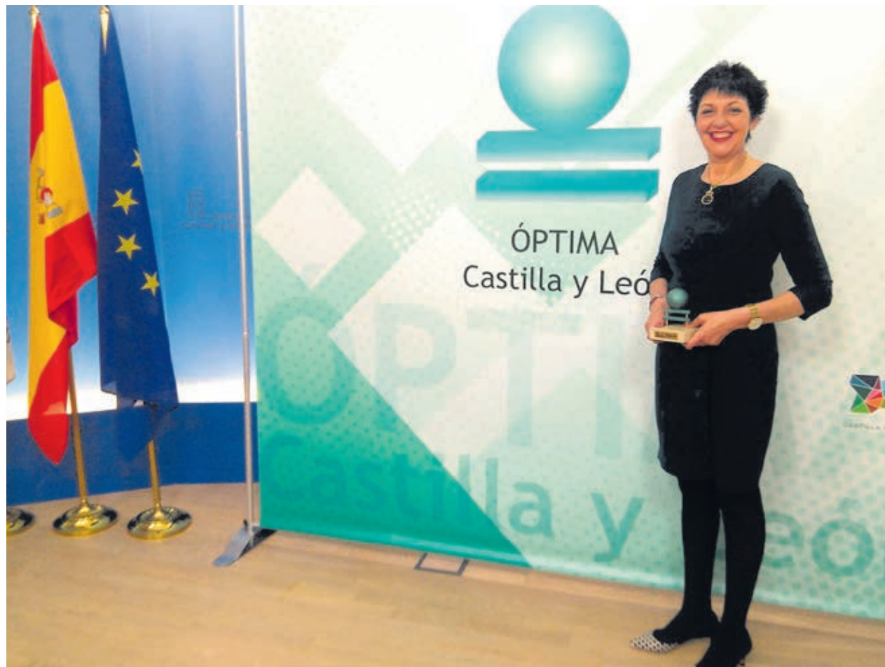
Entre sus diversos premios destaca la concesión en 2018 de la DISTINCIÓN ÓPTIMA CyL, por su trabajo en favor de la igualdad de oportunidades en el ámbito laboral.

en ADEME? Casi el 100% de nuestras socias son autónomas (en total son 97 socias).