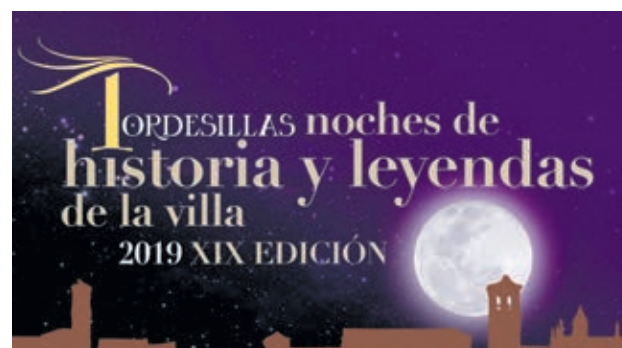
Cartel de la representación teatral.

Con motivo del V Centenario de la Primera Vuelta al Mundo de Magallanes y Elcano, las visitas teatralizadas que organiza la Oficina de Turismo de Tordesillas están dedicadas a esta hazaña. A escena los días 20 de julio, 3, 10 y 17 de agosto en Tordesillas. Pág. 13