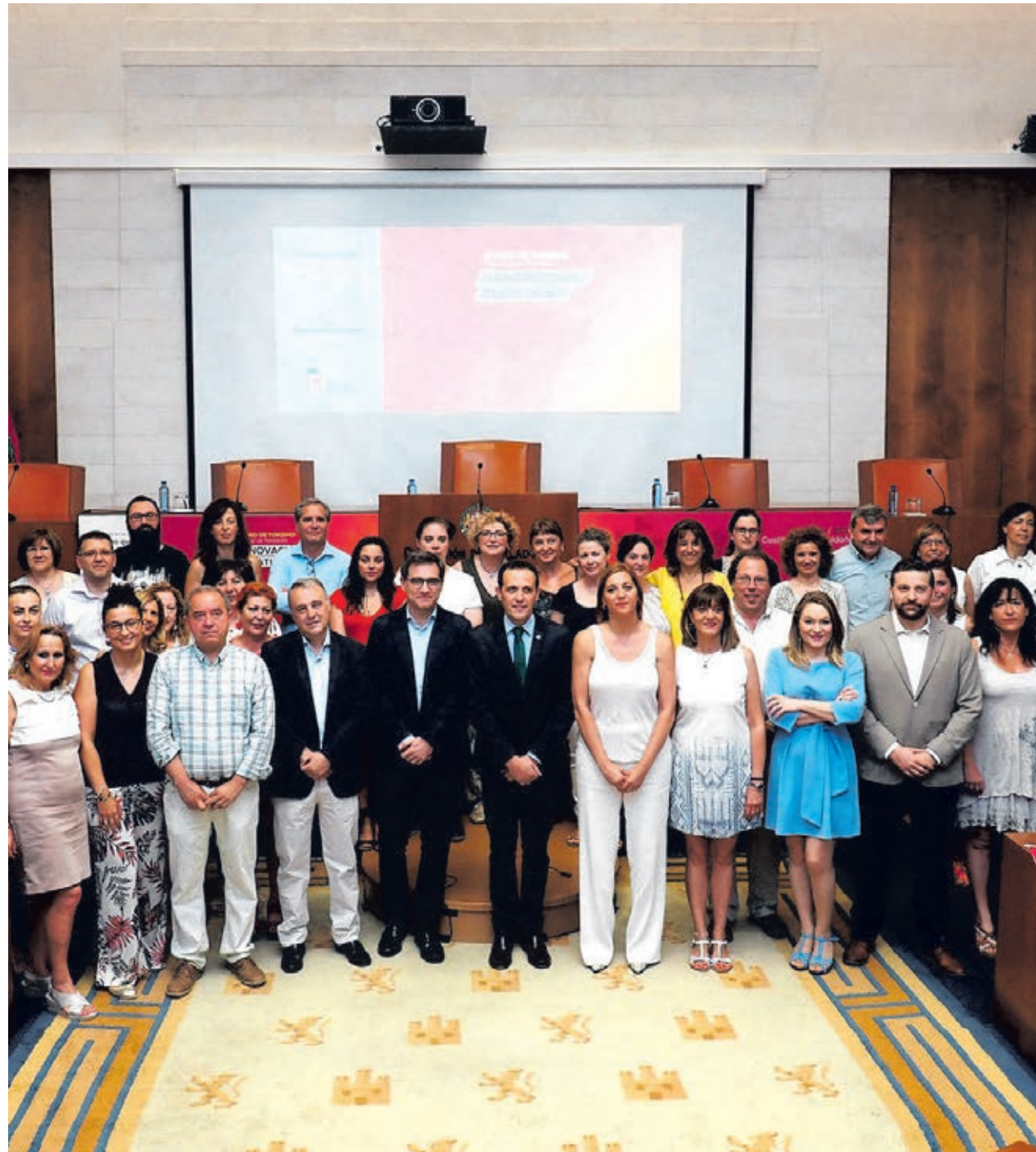
IV Foro de Turismo Provincia de Valladolid en Fuensaldaña (Valladolid).

Asimismo señaló que la Diputación de Valladolid ya participa en varios proyectos tanto de aplicación de las tecnologías de la información como de Big Data, al tiempo que anunció que "se está trabajando en la línea de turismo inteligente con un proyecto de señalización digital de recursos turísticos e información en movilidad en la Villa del Libro de Uruña así como en un proyecto piloto de