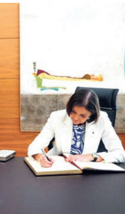
o de Honor de las Cortes de Castilla y León.