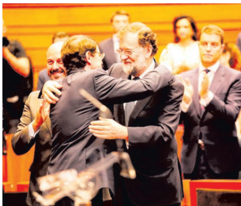
Mariano Rajoy felicita a Alfonso Fernández Mañueco.