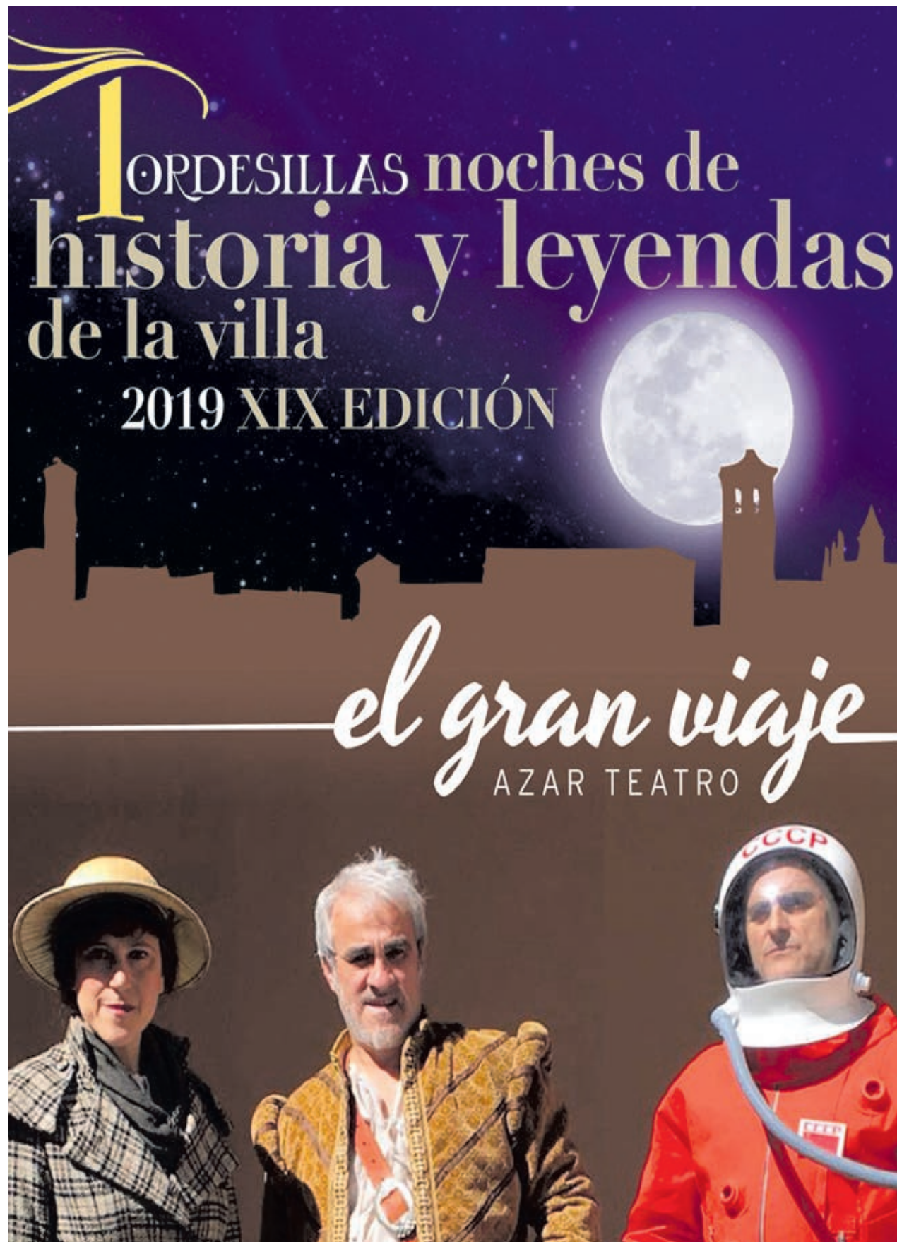
Este teatro recuerda una de las empresas más impresionantes de la Humanidad.

TRATADO DE TORDESILLAS El precedente del Tratado de Tordesillas fue el Tratado de Alcaçovas, firmado en 1479 entre las coronas castellana y portuguesa. En dicho tratado no sólo se ponía fin a la guerra de sucesión provocada tras la muerte del rey Enrique IV por el trono castellano entre Isabel La Católica y Juana la Beltraneja, sino que además se repartían los derechos de navegación y conquista del Océano Atlántico. Según este tratado, el reino de Castilla,