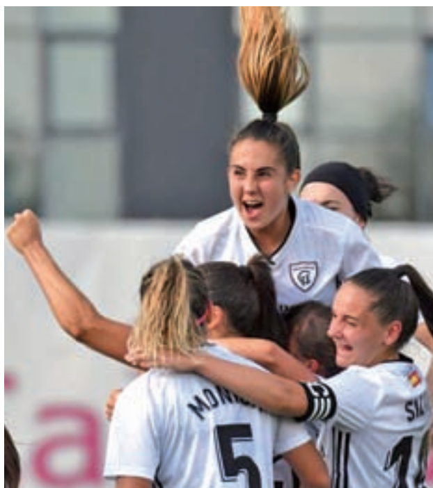
El Madrid CFF se impuso por la mínima al Betis

El estreno de la Primera División Femenina 2019-2020 dejó noticias opuestas para los representantes madrileños. Mientras el Atlético y el