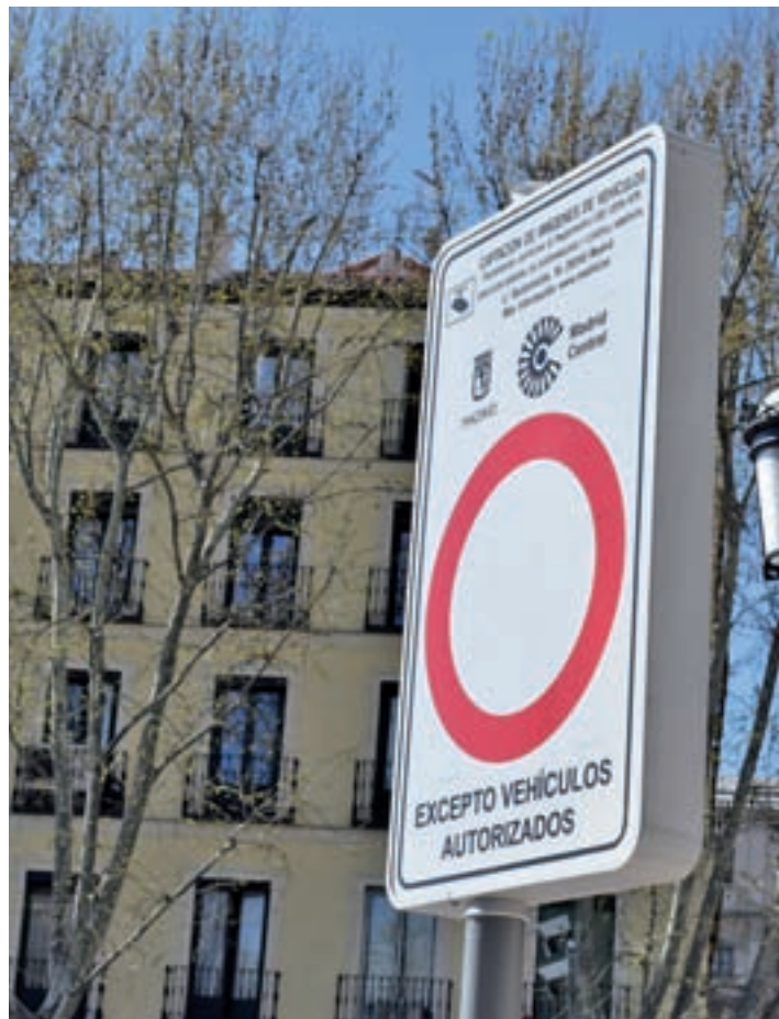
Uno de los carteles que prohíbe la entrada a Madrid Central

Las mismas fuentes explican que, desde el lunes 2 de septiembre se observó un error detectado por las quejas de usuarios de los parkings, que se generalizó “de forma