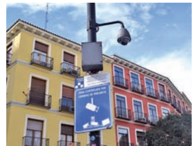
Uno de los dispositivos instalados en la capital

Por último, la vicealcaldesa avanza que el Gobierno municipal trabajará en la mejora de la iluminación de determinadas zonas para aumentar la sensación de seguridad en una ciudad "que de por sí ya es bastante segura".