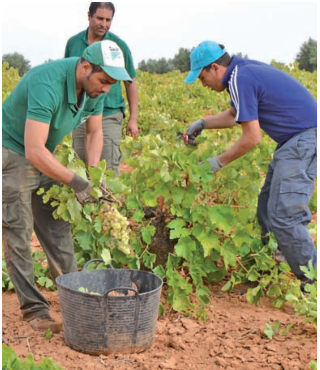
Vendimia en la Comunidad de Madrid GENTE

30% de la producción total”. En cuanto al mercado nacional, la prioridad es estar presente en todas las grandes superficies de distribución y en tratar de que los hosteleros incluyan cada vez más en sus respectivas cartas algunos de los caldos que se cultivan, fermentan y embotellan en la región.