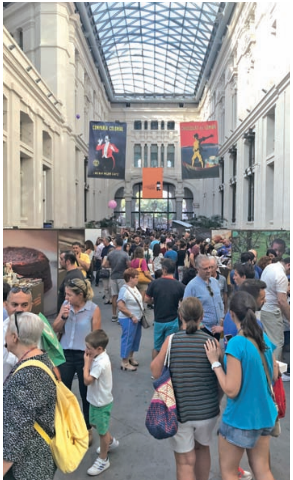
Ambiente en el Salón Internacional del Chocolate 'CHOCOMAD'

'CHOCOMAD', que se celebrará del 20 al 22 de septiembre en el Palacio de Cibeles, tendrá, por otro lado, un carácter aún más internacional pues, además de las marcas locales, se