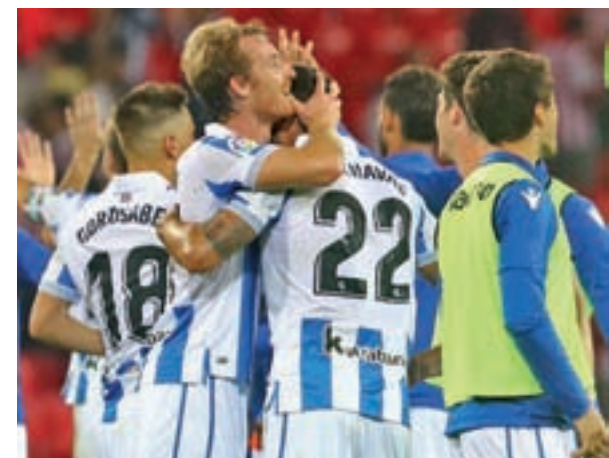
La Real Sociedad de Imanol espera al Atlético

Por su parte, el Real Madrid recibirá al Levante (13 horas), en un partido