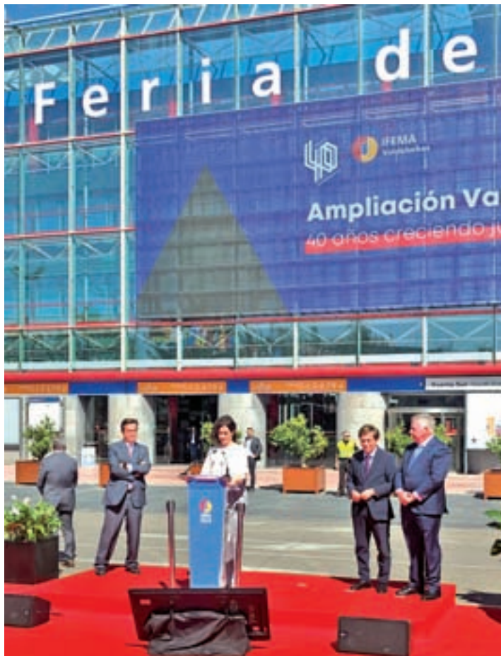
Un momento de la presentación de la ampliación

Feria de Madrid, Ifema, invertirá hasta 2023 un total de