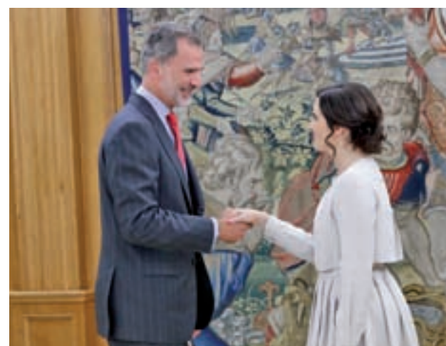
Felipe VI e Isabel Díaz Ayuso

“Sobre todo le he trasladado las líneas generales de mi proyecto político, donde tenemos un firme compromiso con la unidad y la igualdad de todos los españoles”, desveló Díaz Ayuso, al tiempo que