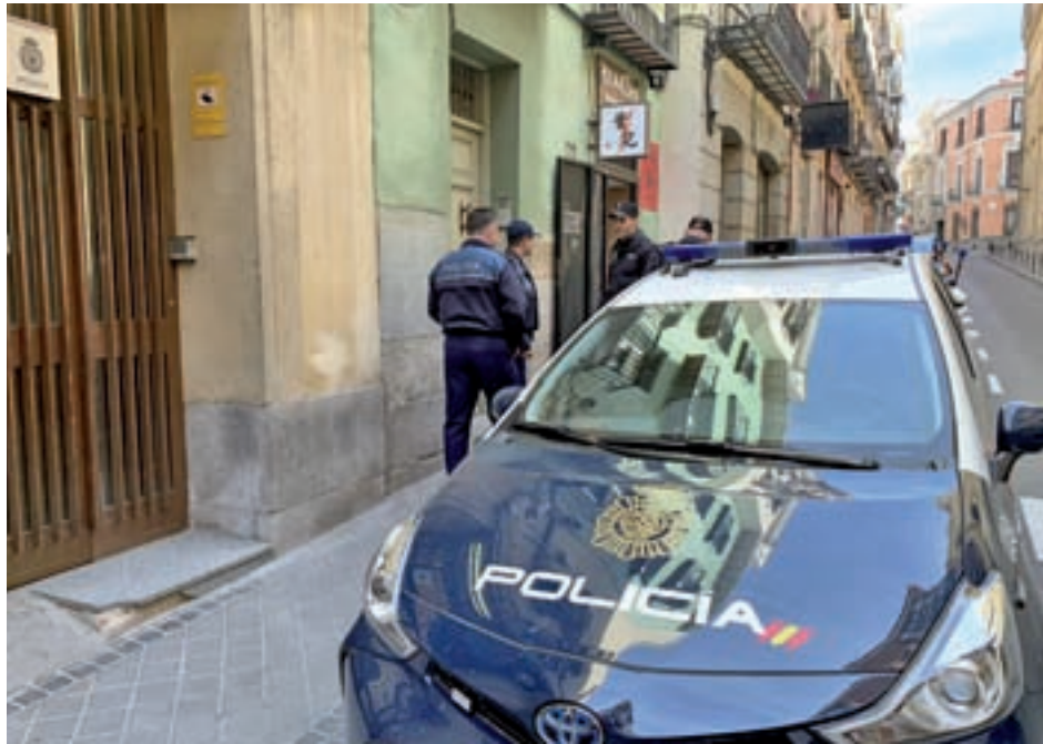
Agentes patrullan por las calles de la capital

Por tipología, el delito que creció de manera exponencial fue el de secuestro, al pasar de ningún caso en el mismo periodo del año pasado a 5 hasta junio de 2019 (un 100% más). El segundo repunte más importante correspondió al del tráfico de drogas. Los agentes abrieron un total de 877 actas por tenencia de estupefacientes por las 681 de un año antes, lo que supone un crecimiento del 28,8%. Detrás se situó la evolución de los delitos graves, menos graves de lesiones y riña tumul-