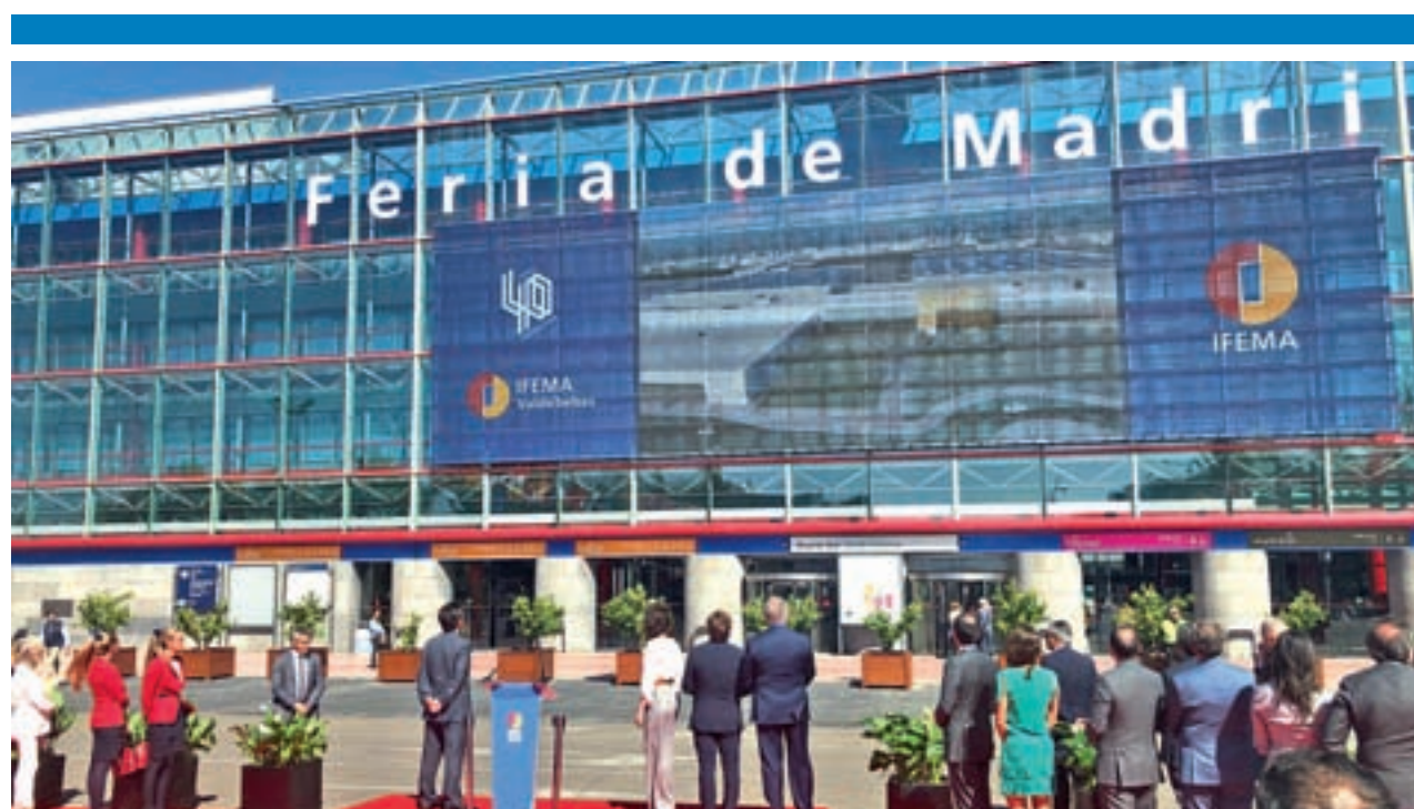
LUCA HERNÁNDEZ/ GENTE