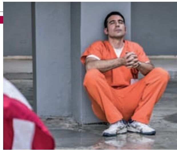
Miguel Ángel Silvestre se mete en la piel de Pablo Ibar

En el primer grupo, Televisión Española estrenó esta semana 'Malaka', un thriller ambientado en la Costa del Sol que cuenta con Salva Reina y Maggie Civantos como protagonistas. Antena 3 lanzará en los próximos días 'Toy boy', que refleja el mundo de la noche con Cristina Castaño y Jesús Mosquera en su reparto. Movistar+