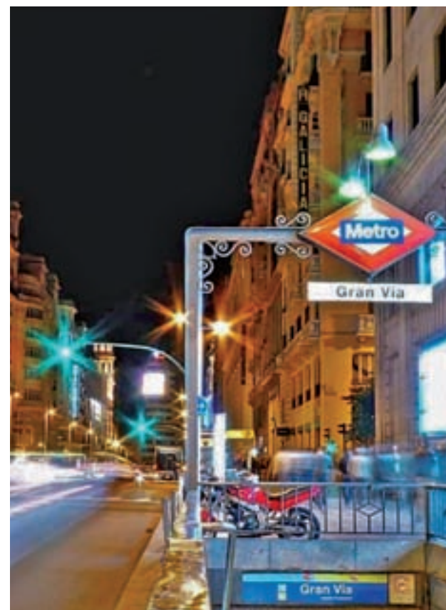
Metro abrirá los fines de semana