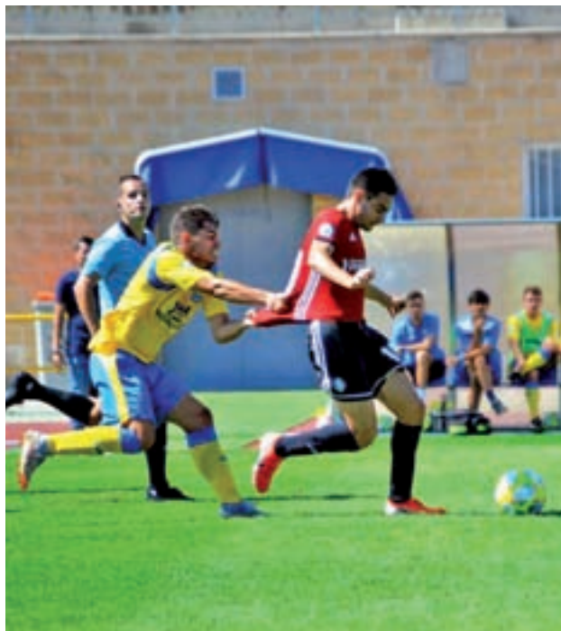
El Pinto se llevó los tres puntos de Fuencarral

Aunque tres jornadas no parece tiempo suficiente para sacar conclusiones, lo cierto es que el arranque de temporada del Unión Adarve y