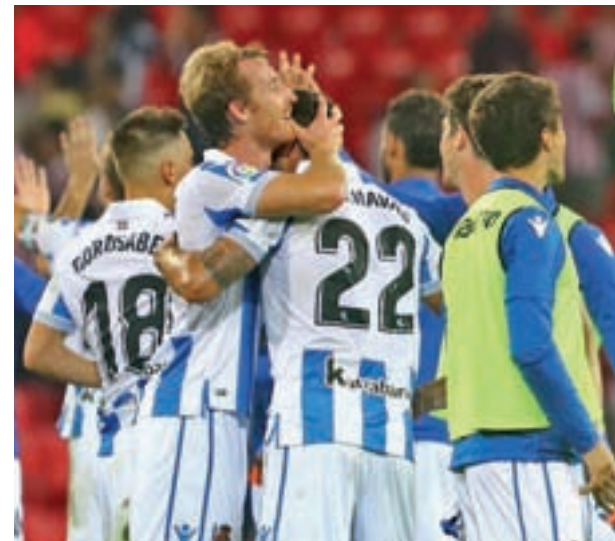
La Real Sociedad de Imanol espera al Atlético

Uno de los grandes aliados puede ser el debut en partido oficial del belga Eden Hazard, tras superar una lesión.