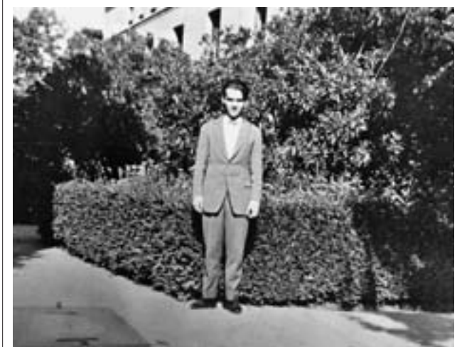
Una de las fotografías de la muestra

Según fuentes municipales, la tres carreras programadas, domingo y lunes con dos matinales y una nocturna, se desarrollaron con normalidad y no se registraron heridos de consideración, como tampoco hubo cuestiones graves durante el fin de semana en el recinto ferial, donde actuaron grupos y artistas como Demarco y Los Rebujiitos. Las fiestas concluyeron el martes con la tradicional romería en la explanada de la ermita.