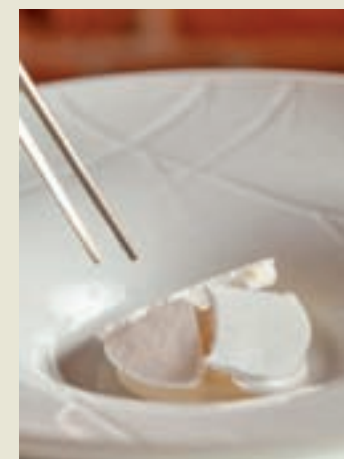
Merengue a la double crème