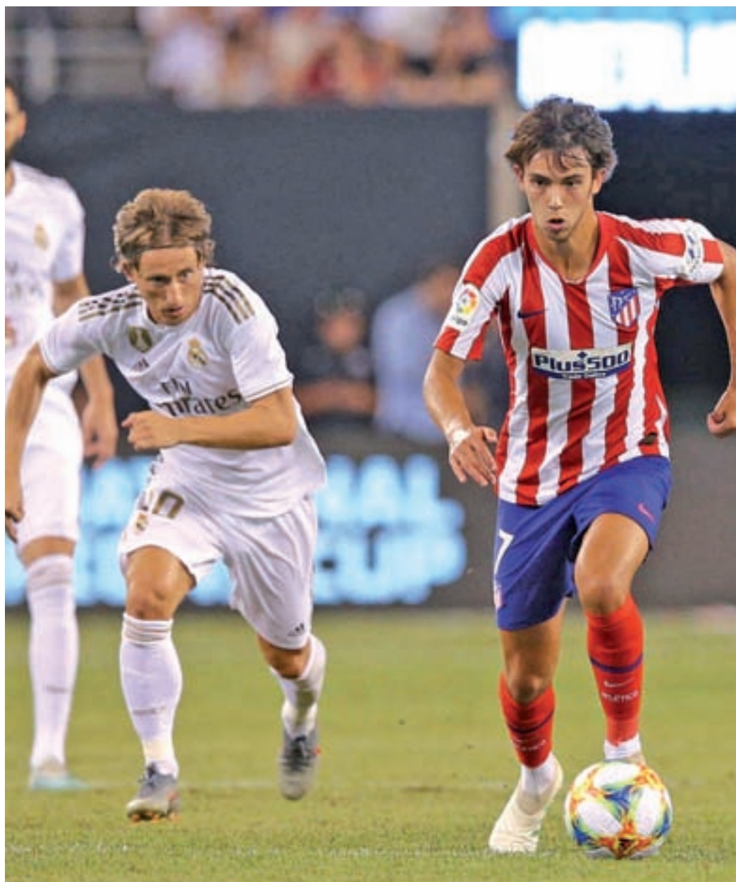
Joao Félix, en el derbi de pretemporada que se saldó con un 3-7 para el Atlético

cial rechazo por su pasado en el Real Madrid. Otros dos viejos conocidos, el Lokomotiv de Moscú y el Bayer Leverkusen, completan un grupo en el que los rojiblancos están llamados a pelear por la primera plaza, aunque los partidos como visitante revestirán cierto peligro.