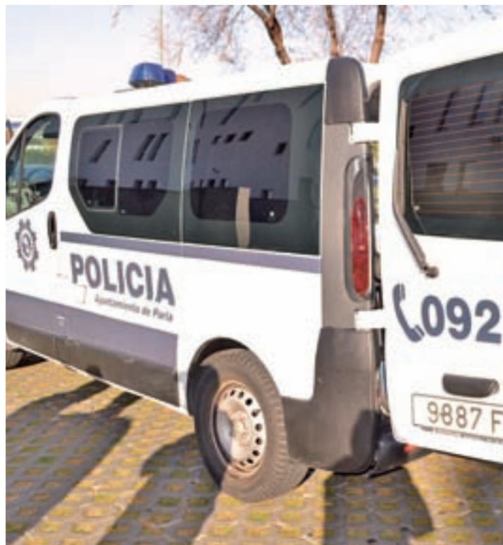
Policía Local de Parla

En cuanto a la tipología de los delitos, en Parla destacó el descenso que se produjo en los robos con fuerza realizados en domicilios o establecimientos, que pasaron de 130 a 109 (-16,2%). En la parte negativa hay que resaltar la subida en los robos con violencia e intimidación (de 191 a 199 casos), del tráfico de drogas (de 2 a 6) y, sobre todo, de la sustracción de vehículos (de 47 a 90 episodios). En cuanto a las cuestiones referentes a la libertad sexual, subieron un 6,7% el total de incidentes (de 15 a 16) y un 100% las violaciones (dos casos, por ninguno en 2018).