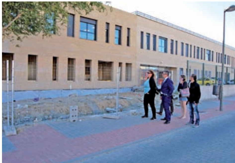
El alcalde visitó el edificio en obras

"Vamos a ver de quién es la responsabilidad de haber autorizado el inicio del curso en estas clases, porque creemos que no es suficientemente seguro", añadió el regidor, que recordó que "el compromiso de la Comunidad de Madrid era terminar el edifi-