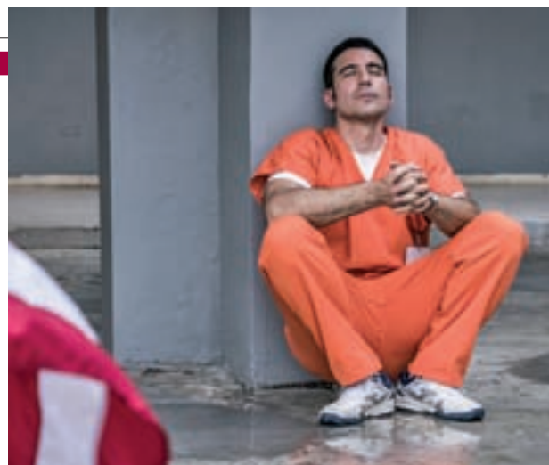
Miguel Ángel Silvestre se mete en la piel de Pablo Ibar

En el primer grupo, Televisión Española estrenó esta semana 'Malaka', un thriller ambientado en la Costa del Sol que cuenta con Salva Reina y Maggie Civantos como protagonistas. Antena 3 lanzará en los próximos días 'Toy boy', que refleja el mundo de la noche con Cristina Castaño y Jesús Mosquera en su reparto. Movistar+