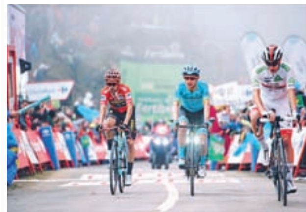
Roglic ha dominado la vuelta durante varias jornadas

Media hora antes, a las 11:30, Los Prados será el escenario en el que la AD Parla busque su primer triunfo del año. Enfrente tendrá al Unión Adarve, un rival complicado que el curso pasado militaba en Segunda B, pero que llega con dudas después de un inicio en que solo ha sumado 4 puntos de 9. La semana pasada empató en casa ante un recién ascendido como la Escuela de Moratalaz. Los parleños, por su parte, perdieron por 3-0 en Carabanchel y son decimotavos con solo 2 puntos.