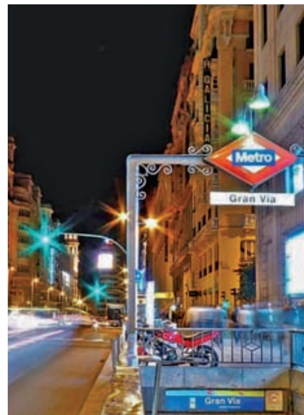
Metro abrirá los fines de semana

Aguado también se refirió a la posible ampliación de algunas de las líneas de Metro