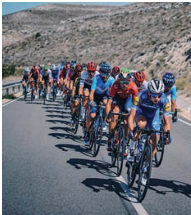
El pelotón afronta sus últimos kilómetros

La ronda nacional despide otra edición este domingo 15 de septiembre, después de tres semanas de competición y 21 etapas. La última jornada,