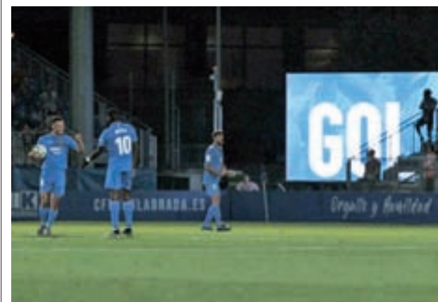
El 'Fuenla' salvó un punto con la Ponferradina

Esta será la tercera ocasión en la que la Vuelta tenga una jornada con origen en Fuenlabrada, tras sendas etapas en 1992 y 1994.