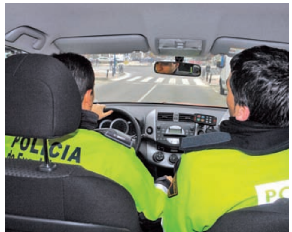
Policía Local de Fuenlabrada GENTE

Por otro lado, los delitos graves y menos graves de le-