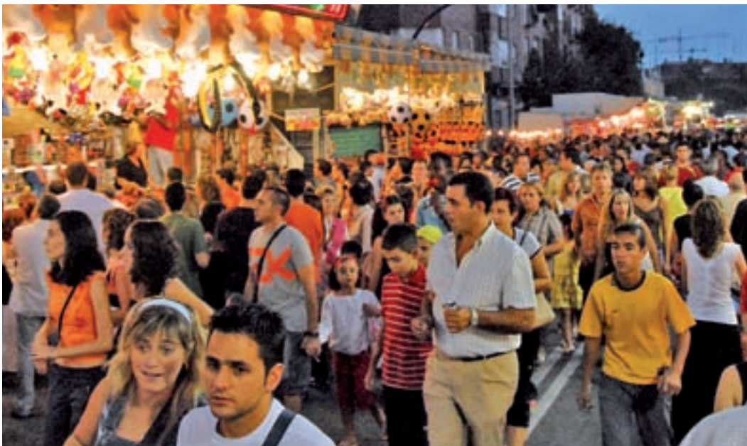
Ambiente durante las fiestas GENTE