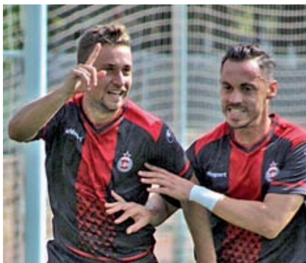
Maganto es uno de los jugadores clave del Adarve

Poco a poco, y a base de trabajo, los dos equipos del Norte de la capital que compiten en el Grupo VII de Tercera División van encontrando el estado de forma óptimo para alcanzar sus objetivos. Sin ir más lejos, la pasada jornada tanto el Santa Ana como el