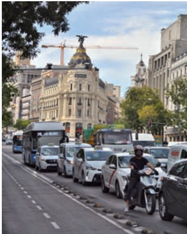
La calle de Alcalá

Funcionará teniendo en cuenta cinco anillos. El primero comprenderá el entorno de Sol, el segundo el distrito Centro, el interior de la M-30 el tercero, un cuarto sobre la M-40, y el último concierne al resto de Madrid. El objetivo, será llevar a cabo una "limitación progresiva" de la