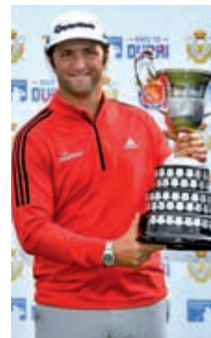
Rahm, campeón en 2018

Este torneo se disputó el año pasado en el Centro Nacional de Golf, con victoria del golfista español Jon Rahm y con una asistencia que rozó los 50.000 espectadores durante los cuatro días que duró el torneo. Este éxito de pú-