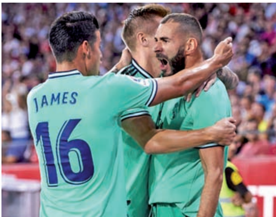
Los blancos dejaron una gran imagen en el Sánchez Pizjuán de Sevilla