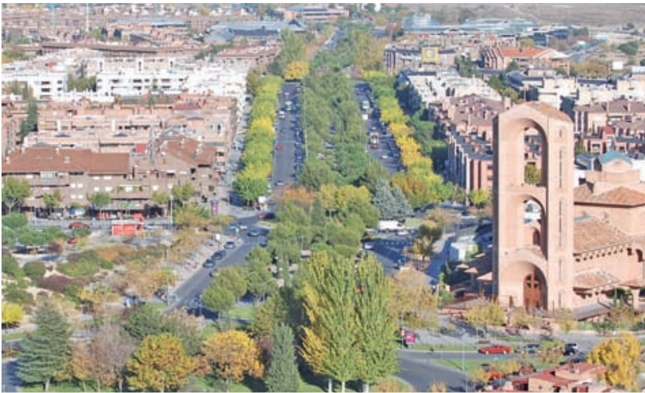
Imagen aérea de Pozuelo de Alarcón