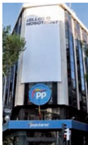
Pancarta del PP

"Con esta pregunta, el PP inicia durante esta semana una serie de reflexiones que dan respuesta al desbloqueo de la situación de nuestro