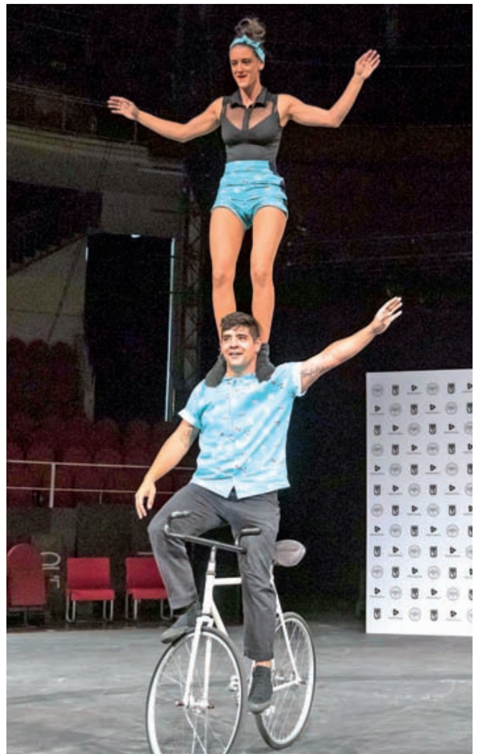
El número de bicicleta acrobática de la compañía Alta Gama se podrá ver en FIRCO

EL PROGRAMA ARRANCA ESTE FIN DE SEMANA CON 'LE VIDE-ESSAI DE CIRQUE'