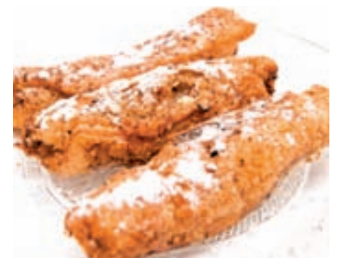
Casadielles, una masa de hojaldre frita