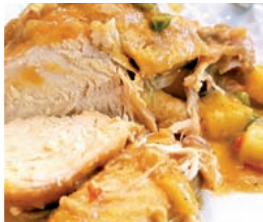
Pollo de callejuela, criado sin pienso