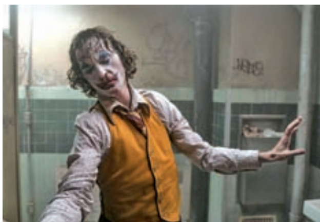
La interpretación de Phoenix ha recibido múltiples elogios