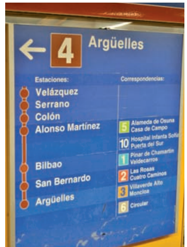
La Línea 4 se cerrará ocho semanas

Los trabajos que se van a llevar a cabo son para completar la instalación de catenaria rígida en toda la Línea 4. Este sistema de transmisión de la electricidad a los trenes se caracteriza por su mayor fiabilidad y disponibilidad y por una menor necesidad de