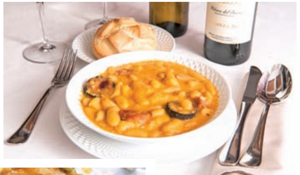
Fabada al estilo campero

Tras los entrantes y a fin de seguir descubriendo los manjares de Asturias, Filloa ha incluido pollo de callejuela, criado sin pienso, a base de lombrices, maíz y semillas. Igualmente relevante es el cachopo de cecina de León rematado con queso de cabrales. Como colofón, los postres nos devuelven los dulces aromas y sabores del campo. Entre ellos sobresalen los casadielles, una masa de hojaldre frita, y el arroz con leche a la asturiana.