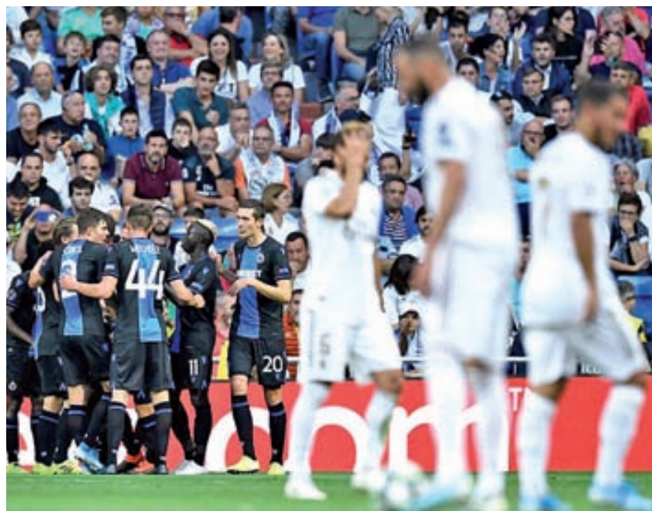
El Brujas se quedó muy cerca de llevarse los tres puntos del Bernabéu