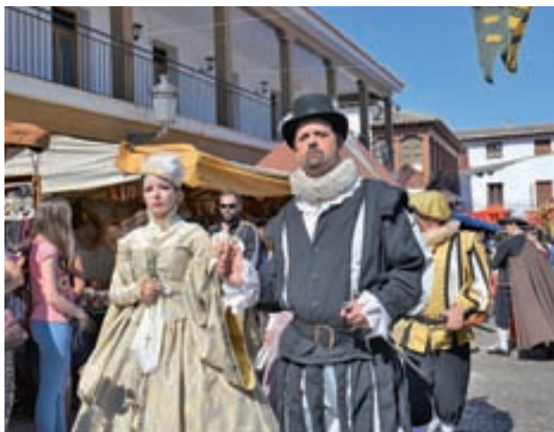
Pasada edición de la Feria Barroca