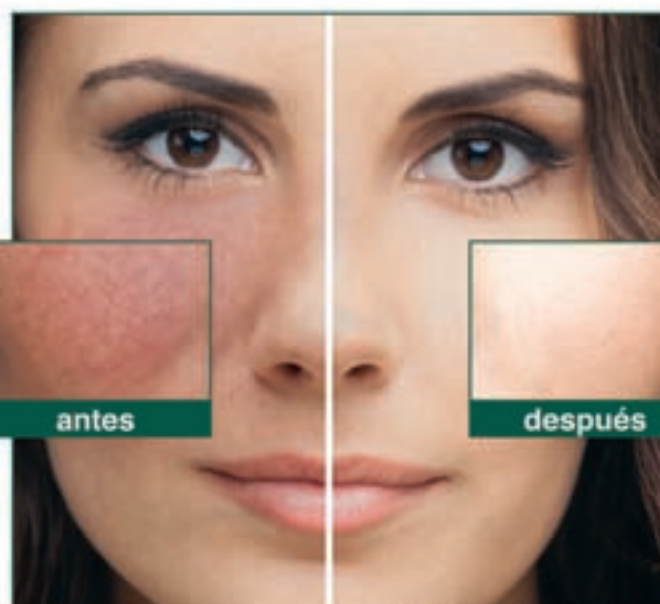
(La imagen representa a una afectada)