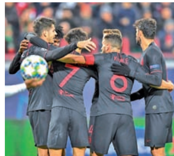
El Atlético sumó tres puntos en Moscú en Champions

A pesar de esos problemas a la hora de ver puerta, el Atlético se mueve por la zona alta de la tabla, entre otras cosas, gracias a que mantiene intacta una de sus señas de identidad, la solidez defensiva. Con sólo cuatro tantos en contra, Oblak está entre los porteros menos goleados del campeonato, aunque por el momento ese honor recae en el Athletic, que solo ha recibido tres goles.