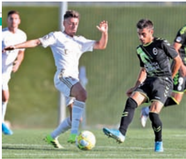
Derrota del Rayo Majadahonda en Valdebebas