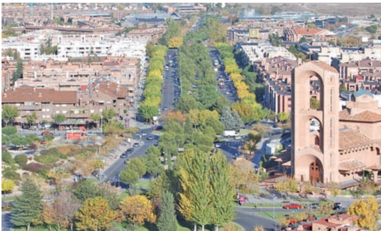
Imagen aérea de Pozuelo de Alarcón