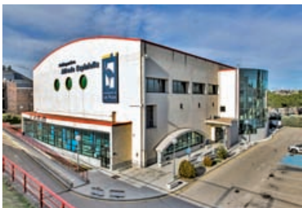
El polideportivo Alfredo Espiniella

juego característico aunque está teniendo problemas de cara a portería. Sin embargo está muy fuerte defensivamente, siendo el conjunto que menos goles encaja de la categoría. Esta semana se enfrenta el domingo 6 de octubre a las 12 horas al Peña Deportiva. Su rival va tercero en la clasificación y viene de empatar a dos en Melilla. Los roceños van octavos y vienen de ganar por uno gol a cero en casa a los asturianos del Marino de Luanco.