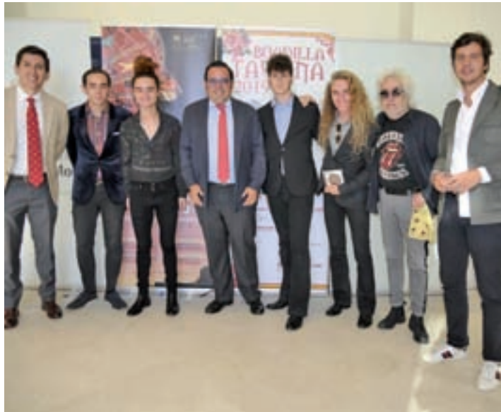
La presentación del programa BOADILLA DEL MONTE

Como cada año, los vecinos podrán disfrutar de múltiples actividades, entre las que destacan los encierros, la suelta de reses y los conciertos. También habrá una oferta específica para jóvenes y niños, además de los tradicionales eventos populares. El inicio oficial de los fes-