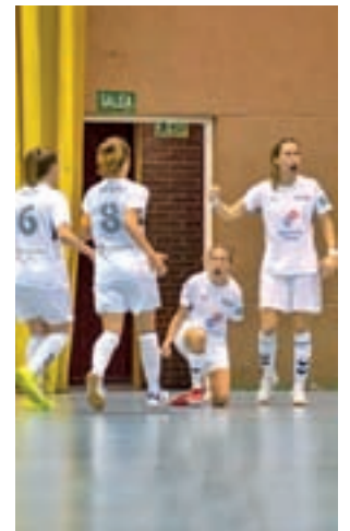
Empatadas a puntos

También a un rival con los mismos puntos, cinco, se mide el Ciudad de Móstoles. En su caso el equipo mascu-