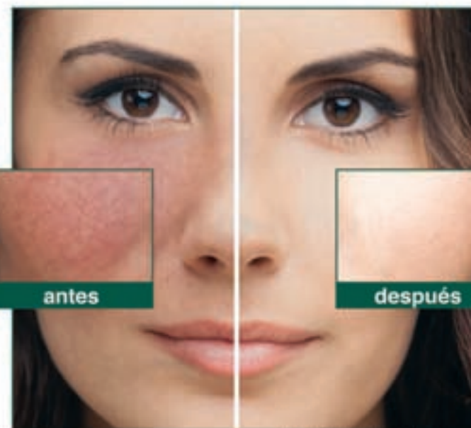
(La imagen representa a una afectada)

Dr. Müller: Muchos factores pueden ser responsables de estos, como la predisposición a tener rojeces, el estrés o un estilo de vida poco saludable. Aunque también el exceso de sol y su radiación UV favorecen el enrojecimiento facial,