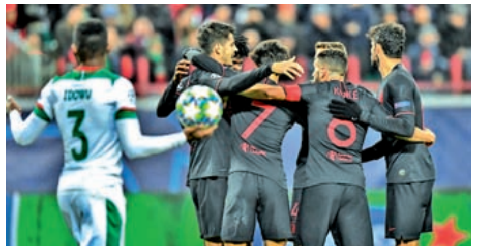
El Atlético sumó tres puntos en Moscú en Champions