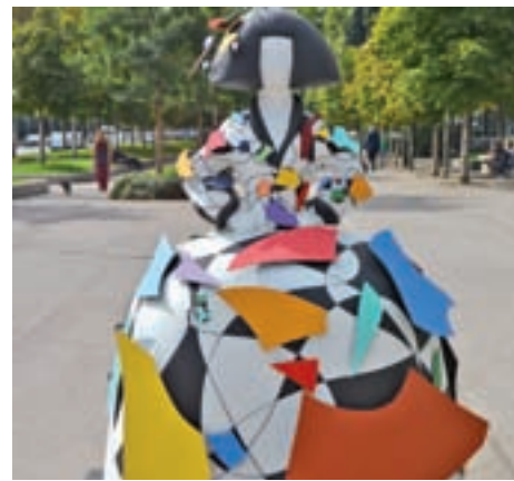
Tienen fines benéficos

Madrid acoge la segunda edición de 'Meninas Madrid Gallery' • La exposición al aire libre, formada por 54 figuras ideadas por diferentes artistas o personas anónimas, podrá verse durante los meses de octubre y noviembre