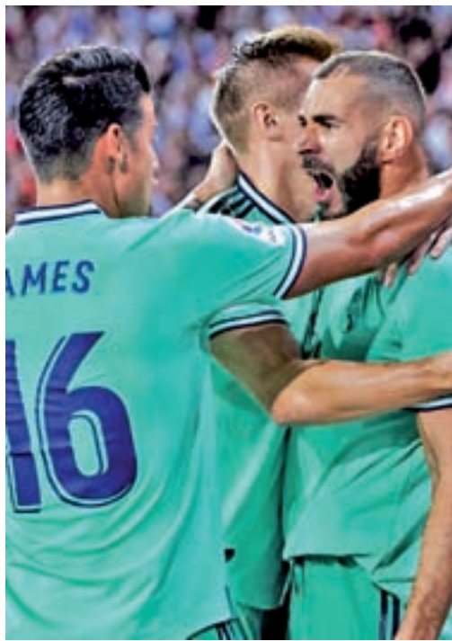
Los blancos dejaron una gran imagen en Sevilla

Por otro lado, esa igualdad también responde a la irregularidad de los favoritos. Por ejemplo, el Barcelona tie-