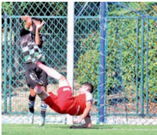
Ganas de revancha CD MÓSTOLES

El Móstoles afronta ante el Trival Valderas uno de esos encuentros que los equipos marcan en rojo cuando se conoce el calendario de la temporada, en este caso por las cuentas pendientes derivadas del último cruce entre ambos conjuntos.