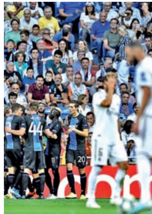
El Brujas sacó un empate del Bernabéu

EL LIDERATO LIGUERO ES EL CONTRAPUNTO A UN ERRÁTICO RUMBO EUROPEO