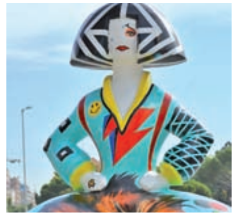
Estarán hasta noviembre