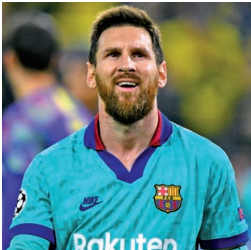
Las ausencias de Messi por lesión coincidieron con los pinchazos del Barça