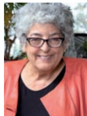
Joanne Chory y Sandra Myrna Díaz > Investigación Científica y Técnica