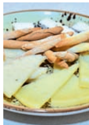
Queso de Miraflores