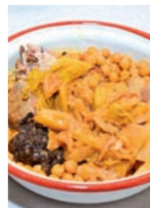
Garbanzos de Daganzo