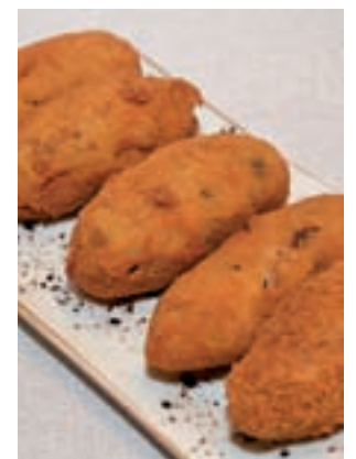
Croquetas de pringá