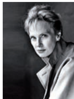
Siri Hustvedt > Letras