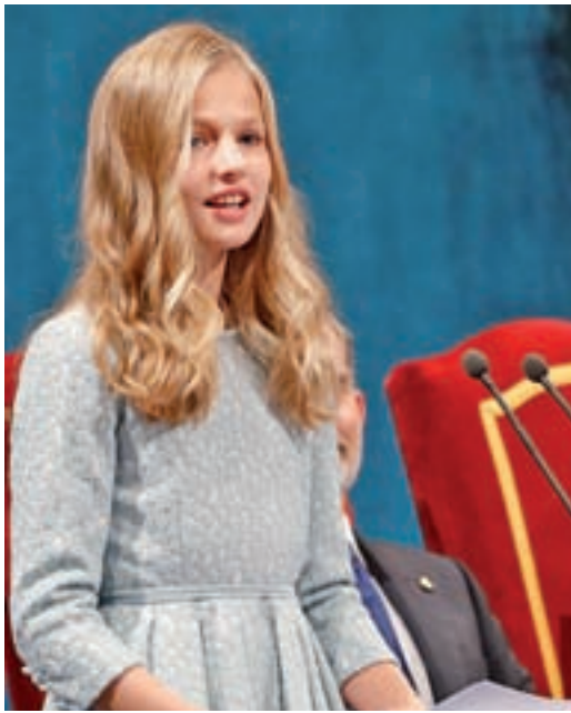
Leonor de Borbón durante su discurso