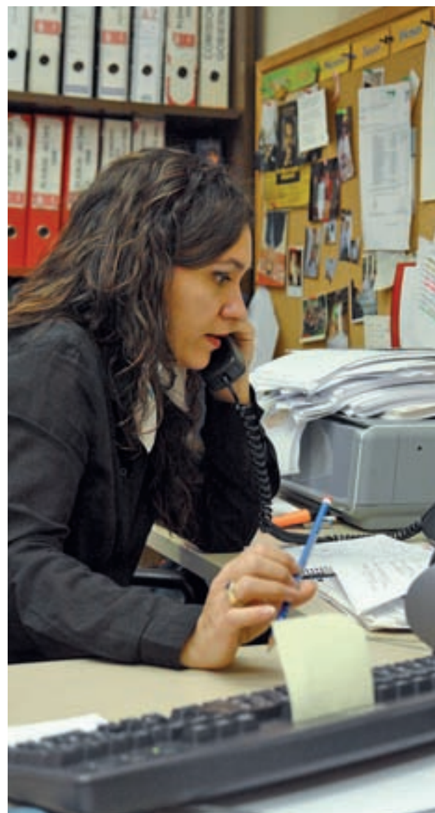
Los trabajadores de Madrid son de los que más cobran GENTE

De diferencia En los sueldos de las grandes y pequeñas empresas