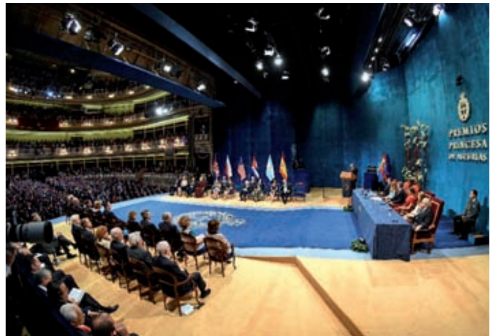
Imagen de la gala

E l Teatro Campoamor de Oviedo acogió el pasado viernes 18 de octubre la entrega de los Premios Princesa de Asturias 2019. Una ceremonia que cobró especial relevancia al acoger el primer discurso institucional de la Princesa de Asturias. Leonor de Borbón, emocionada pero serena, y arropada por su familia, agradeció en su discurso su trabajo a la Fundación Princesa de Asturias y felicitó a los distintos premiados.