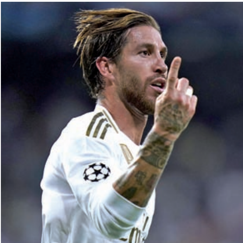
Sergio Ramos, uno de los habituales en el once de Zidane