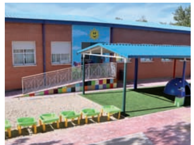
Se renovarán los areneros y se repararán juegos infantiles

"Todo, con el principal objetivo de ofrecer la máxima seguridad a los niños y que los centros en los que estudian estén en las condiciones óptimas", indicó Ortega quien recordó el importante esfuerzo que suponen para el Consistorio estos trabajos en una ciudad que es la que mayor población escolar tiene.