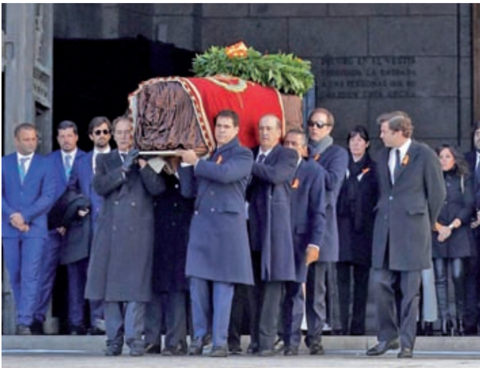
El féretro salió a hombros de los descendientes de Franco