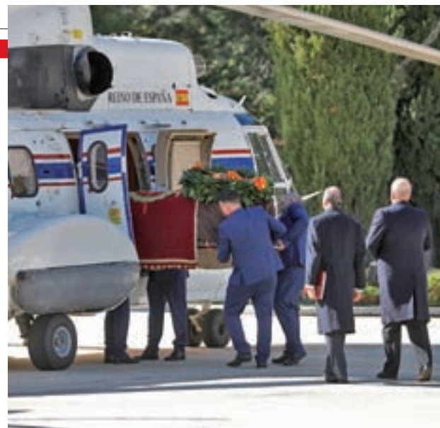
El traslado se realizó en un helicóptero