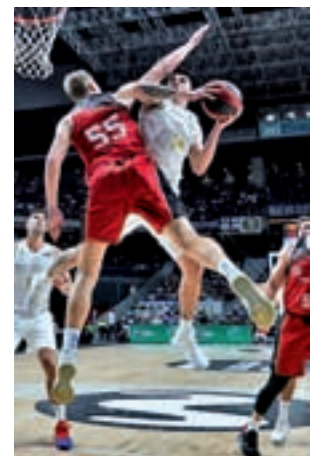
Repletos de confianza

La prueba, eso sí, será muy dura pues el contrario tiene un balance positivo de tres victorias y dos derrotas en lo que va de curso además de mostrarse hasta el momen-