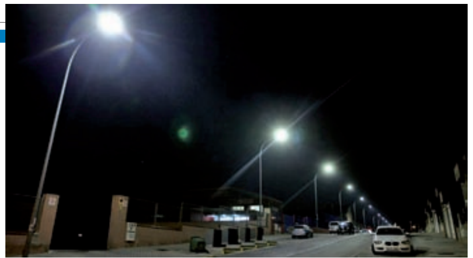
Alumbrado con tecnología led

Recientemente, además, el Pleno de Fuenlabrada ha aprobado una serie de compromisos para hacer frente al estado de emergencia climática. Entre las medidas destaca la reducción de los gases de efecto invernadero o la apuesta por la energía renovable.