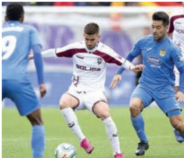
A reencontrarse con las buenas sensaciones LALIGA

El Fuenlabrada visita a la UD Las Palmas (sábado, 18) con el objetivo de lograr una victoria que le permita seguir en los puestos de honor de la tabla clasificatoria y al mismo tiempo reponerse anímicamente del primer tropiezo como local de su historia en