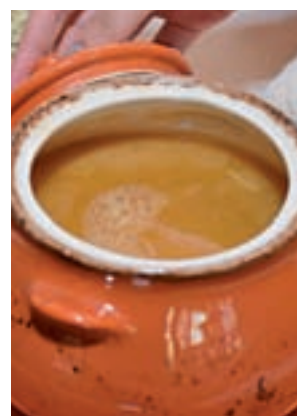
Sopa de cocido