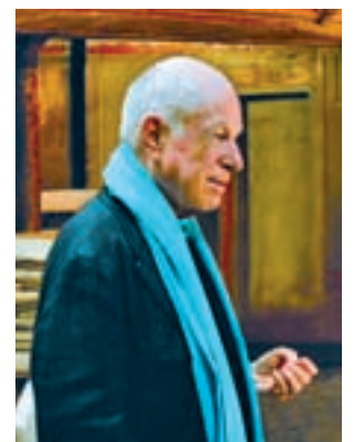
Peter Brook > Artes