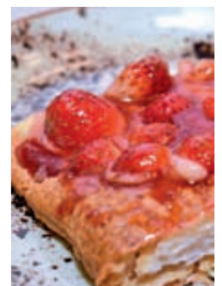
Tarta con fresas de Sanse