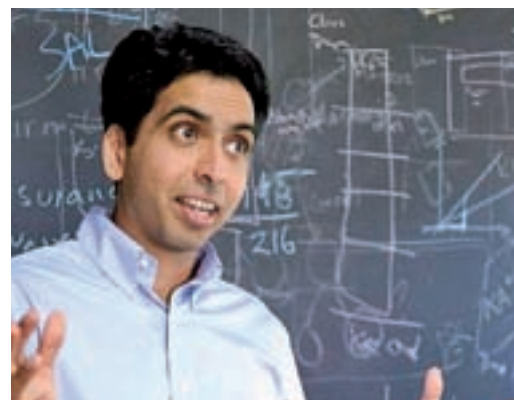
Salman Khan y la Khan Academy > Premio Cooperación Internacional

La Fundación Princesa de Asturias premió, en la categoría de Concordia, a la ciudad polaca de Gdansk por su impluso de las políticas sociales desarrolladas por su alcalde, Pawel Adamowicz, en las dos últimas décadas, hasta su apuñalamiento y posterior fallecimiento en un acto en enero.