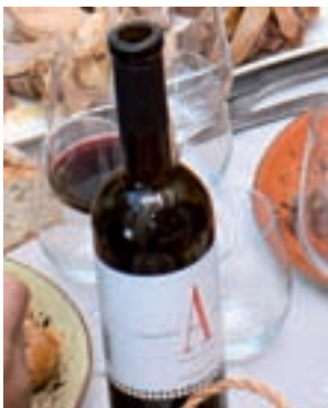
Vino: Se sirvieron caldos de Bodegas Laguna (Villaconejos): el tinto, Alma crianza 2016, y, el blanco, Alma de Valdeguerra