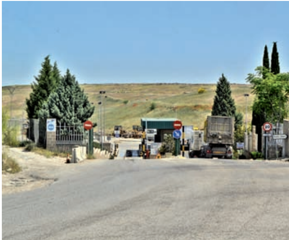
Vertedero de Pinto