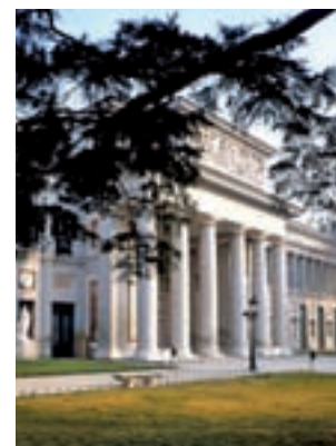
Museo Nacional del Prado > Comunicación y Humanidades