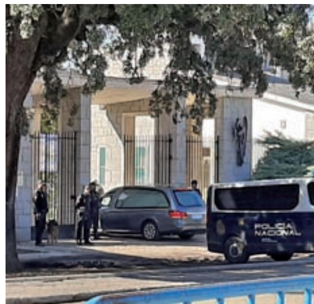
El último acto tuvo lugar en Mingorrubio

junto a su abogado como representante de la familia. El resto de la comitiva se desplazó en coche.