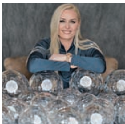
Lindsey Vonn > Deportes