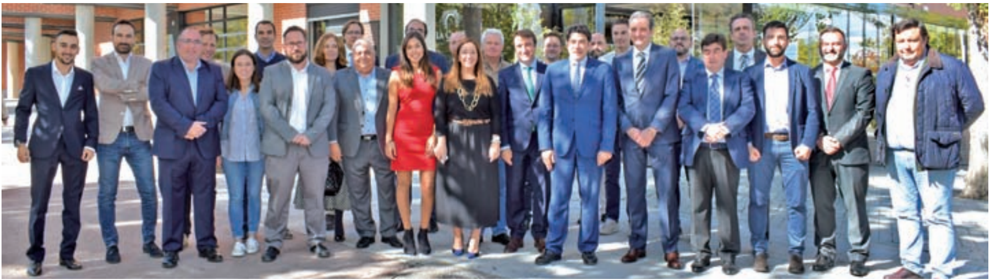
El consejero de Vivienda de la Comunidad, los alcaldes de la zona Norte, agricultores, equipo de La Clave y responsables de GENTE