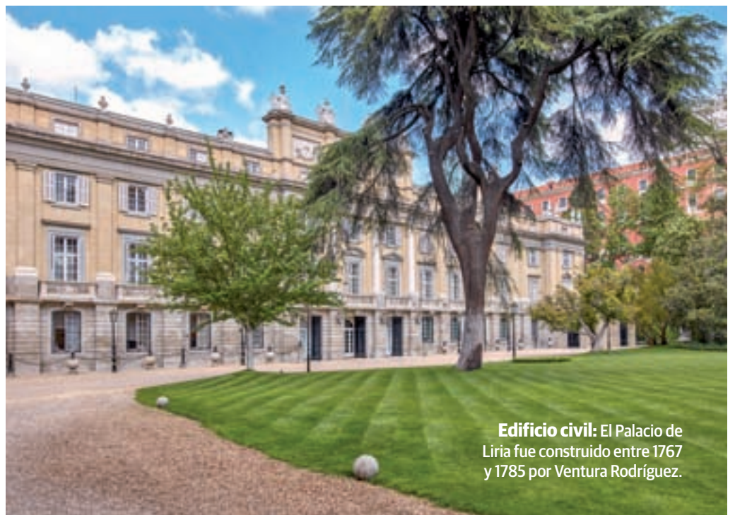
Edificio civil: El Palacio de Liria fue construido entre 1767 y 1785 por Ventura Rodríguez.

Los tesoros artísticos e históricos que alberga Liria son obra de la labor de mecenazgo y coleccionismo de este gran linaje. El origen de la colección responde así a los refinados gustos y aficiones culturales de sus habitantes, quienes buscaron pinturas, esculturas, tapices, muebles y grabados, además de un amplio conjunto de porcelanas para decorar sus residencias. De entre las obras expuestas destacan el Retrato del Gran Duque de Alba pintado por Tiziano o el de La Duquesa Cayetana de Alba con vestido