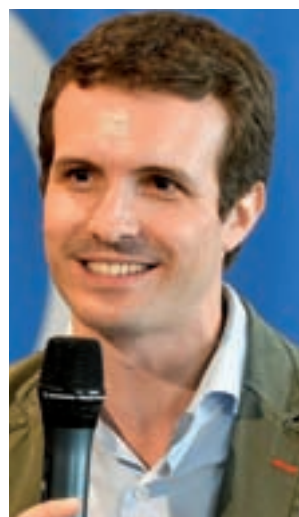
Pablo Casado (PP)