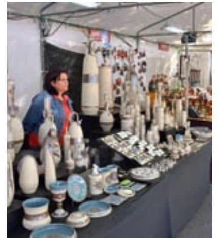
'Feria Artesanía Es Más Otoño'