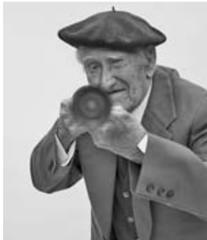
'LOS ÚLTIMOS' en el Instituto Francés