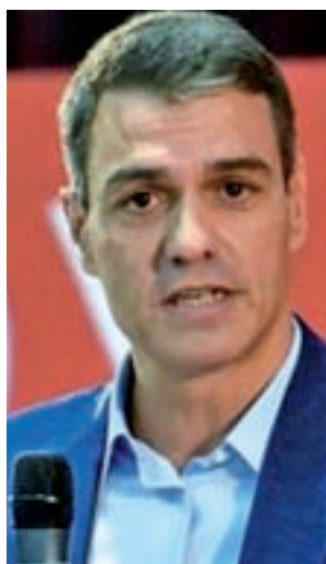
Pedro Sánchez (PSOE)

La actual situación catalana es una de las cuestiones que más