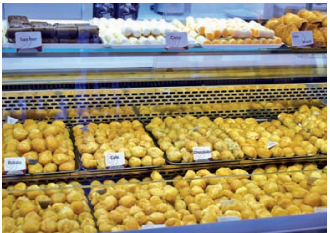
La oferta de estos productos cada vez es más amplia

DE LA CIFRA TOTAL PREVISTA DE VENTAS, MÁS DE LA MITAD SERÁN BUÑUELOS