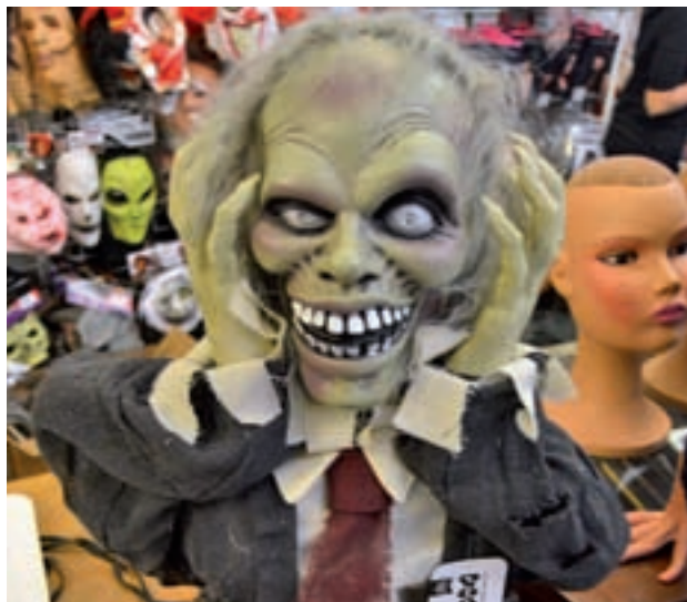
Los esqueletos son un clásico