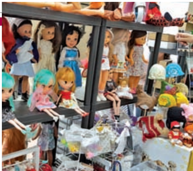
'Mercado del Juguete de Madrid'

su parte, la Casa Museo Lope de Vega presenta un figurín inspirado en 'El Caballero de Olmedo' ideado por el actor José Luis López Vázquez. Por otro lado, los amantes de las compras podrán deleitarse en la 'Feria Artesanía Es Más Otoño', en el Paseo de Recoletos, o en el 'Mercado del Juguete de Madrid' en el Centro Comercial La Ermita Para finalizar la jornada nada mejor que probar las delicias gastronómicas de 'Madrid Exquisito Nights'.