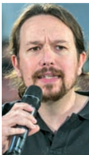
Pablo Iglesias (U. Podemos)

preocupa al cabeza de lista de Cs, Albert Rivera, además de que los catalanes puedan votar con “libertad”. La formación naranja, por otro lado, promete prohibir por ley las amnistías fiscales.