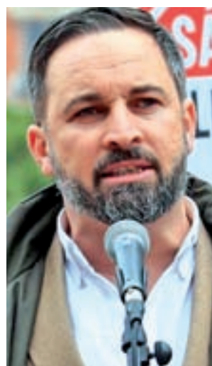
Santiago Abascal (Vox)

El secretario general de Podemos, Pablo Iglesias, defiende que el voto útil es el de Unidas Podemos porque con