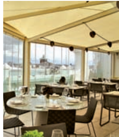
'Madrid Exquisito Nights'