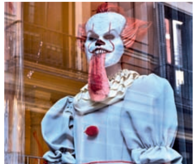
Pennywise, de 'It', también estará presente