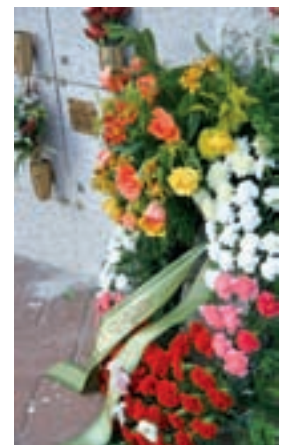
Flores en un cementerio

Lo más habitual es que los clientes utilicen