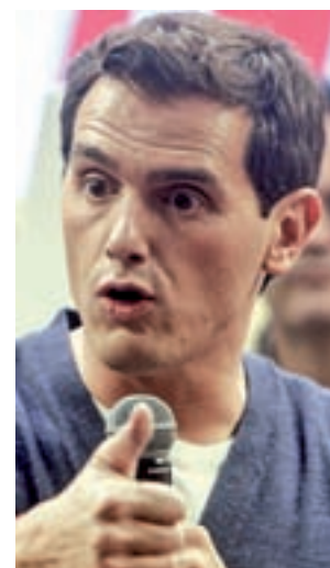
Albert Rivera (Ciudadanos)