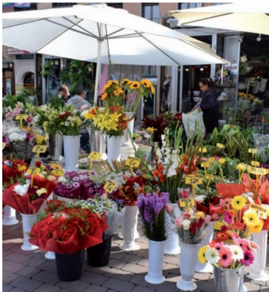
Floristerías en el centro de Madrid

Con respecto a las preferencias de los clientes a la hora de adquirir flores para estas fechas, desde Aefi aseguran que los clásicos como los crisantemos, los claveles, las rosas, el liliom y los gladiolos siguen siendo los más vendidos. No obstante, en los últimos tiempos se abren paso flores exóticas como el anthurium, la strelizia y la phalaenopsis.