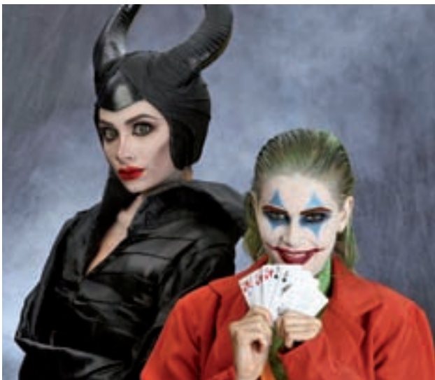
Maléfica y el Joker son tendencia