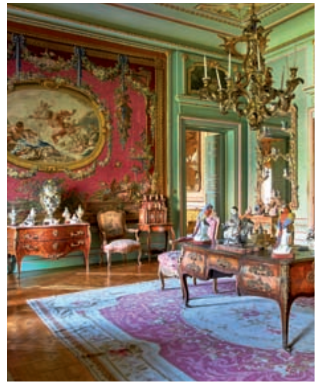
Salón Amor de los Dioses