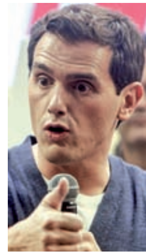
Albert Rivera (Ciudadanos)