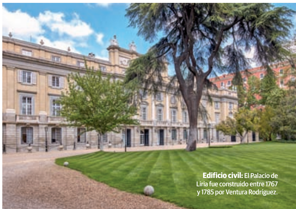
Edificio civil: El Palacio de Liria fue construido entre 1767 y 1785 por Ventura Rodríguez.

Los tesoros artísticos e históricos que alberga Liria son obra de la labor de mecenazgo y coleccionismo de este gran linaje. El origen de la colección responde así a los refinados gustos y aficiones culturales de sus habitantes, quienes buscaron pinturas, esculturas, tapices, muebles y grabados, además de un amplio conjunto de porcelanas para decorar sus residencias. De entre las obras expuestas destacan el Retrato del Gran Duque de Alba pintado por Tiziano o el de La Duquesa Cayetana de Alba con vestido