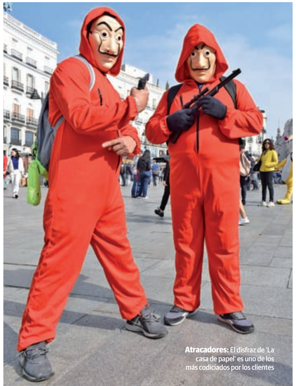
Atracadores: El disfraz de 'La casa de papel' es uno de los más codiciados por los clientes

Desde su céntrico local, situado muy cerca de la Puerta del Sol, una de sus empleadas, Sophie Vázquez, explica a GENTE que, un año más el gusto de los compradores se ha decantado por los grandes fenómenos audiovisuales de la temporada. "Lo más demandado son los disfraces de 'La casa de papel' y de 'Joker', hasta el punto de que hemos tenido que reponer existencias porque se agotaron en muy poco tiempo", señala, mientras añade que otros de los éxitos de 2019 son Maléfica, Pennywise, el payaso sali-