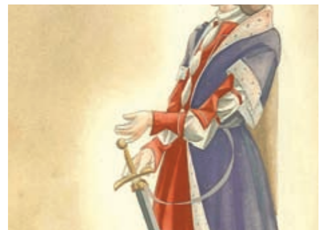
Figurín ideado por José Luis López Vázquez