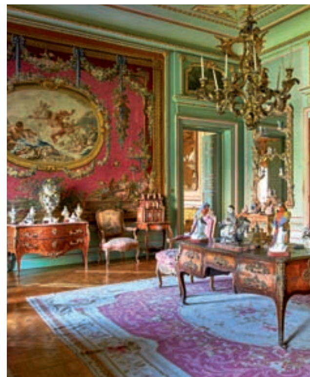
Salón Amor de los Dioses