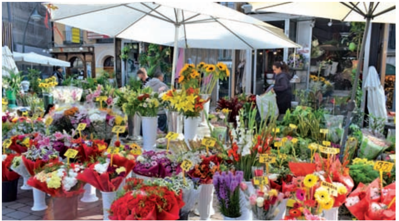
Floristerías en el centro de Madrid