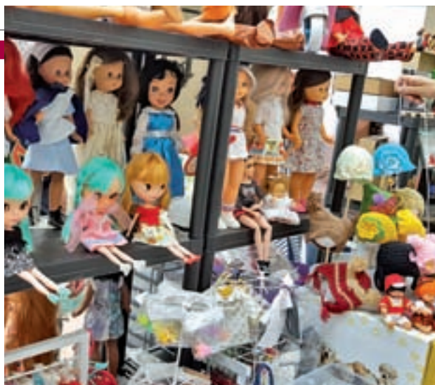
'Mercado del Juguete de Madrid'

su parte, la Casa Museo Lope de Vega presenta un figurín inspirado en 'El Caballero de Olmedo' ideado por el actor José Luis López Vázquez. Por otro lado, los amantes de las compras podrán deleitarse en la 'Feria Artesanía Es Más Otoño', en el Paseo de Recoletos, o en el 'Mercado del Juguete de Madrid' en el Centro Comercial La Ermita Para finalizar la jornada nada mejor que probar las delicias gastronómicas de 'Madrid Exquisito Nights'.