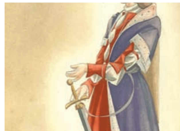
Figurín ideado por José Luis López Vázquez