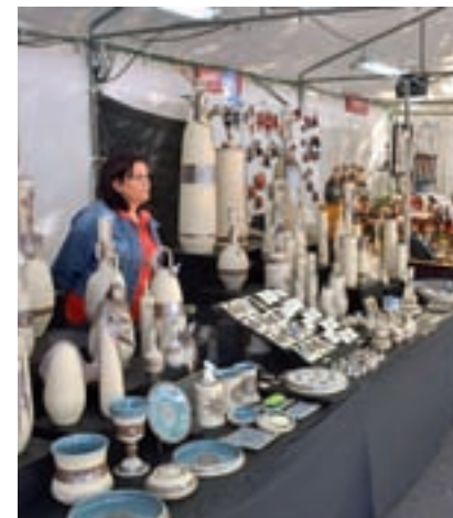
'Feria Artesanía Es Más Otoño'