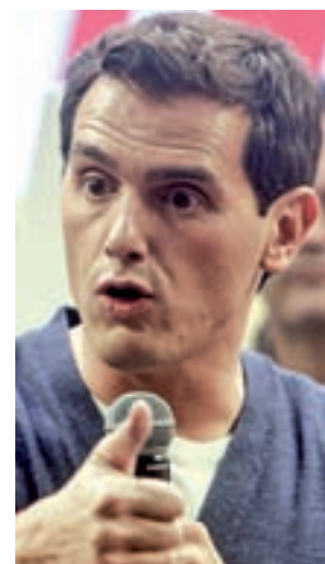
Albert Rivera (Ciudadanos)