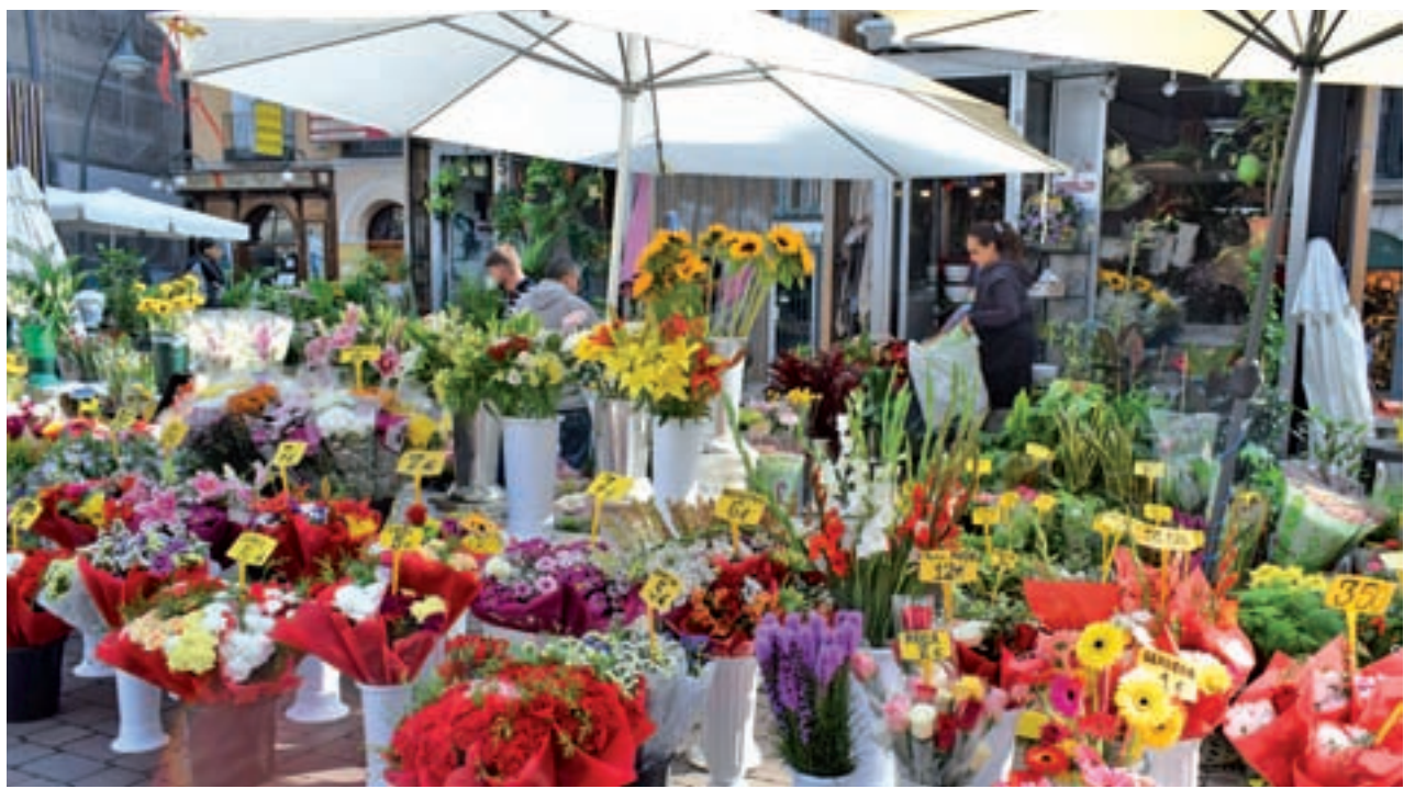
Floristerías en el centro de Madrid

A pesar de la cada vez mayor implantación de Halloween, para una gran parte de la población española la celebración de Todos los Santos sigue vinculada a la tradición de llevar flores a los seres queridos que ya no están. Esta costumbre, a pesar de la percepción general, se mantiene vigente en toda España, aunque según asegura la directora de la Asociación Española de Floristas (Aefi), Olga Zarzuela, “goza de mayor