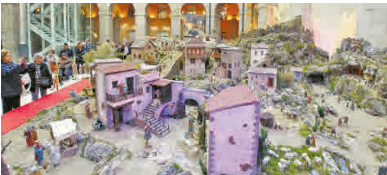
El Belén de la Real Casa de Correos