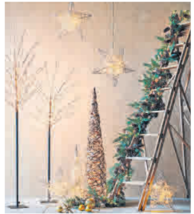
Lámparas con luces LED EL CORTE INGLÉS