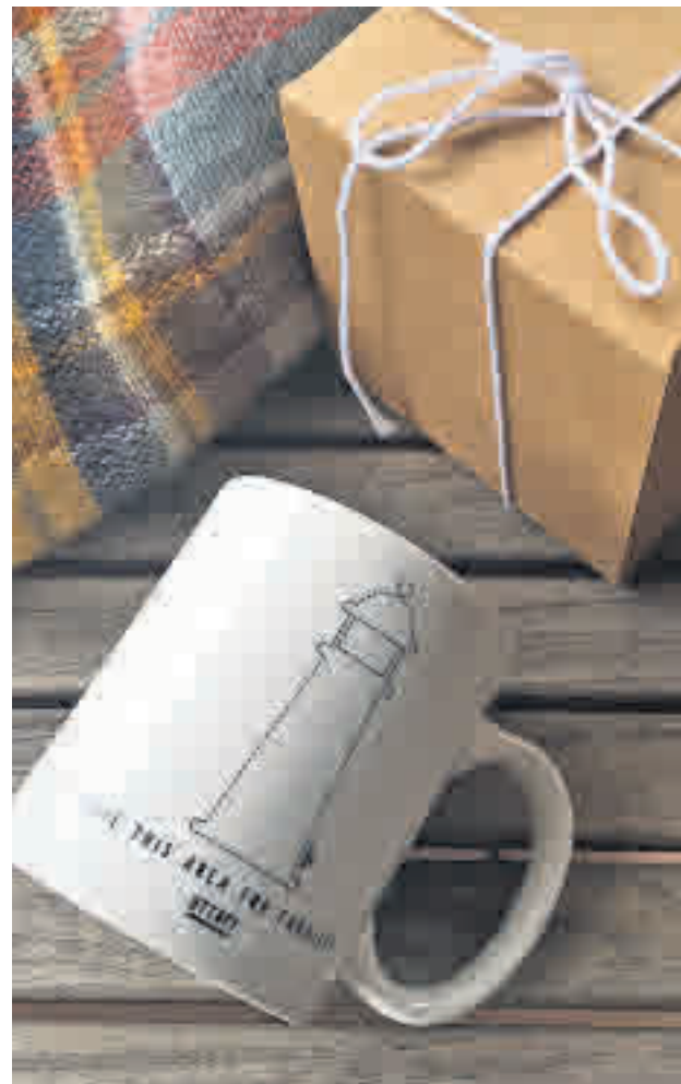
La firma Uttopy apuesta por los regalos solidarios

Otra corriente que se está implantando en otras compa-