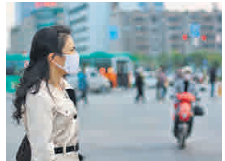
POR TIERRA, MAR Y AIRE: Los diferentes efectos del cambio climático se dejan notar en el calentamiento del mar, la desertificación de varias áreas y la contaminación atmosférica.