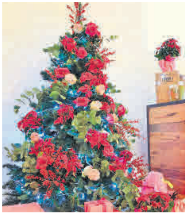
Árboles con flores encapsuladas MARÍA SALAZAR