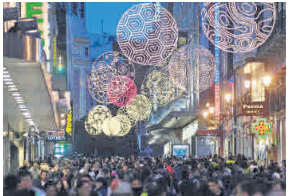
Las calles del Centro se inundan de personas en estos días

Las dificultades propias de estas fechas para transitar por el Centro se podrían incrementar por uno de los efectos colaterales que trae la COP25, como son las protestas que han convocado di-