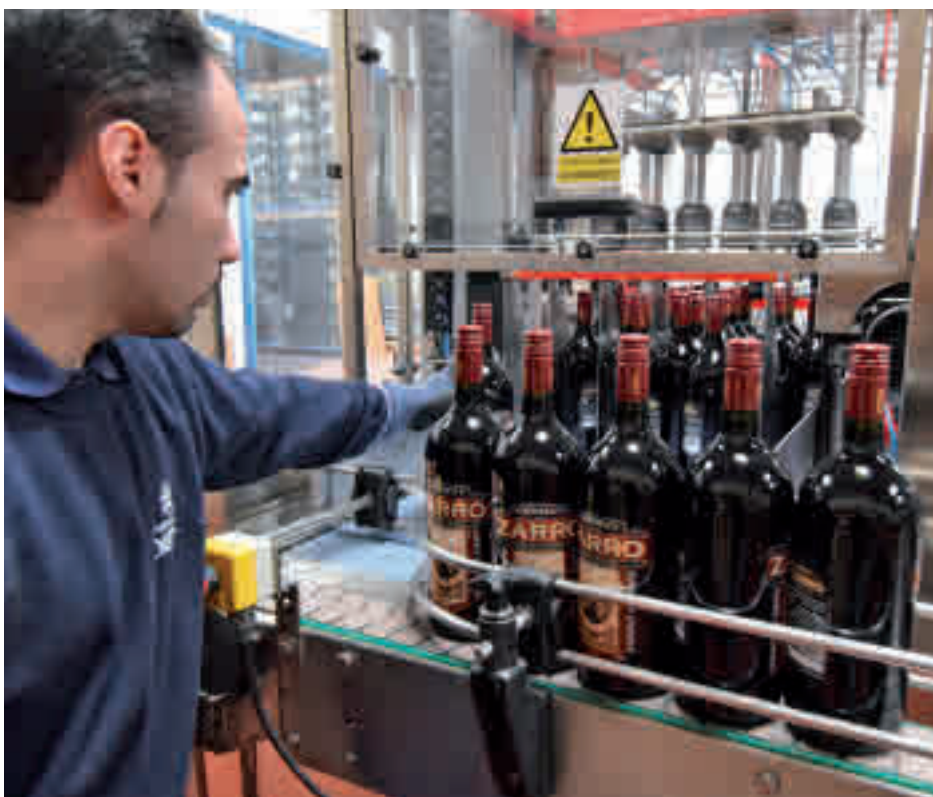
Un momento del proceso de embotellamiento

CONTENIDO ELABORADO EN COLABORACIÓN CON VERMUT ZARRO