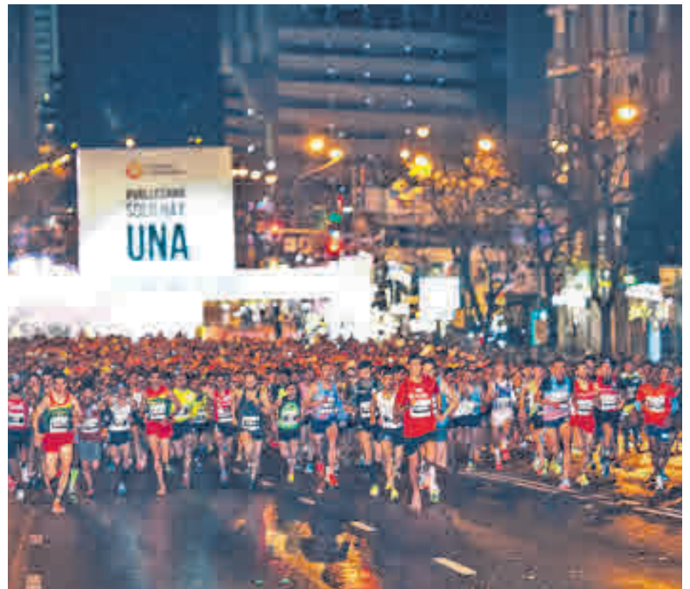
La San Silvestre, principal referente deportivo de estas fechas