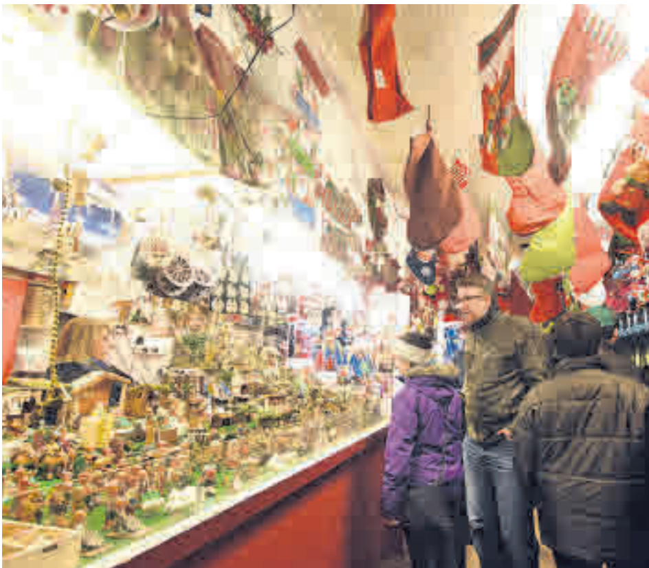
Los mercadillos toman las calles de muchas ciudades