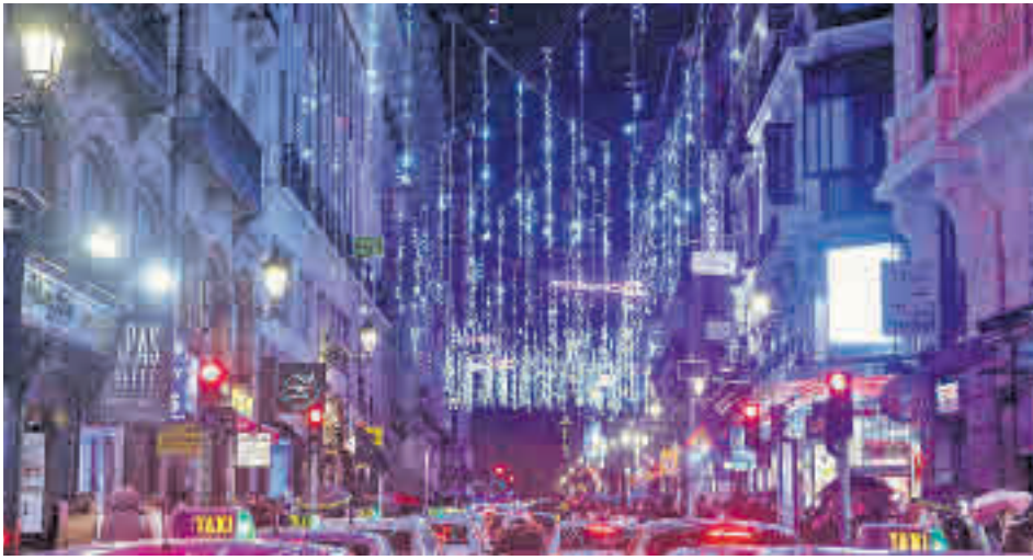
Parte del alumbrado de este año