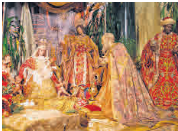
El portal situado en la parroquia de San Ginés