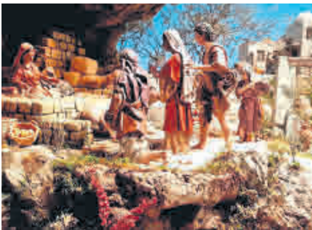
El Nacimiento de la Catedral de La Almudena