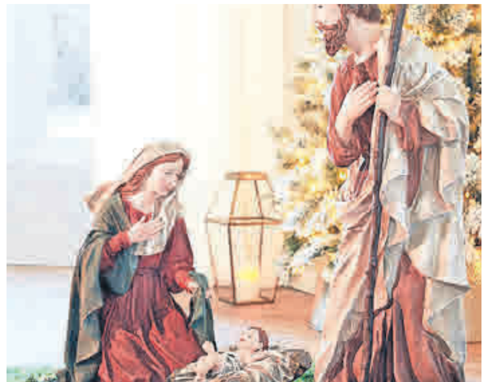
Introduce bases de musgo en el Belén EL CORTE INGLÉS

Finalmente, junto a arreglos naturales, una de las tendencias más destacadas en la actualidad son las lámparas y guirnalda elaboradas con luces LED. Salazar se declara seguidora de este tipo de iluminación y aconseja añadirla a centros florales o coronas de Adviento.