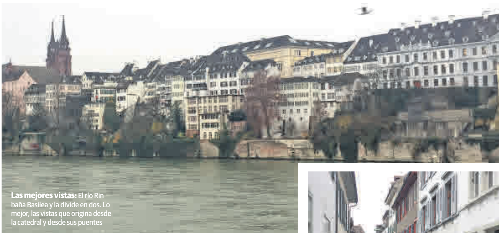
Las mejores vistas: El río Rin baña Basilea y la divide en dos. Lo mejor, las vistas que origina desde la catedral y desde sus puentes