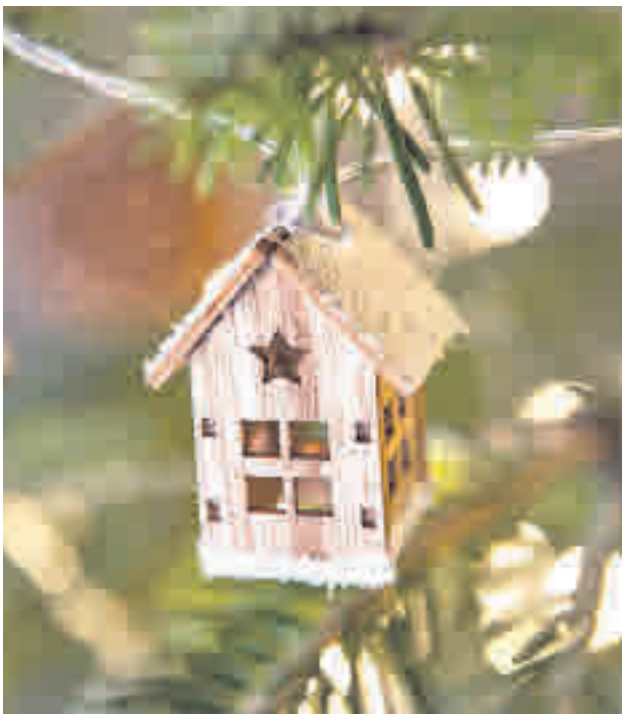
Añade figuras de madera MUY MUCHO