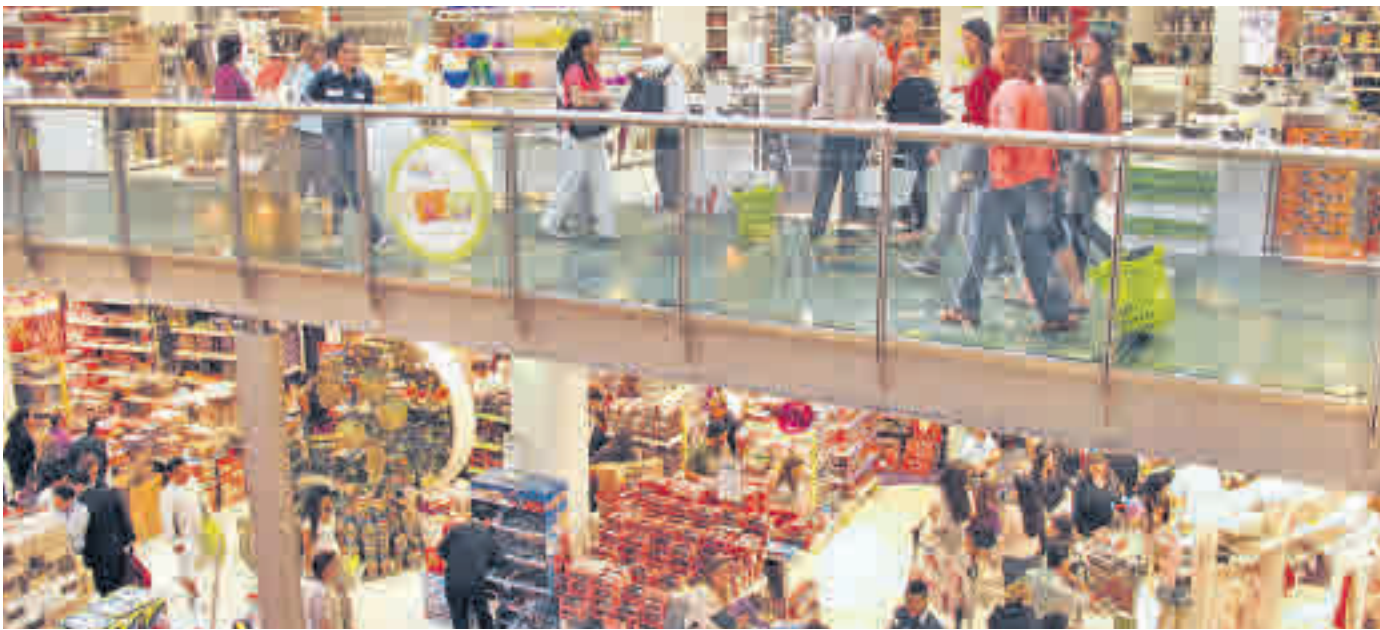
Los centros comerciales reciben gran cantidad de visitantes estos días