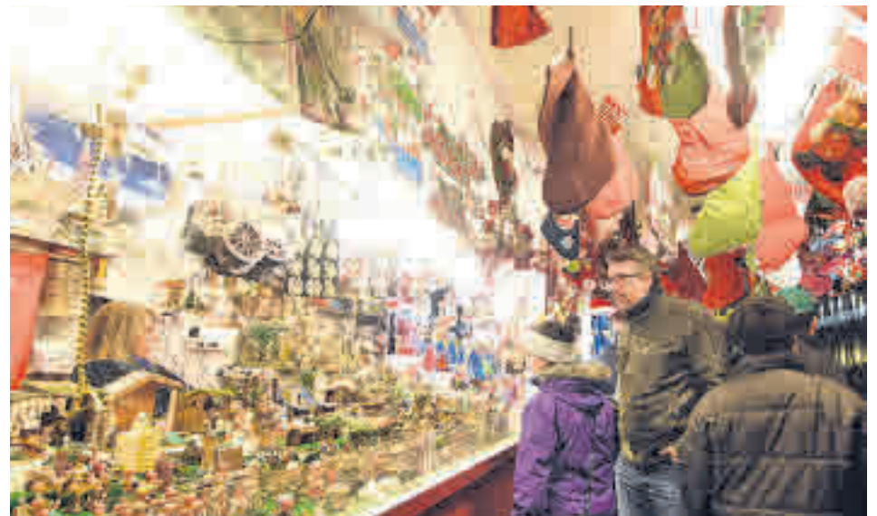
Los mercadillos toman las calles de muchas ciudades

Las grandes ciudades se han dado cuenta con los años de la importancia de la iluminación navideña. Más allá de incentivar a la gente a salir de sus casas, han pasado a convertirse en un excelente reclamo para atraer visitantes desde antes incluso de los días más relevantes. Tanto