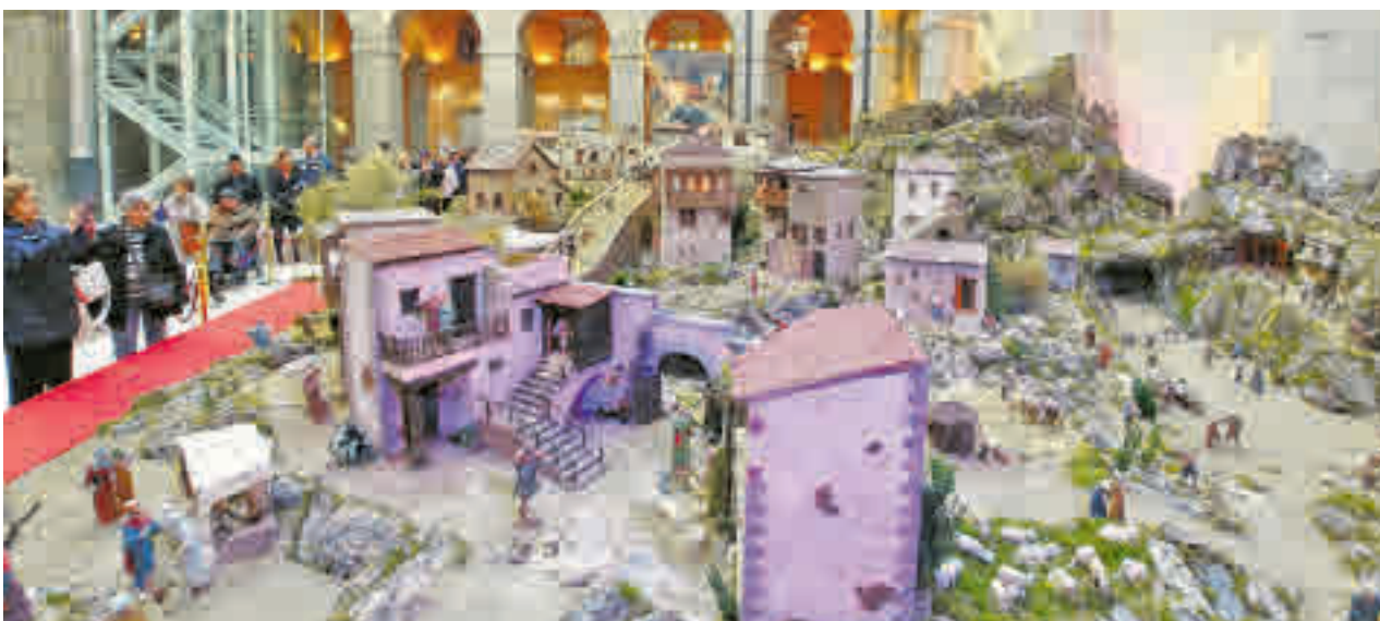
El Belén de la Real Casa de Correos