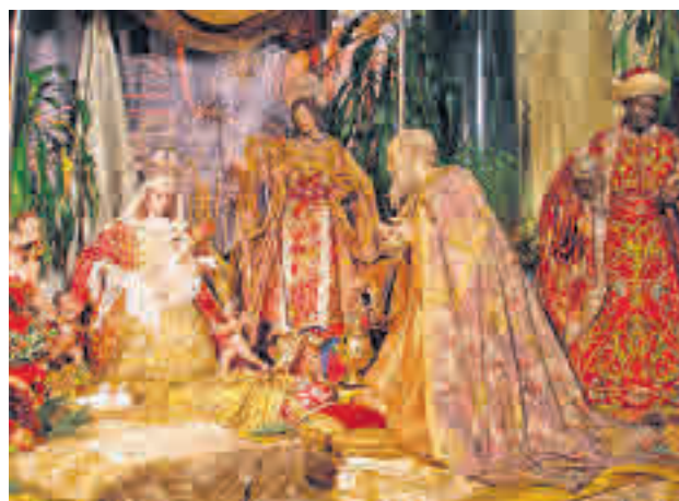
El portal situado en la parroquia de San Ginés