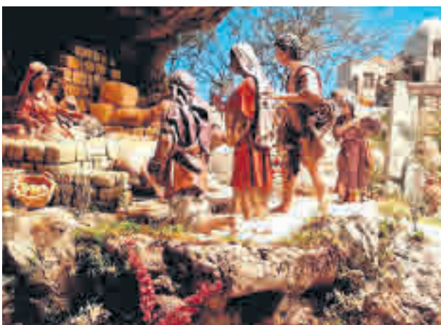
El Nacimiento de la Catedral de La Almudena