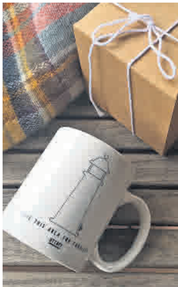
La firma Uttopy apuesta por los regalos solidarios