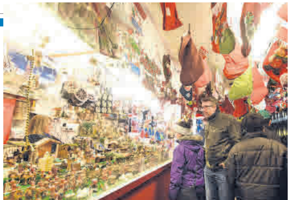
Los mercadillos toman las calles de muchas ciudades

Las grandes ciudades se han dado cuenta con los años de la importancia de la iluminación navideña. Más allá de incentivar a la gente a salir de sus casas, han pasado a convertirse en un excelente reclamo para atraer visitantes desde antes incluso de los días más relevantes. Tanto