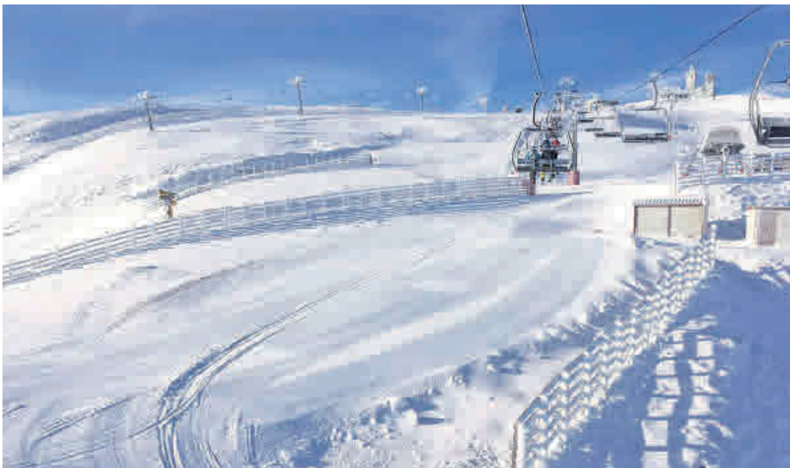
Valgrande-Pajares lidera el ránking

LA ASTURIANA DE VALGRANDE-PAJARES SE SITÚA COMO LA MÁS ASEQUIBLE