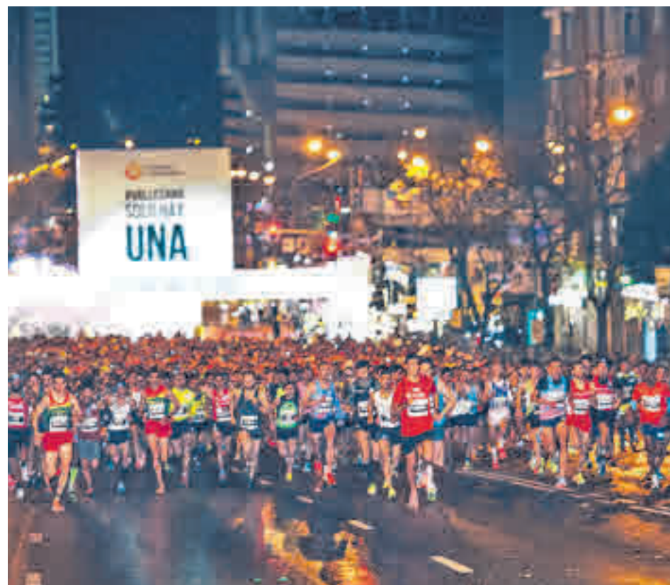
La San Silvestre, principal referente deportivo de estas fechas